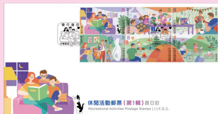
● 預銷首日戳套票封