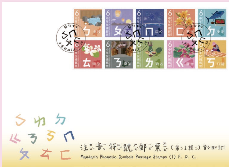
• 預銷首日戳套票封