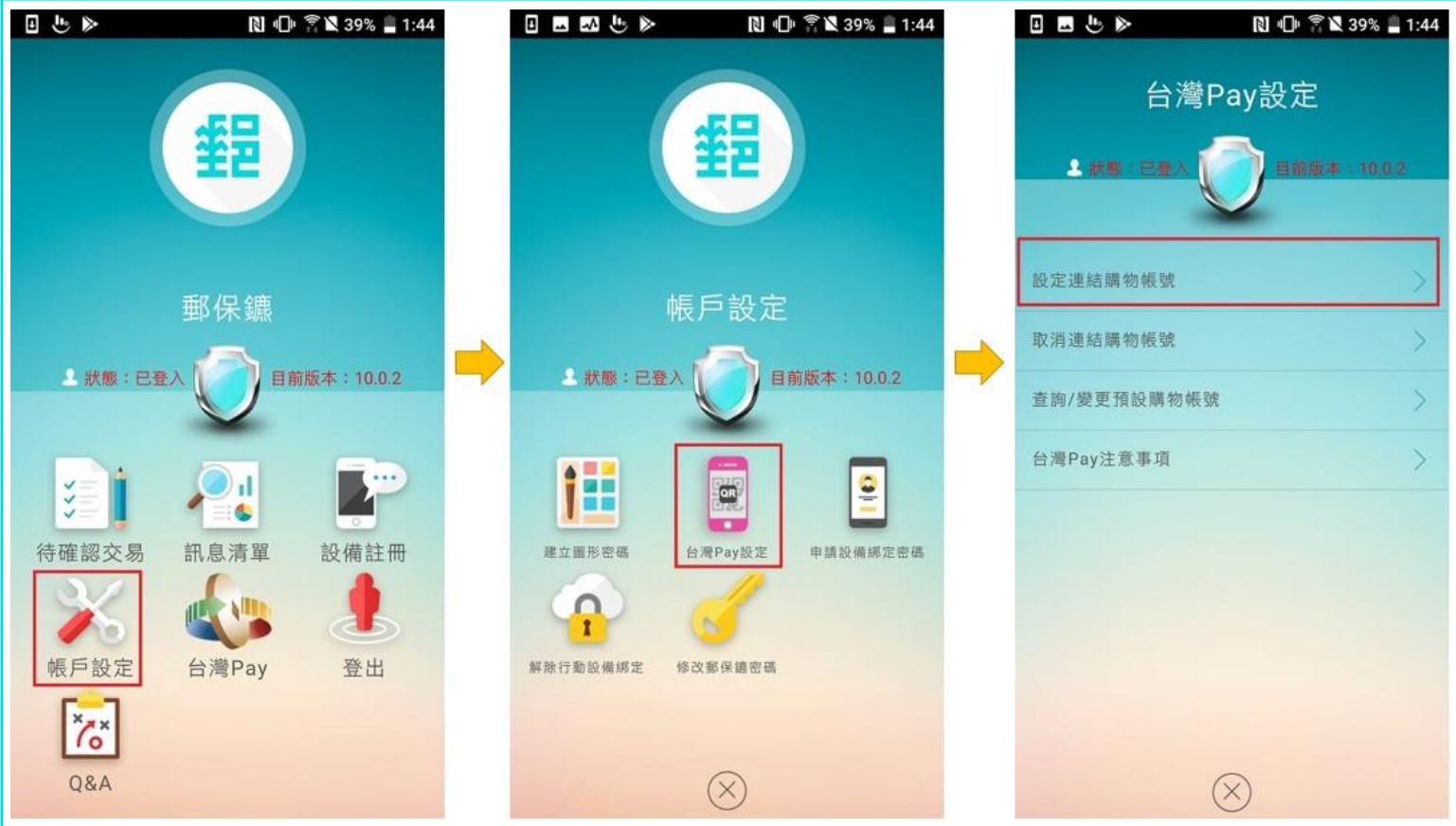
登入「郵保鑰」APP，選擇「帳戶設定」>「台灣Pay設定」選擇「設定連結購物帳號」選項。