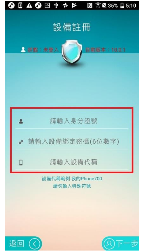
開啟「郵保鑰」APP並完成設備註冊(須申請設備綁定密碼)