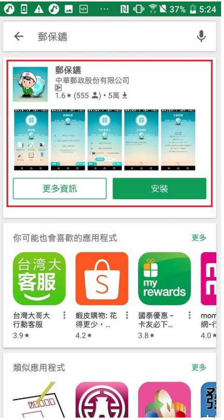
於Play商店/App Store 搜尋「郵保鑰」APP