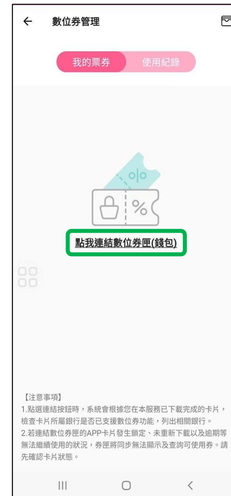
點選 「點我連結數位券匣(錢包)」 4