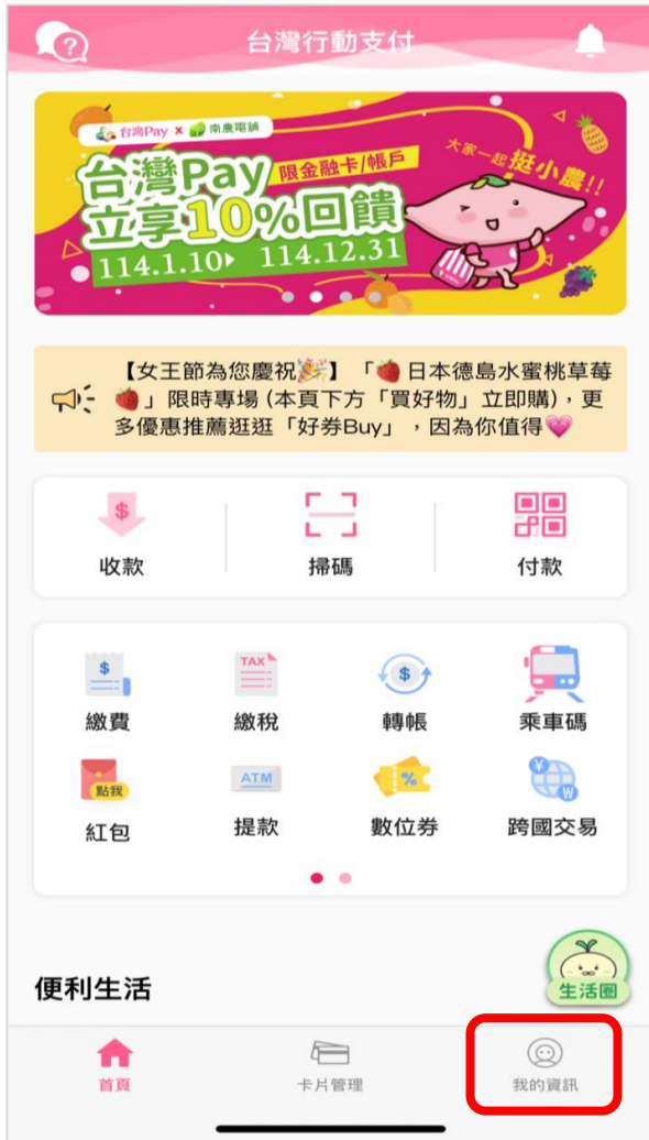
點選「我的資訊」圖示