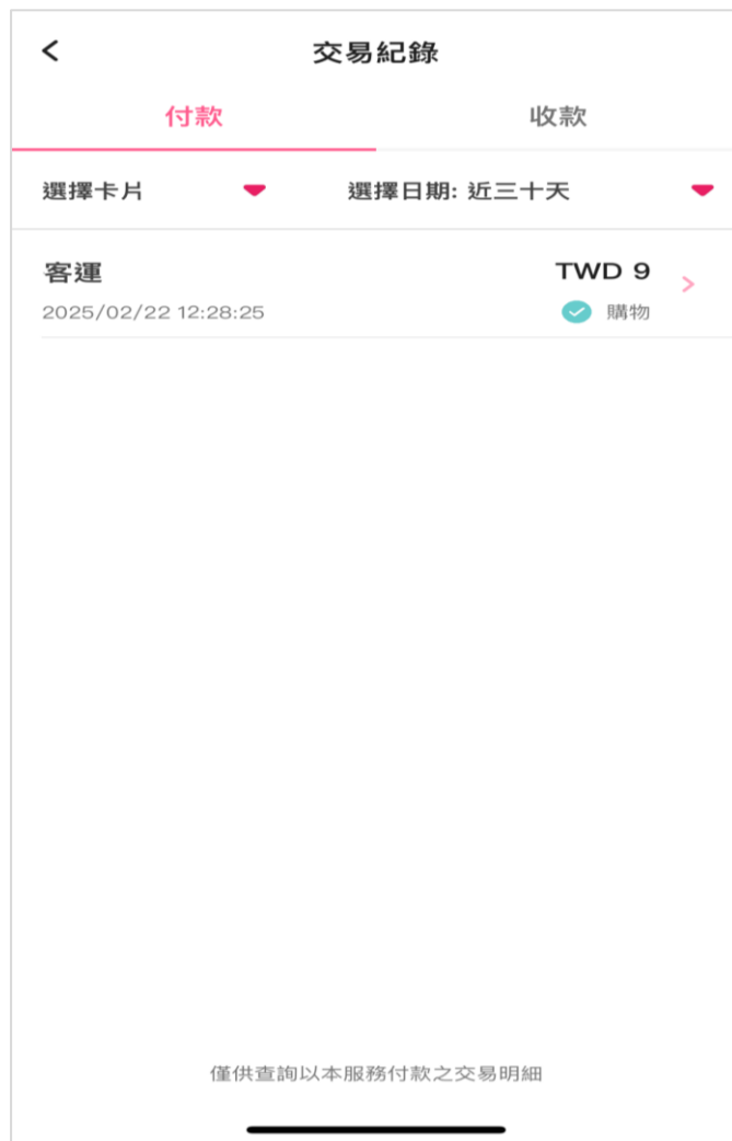
選擇欲退款之交易