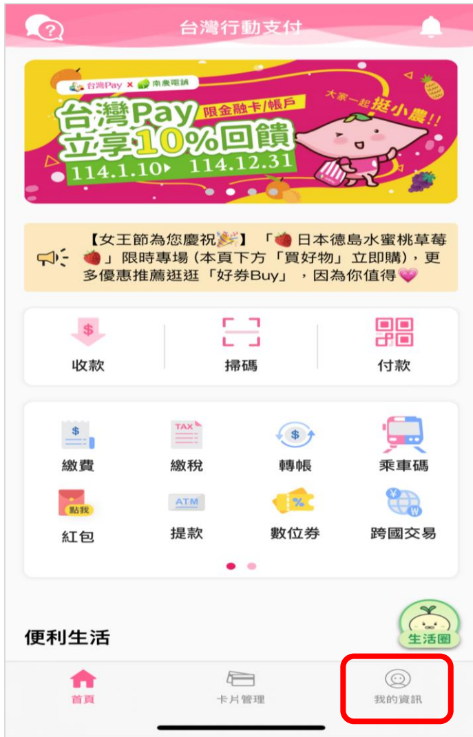
點選「我的資訊」圖示