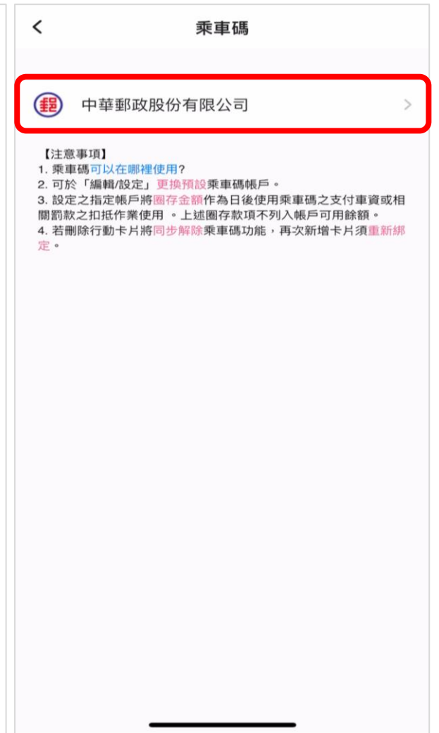
選擇中華郵政股份有限公司