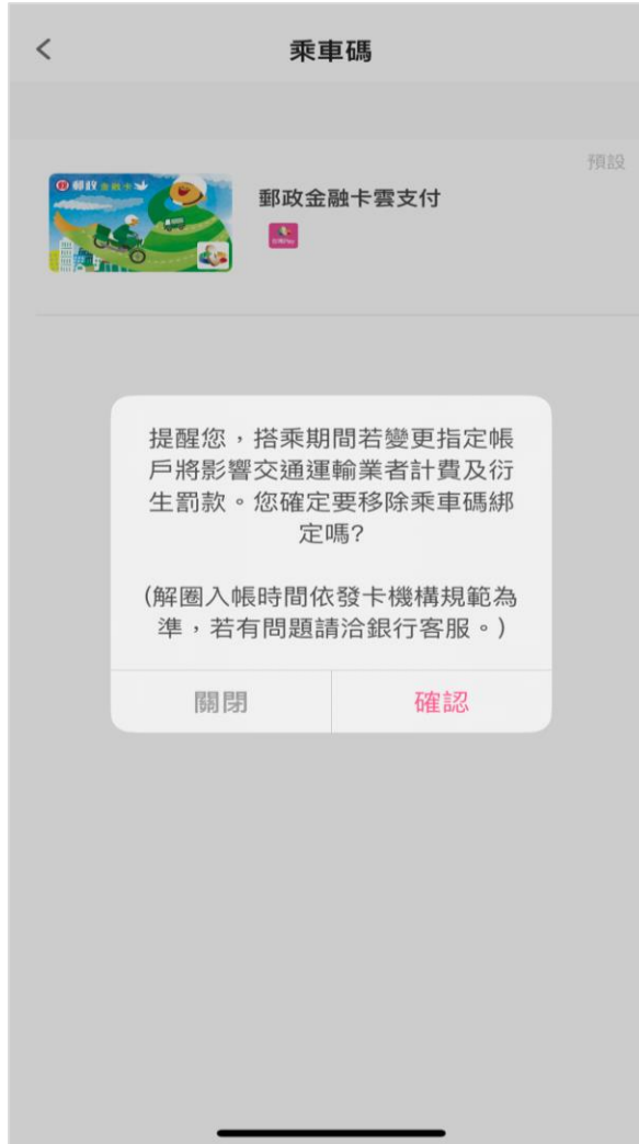
提示確認是否移除綁定乘車碼