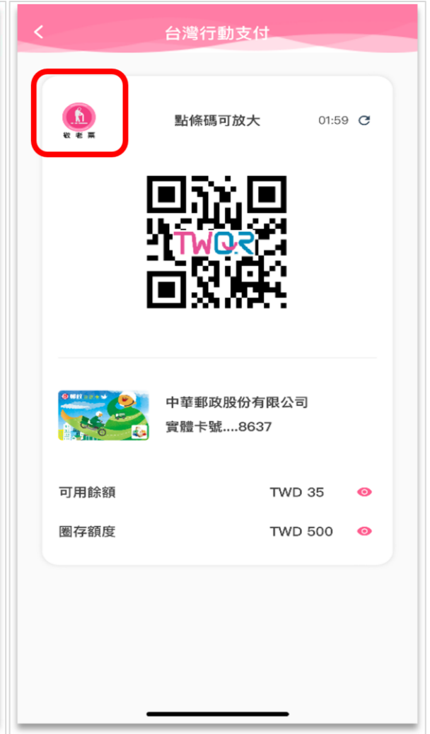
產出乘車碼(敬老票)