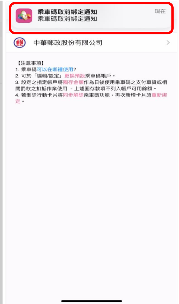
乘車碼取消綁定通知