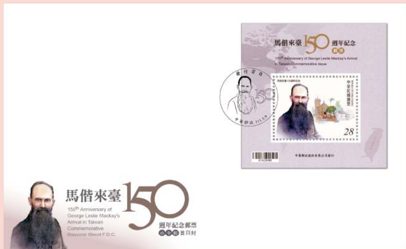
• 預銷首日戳小全張封