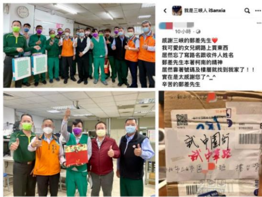
記者黃秋備 / 新北報導

中華郵政效率高分為國人所稱道，尤其使命必達的溫馨表現更是讓寄件人與收件人感動不已。