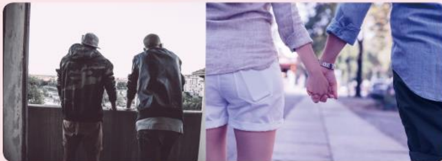
青年們常為了獲得同儕認同或因嚮往兩性關係而受誘踏入吸毒的不歸路。

青年們因為課業、工作、情感等等壓力之下，常常成為販毒集團覬覦的最佳對象。而為了能打入同儕團體，迎合認同，最後落入損友，或販毒集團的陷阱，沾染毒品，無法自拔；有些人因毒癮更深、積重難返，選擇同流合汙，還拉攏更多人，再也走不出惡魔交易的圈套。而許多青年也抱持著：「反正免錢的，試一下也不會怎樣。」或是自信「我沒有那麼肉腳，試一次就上癮的啦！」，殊不知毒品的成癮性，絕不是像感冒一樣，有著一帖特效藥等著，可以隨時服用，讓毒癮瞬間見效。