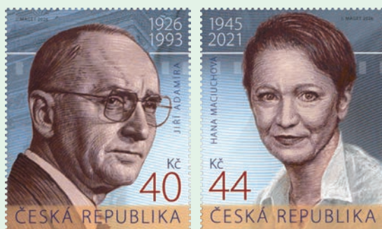
圖 71 ~ 圖 72