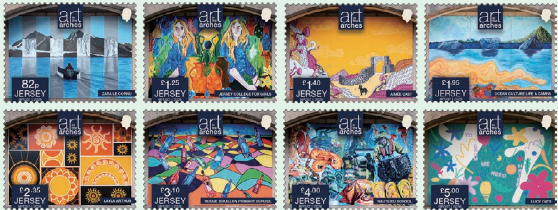
圖 129 ~ 圖 136