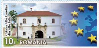
圖 155 ~ 圖 157

擁有巨大的地窖、厚實的牆壁、射擊孔以及門廊，是戈爾日縣珍貴的歷史遺產，為罕見的羅馬尼亞建築風格。