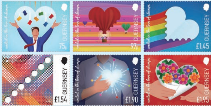
圖 35~圖 40

1. 2026年4月1日發行6枚「歐羅巴系列：70週年郵票」(圖35-40)和1張小型張(圖41)。2026年是歐羅巴郵票發行70週年，根西島郵政已參與這項歷史悠久的傳統達50年。郵圖為：(1) 7枚飄落的郵票；(2) 7個心型氣球；(3) 7色彩虹風箏；(4) 7個齒孔(2026年歐洲郵票通用設計)；(5) 7種放射狀顏色；(6) 7朵花。小型張郵圖為7位集郵家坐在一起進行集郵交流活動，以突顯集郵樂趣，展現集郵亦是將人們聯繫在一起的方式。