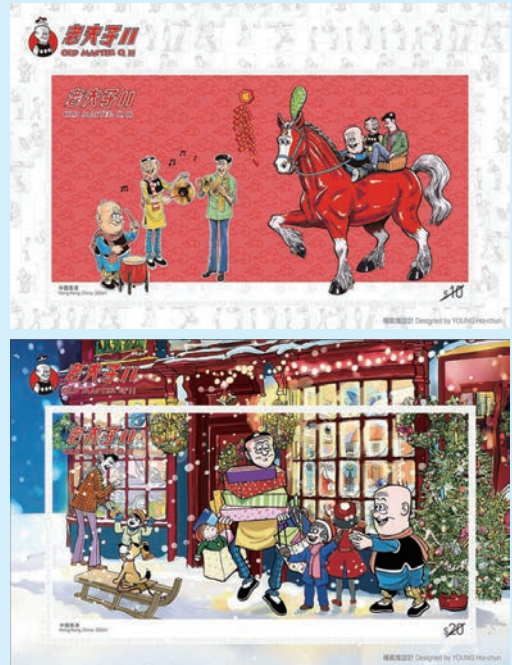
圖 99~圖 100

2. 2026年4月30日發行4枚「兒童郵票—成語動物園」（圖101-104），以生動的插圖呈現動物元素的成語。郵圖為： （1）鶴立雞羣：比喻才能出眾的人在人群中會顯得突出。西晉時，惠帝的侍從嵇紹身材高大，儀表堂堂；在八王之亂期間，嵇紹寸步不離地保護惠帝，最後更捨身替他擋箭。有人目擊嵇紹在內亂中英勇無畏，形容他就像野鶴站在雞羣之中般突出。 （2）如虎添翼：比喻強者或實力雄厚者獲得有利條件後，力量變得更強大。諸葛亮是三國時著名的政治家和軍事家，他在《心書》提到掌握兵權的將領，就像長出翅膀的