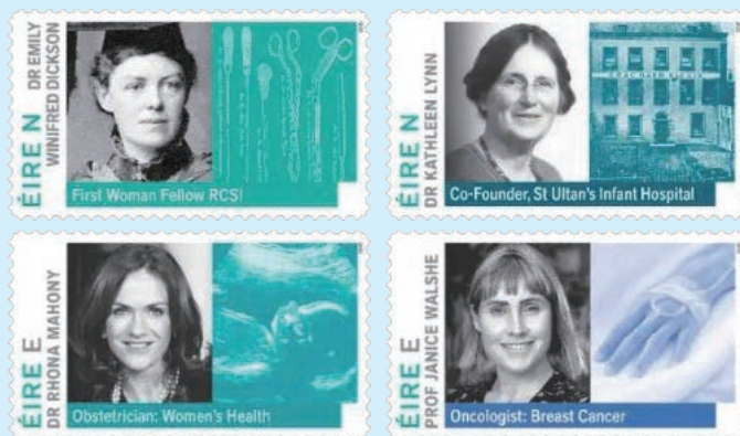
圖 225 ~ 圖 228

2026 年 3 月 5 日發行 4 枚「國際婦女節－女性醫學家郵票」（圖 225-228）。在 1876 年《醫學法》改革前，愛爾蘭女性無法獲得醫療執業資格，1877 年愛爾蘭皇家內科醫學院成為英國與愛爾蘭地區首座允許女性參加執照考試的機構，愛爾蘭皇家外科醫學院也於 1885