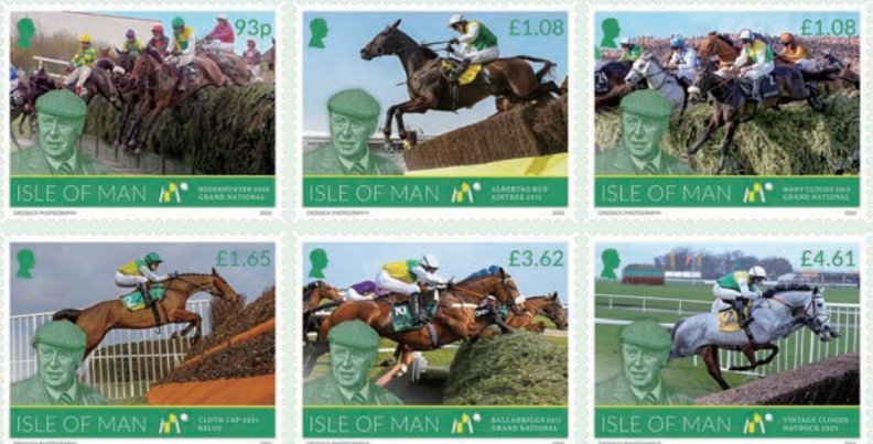
圖 187~圖 192