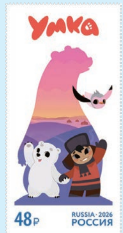
圖 184~圖 186