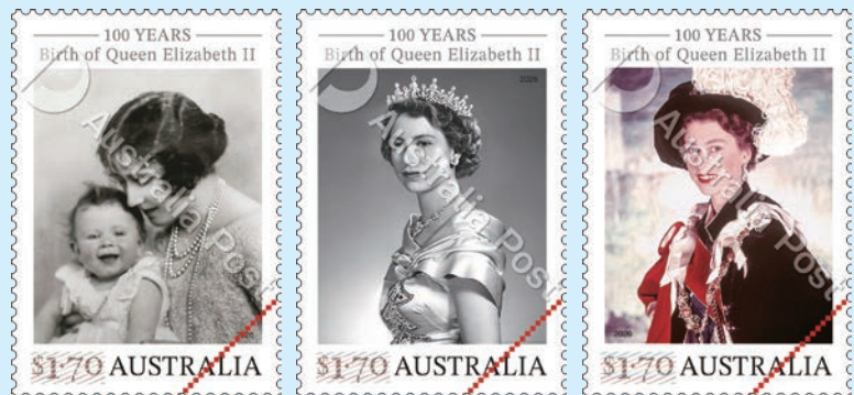
圖 65~圖 67

1. 2026 年 4 月 7 日發行 3 枚「伊莉莎白二世女王誕生百週年郵票」（圖 65-67）。伊莉莎白二世女王與菲利普親王於 1954 年訪問澳大利亞，是第一位訪問澳大利亞的英國君