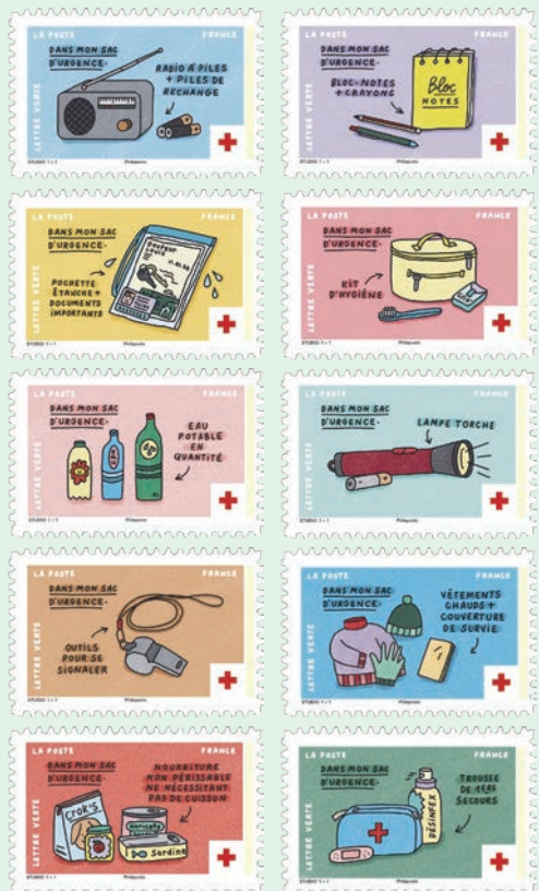
圖 10~圖 19

5. 2026 年 4 月 27 日發行 10 枚「紅十字會防災應急包郵票」(圖 10-19)。法國政府與紅十字會建議家庭準備防災應急包，也就是避難包，以應對自然災害、停電或突發安全危機的初期 72 小時，核心物品包括至少 6 公升瓶裝水、10 餘罐不易腐壞食品、手電筒、電池、急救包、常備藥、重要文件影本及現金。郵圖為：(1) 電池收音機 + 備用電池；(2) 記事本 + 鉛筆；(3) 防水袋 + 重要文件；(4) 衛生用品包；(5) 充足的飲用水；(6) 手電筒；(7) 信號工具；(8) 保暖衣物 + 救生毯；(9) 不易腐壞的食物 (無需烹調)；(10) 急救包。