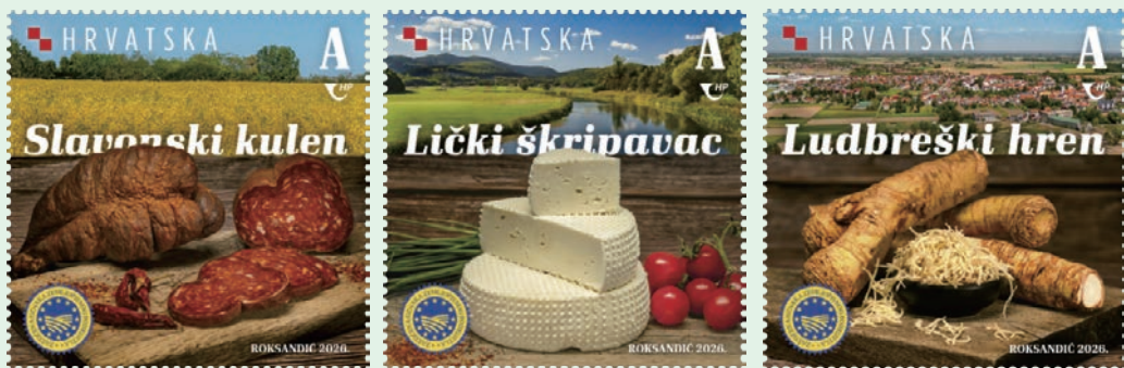
圖 203 ~ 圖 205

3. 2026 年 4 月 22 日發行 1 枚「應對氣候變化行動：洪水的風險郵票」（圖 206）。近幾十年來，亞得里亞海沿岸的洪水發生頻率增加，此趨勢將在未來 50 至 100 年內持續發生，對人口、環境和基礎設施造成損害。由於氣候變化，預計到 2100 年，克羅埃西亞的海平面可能上升 32 至 65 公分。若不採取減緩和適應氣候變化的措施，洪水造成的直接損失可能增加 6 倍。因此，透過採取適當策略應可顯著減輕全球暖化的影響。