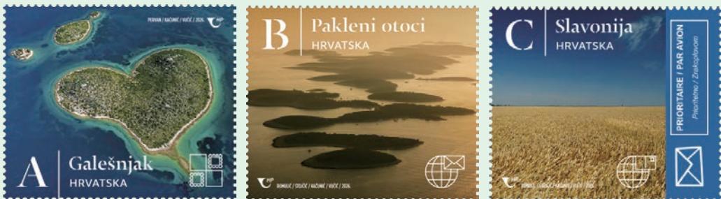
圖 200~圖 202