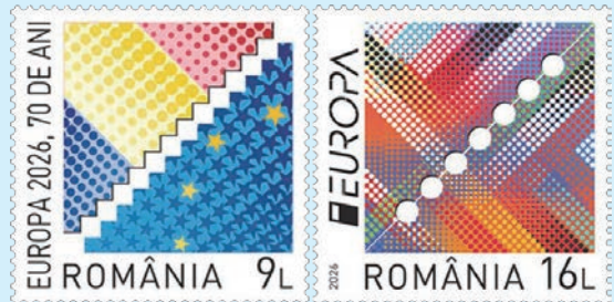
圖 144~圖 145