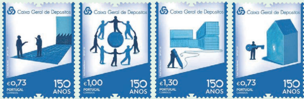
圖 167~圖 170