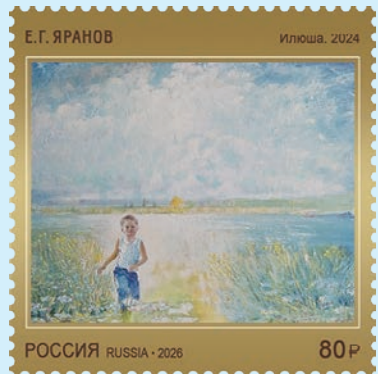
圖 181~圖 182

7. 2026 年 4 月 9 日發行 1 枚「俄羅斯聯邦太空週郵票—紀念人類首次太空飛行 65 週年」(圖 183)。每年 4 月 12 日是世界宇航日，1962 年在人類首次太空飛行一週年之際，蘇聯設立世界宇航日。6 年後，更名為「國際航空與宇航日」。2011 年 4 月 8 日，聯合國大會將該節日更名為「國際載人太空飛行日」。2025 年 12 月 29 日，俄羅斯總統普丁宣布於俄羅斯舉辦太空週，旨在宣揚俄羅斯航太探索的成就，並提升航太相關職業的地位。2026 年的太空週，紀念由蘇聯太空人尤里·加加林完成人類的首次太空飛行 65 週年。