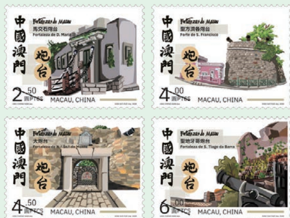
圖 56~圖 59

2026年4月8日發行4枚「澳門炮台郵票」（圖56-59）和1張小型張（圖60）。自17世紀起，澳門因抵禦外敵及海盜，逐步構建以炮台為核心、由城牆連接且依山勢而建的海防體系。現存炮台遺跡保存完整，是澳門海防體系及城市發展歷程的重要見證。郵圖為：（1）馬交石炮台：1852年啟用，扼守澳門半島東北部海岸；（2）聖方濟各炮台：1629年竣工，位於半島東南海岸、南灣北