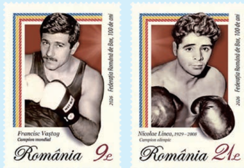
圖 137 ~ 圖 138

1. 2026 年 3 月 26 日發行 2 枚「羅馬尼亞拳擊聯合會百年慶典郵票」(圖 137-138) 和 1 張小型張 (圖 139)。