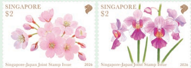
圖 63~圖 64

新加坡與日本郵政於 2026 年 4 月 27 日聯合發行 2 枚「友誼綻放：慶祝新日建交 60 週年郵票」（圖 63-64）。2026 年是新加坡與日本建交 60 週年，為兩國的重要里程碑，自 1966