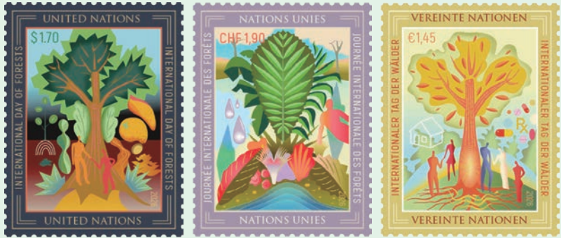
圖 229 ~ 圖 231

2026 年 3 月 20 日發行 3 枚「國際森林日郵票」（圖 229-231）。每年 3 月 21 日為「國際森林日」，2026 年的主題為「森林與經濟」，強調森林在驅動經濟繁榮中所扮演的核心角色。隨著邁