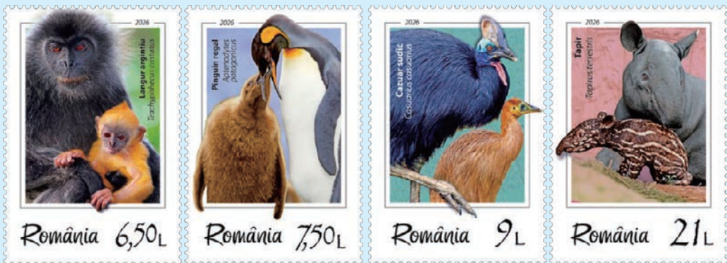
圖 146~圖 149