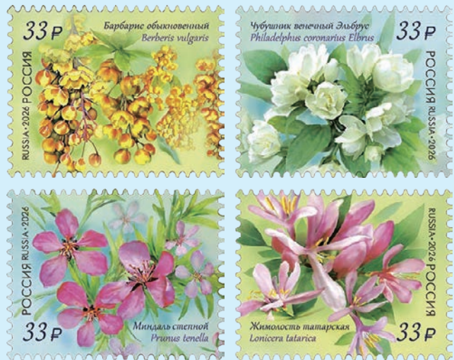
圖 177~圖 180

5. 2026年3月31日發行4枚「俄羅斯植物誌郵票—觀賞灌木」(圖177-180)。觀賞灌木是木本植物，具有許多被樹皮覆蓋的細長而堅韌的枝幹，比喬木矮小，沒有主幹，樹冠茂密，果樹和漿果灌木具有重要的經濟價值。觀賞灌木主要用於裝飾花園、公園、廣場以及城鄉景觀的區域，也可用於室內外綠化、區域劃分和綠籬種植。郵圖包括刺楸、山梅花、矮扁桃和韃靼金銀花。