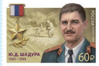
圖 173~圖 174

2. 2026年3月25日發行2枚「俄羅斯聯邦英雄系列郵票」（圖173-174）。郵圖為2名在履行軍事職責或執行特殊任務時展現勇氣和英雄氣概、被迫授俄羅斯聯邦英雄稱號的軍官：