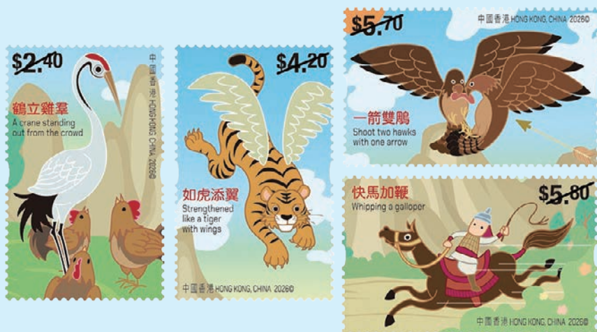
圖 101 ~ 圖 104

說：「我也認為你值得鞭策。你要像快馬一樣追求進步啊！」自此，耕柱子便發奮求學，不再需要老師整日督促。（威聯）