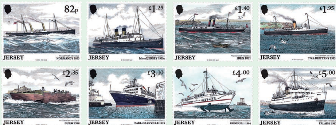
圖 121~圖 128

2. 2026年4月2日發行8枚「拱門下的藝術郵票」（圖 129-136）。此系列郵票收錄參與澤西島藝術之家「拱門下的藝術」計畫的當地藝術家、學校和社區團體創作的藝術作品，2025年以「藍色之外」（Out of the Blue）為主題。郵圖為：（1）Zara Le Cornu〈No Planet B〉；（2）澤西女子學院〈一位女性，為所有女性〉；（3）Aimee Cast〈未知彼方〉；（4）海洋生物中心與澤西島兒童及青少年心理健康中心〈Tide Together〉；（5）Layla Arthur〈陽光〉；（6）Rouge Bouillon 小學〈給未來自己的訊息〉；（7）豪特利厄學校〈海之果實（漁夫）〉；（8）Lucy Oats〈拯救我，我也將拯救你〉。這些藝術作品被設置於伊麗莎白碼頭。（明華）