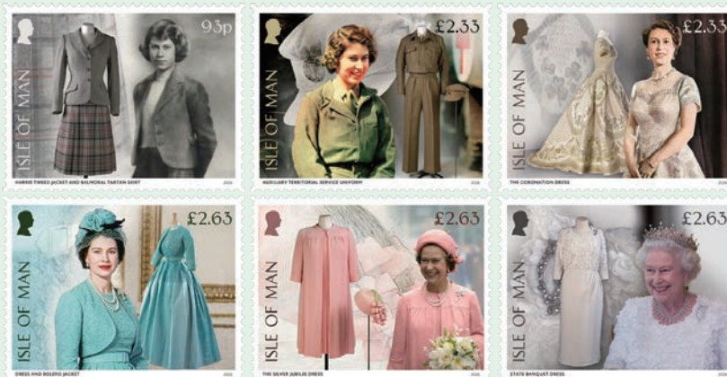
圖 193~圖 198

地服務隊制服、加冕禮服、連衣裙與短夾克套裝、銀禧慶典套裝及國宴禮服，反映女王衣櫥在個人與公共層面的重要意義。(查爾斯)