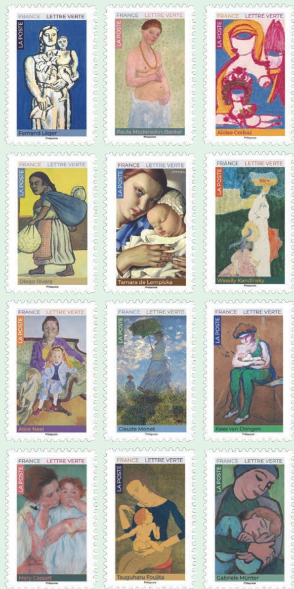
圖 21~圖 32

7. 2026 年 5 月 11 日發行 12 枚「母與子：藝術家的視角郵票」（圖 21-32）。在西方繪畫中，母親和母性的形象長期以來受到基督教文化影響，呈現聖母子的理想化形象。直到 19 世紀末，藝術家對母性的觀看才逐漸轉變，呈現不同的視角。郵圖為：（1）費爾南·雷捷的作品《女人與孩子》；（2）保拉·莫德索恩·貝克爾的《裸體自畫像》；（3）阿洛伊絲·科爾巴茲的《母與子》；（4）迪亞哥·李維拉《背著小孩的母親》；（5）塔瑪拉·德·倫皮卡的《母親與孩子》；（6）瓦西里·康丁斯基的《夏日》；（7）艾莉絲·尼爾的《琳達·諾克林和黛西》；（8）克洛德·莫內的《撐陽傘的女人》；（9）凱斯·凡·東根的《孕婦》；（10）瑪麗·卡薩特的《綠色背景的母亲與孩子》；（11）藤田嗣治的《母與子》；（12）加布里埃爾·蒙特的《懷抱熟睡孩子的母親》（1934）。