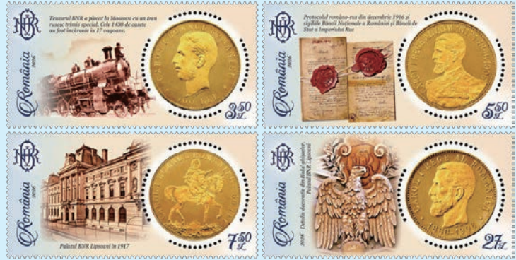
圖 150 ~ 圖 153

「在莫斯科的羅馬尼亞國家銀行金幣郵票」（圖 150-153）和1張小型張（圖 154）。郵票為1906年發行的羅馬尼亞金幣正面圖案，小型張圖案為一枚1870年發行的羅馬尼亞硬幣正面，硬幣上印有卡羅爾一世的肖像。