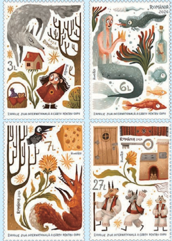
圖 140~圖 143