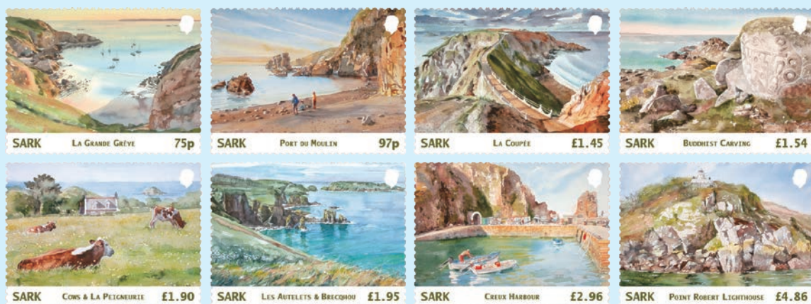
圖 48~圖 55

3. 2026年4月1日發行8枚「藝術家視角郵票」（圖48-55），郵圖呈現：（1）La Grande Grève：位於大薩克島和小薩克島之間 La Coupée 地峽下方，以優美的海灣景色和沙灘聞名；（2）磨坊港；（3）La Coupée 地峽：連接大薩克島與小薩克島，以其陡峭懸崖景觀聞名；（4）佛教雕刻：由堅硬的花崗岩製成，是一位藏族僧侶為迎接千禧年而雕刻；（5）牛隻與 La Seigneurie：La Seigneurie 為薩克島的薩克領主官邸，始建於1675年，是該島的權力中心；（6）奧特萊岩柱群和布雷庫島：位於薩克島西海岸；（7）克魯港：薩克島歷史悠久的登陸點之一；（8）羅伯特角燈塔：建於1913年，位於薩克島羅伯特角懸崖半山腰。（凡軒）