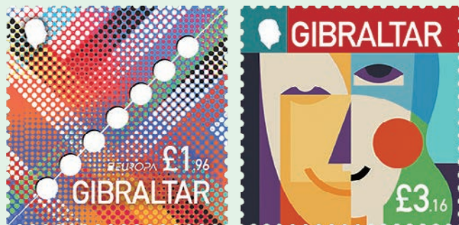
圖 105 ~ 圖 106

1. 2026 年 3 月 30 日發行 2 枚「2026 歐羅巴 70 週年郵票」（圖 105-106）。郵圖為芬蘭設計師克勞斯·韋爾普「2026 歐羅巴 70 週年郵票」的獲獎作品：（1）面值 1.96 英鎊「進步線」：一條斜向上延伸的虛線既代表郵票的傳統齒孔，也代表歐洲郵政服務的前進動能；而 7 個點由一條線連接，代表各國 70 年來的共同努力和溝通；（2）面值 3.16 英鎊的郵票：為直布羅陀週年紀念特別創作的藝術作品，這枚郵票運用現代圖形元素和獨特的配色方案，展現直布羅陀在歐洲大家庭中的獨特存在。