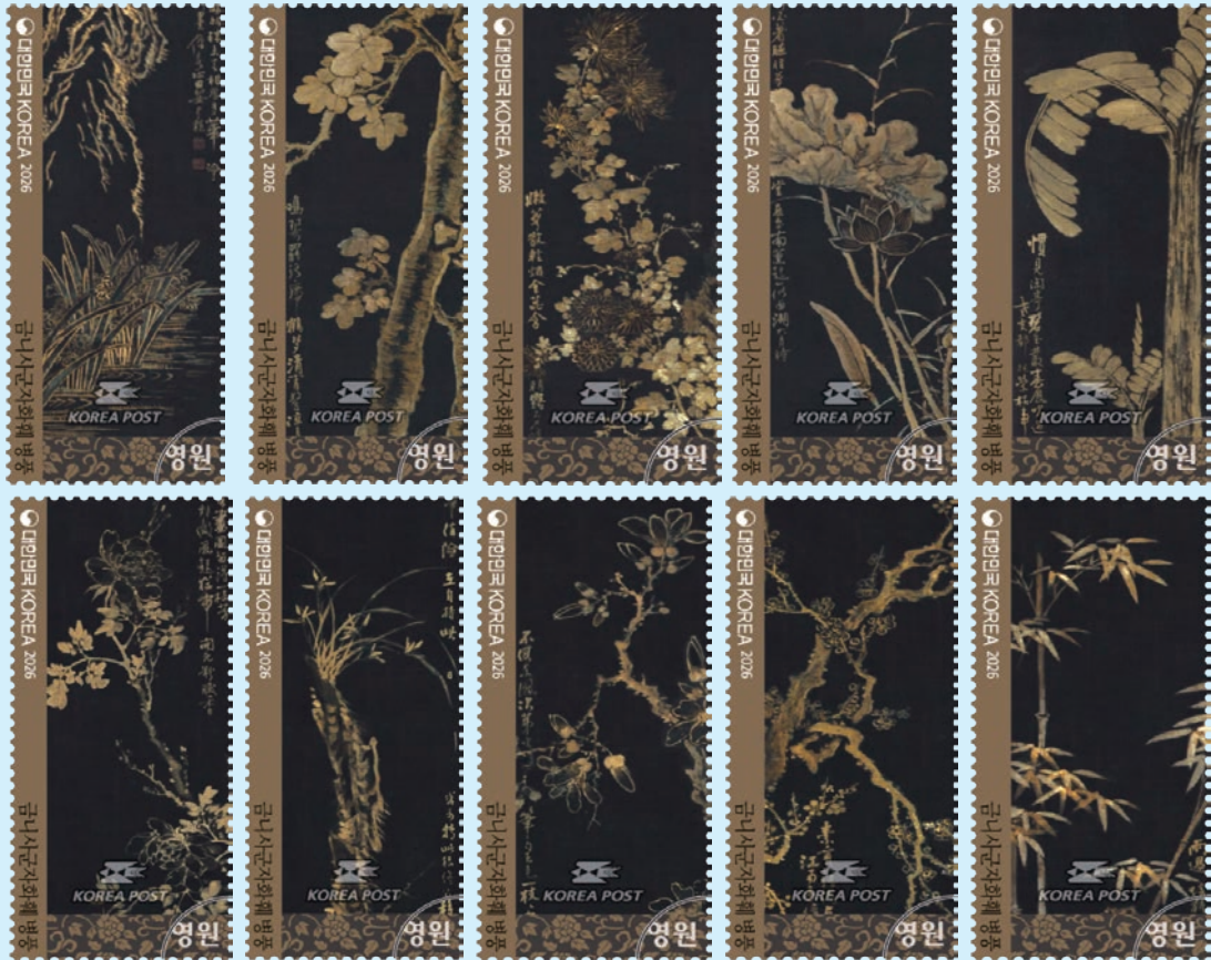
圖 232 ~ 圖 241

的「金泥」創作，這種顏料在捕捉光線時，會散發出溫潤且優雅的金屬光澤。構圖上打破傳統「四君子：梅、蘭、菊、竹」的範疇，大膽將象徵高貴與清雅的辛夷（木蘭）、牡丹、芭蕉、蓮花、梧桐與水仙融入其中。每摺屏風的植物線條細膩、構圖嚴謹，展現出宮廷藝術的高度美感。（奇尼）