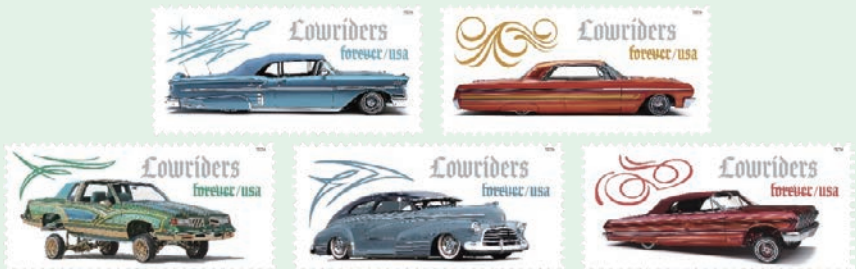
圖 219~圖 223

1. 2026年3月13日發行5枚「低底盤汽車郵票」(圖219-223)。「低底盤汽車」文化起源於二戰後的美國西南部。奇卡諾