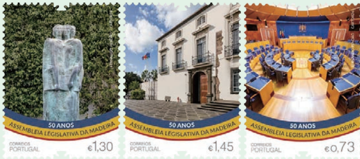
圖 163 ~ 圖 165

2. 2026 年 3 月 20 日發行 3 枚「馬德拉自治區成立 50 週年郵票」(圖 163-165) 和 1 張小型張 (圖 166)。馬德拉自治區自 1976 年成立，數十年來不斷強化自身特色，實現基礎建設現代化。每年 4 月 2 日，馬德拉人都會慶祝自治日，回顧其獨特的歷史和過去半個世紀的成就。為慶祝成立 50 週年，馬德拉舉辦一系列文化活動、展覽、音樂會和官方表彰儀式。