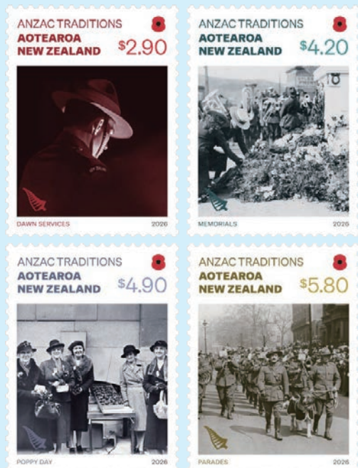
圖 75~圖 78