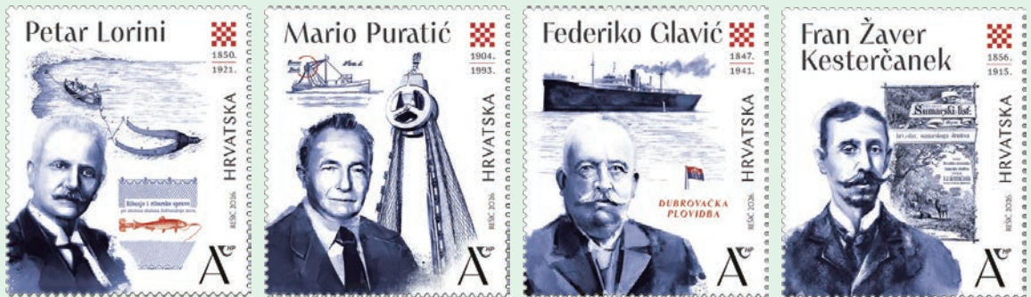
圖 207~圖 210