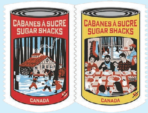
圖 61~圖 62

2026 年 3 月 19 日發行 2 枚「糖屋（2026）郵票」（圖 61-62），郵圖為楓糖漿罐造型。位於楓樹林中的「糖屋」是將由楓樹採集樹液煮成楓糖漿的小型木屋，每年 3 月至 4 月，這些地方會舉辦傳統節慶，人們可以品嚐淋上楓糖漿的特色美食、體驗在雪地上製作楓糖及太妃糖，以慶祝春季到來的文化體驗。「糖季」的傳統已成為魁北克文化和認同中不可或缺的一部分，並被列入該省的非物質文化遺產名錄。郵票設計靈感來自 1940 和 50 年代的流行藝術、商業和廣告藝術，描繪人們共享美食及戶外時光的繽紛場景。（凡軒）