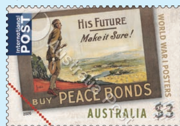
圖 68 ~ 圖 69