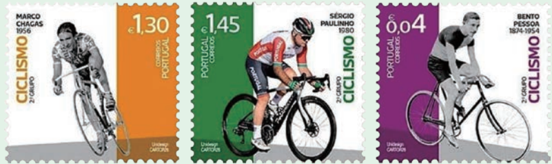
圖 158 ~ 圖 162