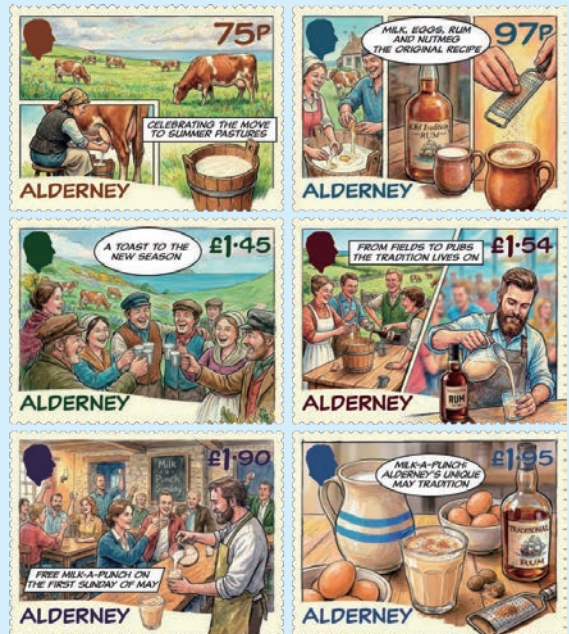
圖 42~圖 47

2. 2026年4月1日根西島郵政為奧爾德尼島發行6枚「牛奶潘趣酒節郵票」(圖42-47)。「牛奶潘趣酒節」於5月的第1個星期日舉行，標誌冬夏交替的季節更迭。人們常在島上的酒吧慶祝這個節日，共享的飲品已成為熱情好客和傳承的象徵。牛奶潘趣酒是一種以牛奶為基底的白蘭地或波本威士忌飲品。郵圖為：(1) 將牛隻遷往夏季牧場；(2) 原配方，在鮮牛奶中加入雞蛋、蘭姆酒和肉荳蔻；(3) 為新季節乾杯；(4) 從田野到酒吧；(5) 週日免費暢飲牛奶潘趣酒；(6) 五月傳統牛奶潘趣酒及其傳統配料的特寫。