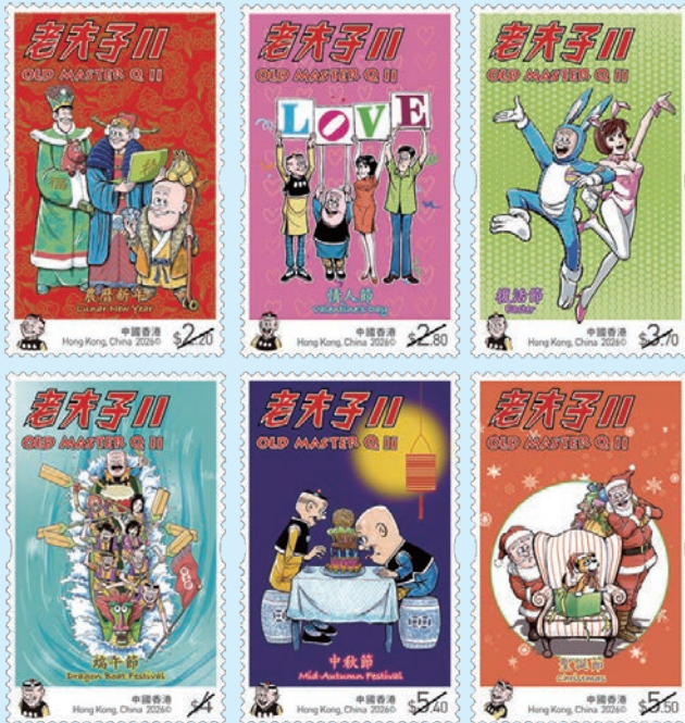
圖 93~圖 98

1. 2026年4月2日發行6枚「老夫子II郵票」（圖93-98）和2張小型張（圖99-100）。《老夫子》郵票以不同的節慶為主題，展現《老夫子》在濃厚節日氛圍中的獨特魅力及活力。郵圖為：（1）農曆新年：老夫子、大番薯和秦先生組成詼諧而吉祥的「拜年圖」；（2）情人節：老夫子、大番薯、陳小姐和秦先生聯合呈獻「愛的宣言」；（3）復活節：老夫子裝扮成活潑逗趣的「復活節兔」；（4）端午節：老夫子與夥伴上演一場別開生面的「龍舟競渡」；（5）中秋節：郵票展示明月高懸夜空，老夫子和大番薯沉醉於品嚐月餅的快樂中；（6）聖誕節：老夫子和大番薯打扮成聖誕老人，為大家送上禮物和祝福。10元小型張「馬到功成」：以「老夫子度新春」為主題，融合傳統節慶和漫畫幽默的熱鬧氣氛；20元小型張「歡度聖誕」：老夫子和大番薯化身為「採購大軍」，烘托出聖誕歡樂氣氛。