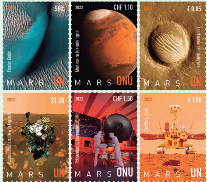
圖 122 ~ 圖 127

具一格。火星至今已被數十艘無人太空飛行器探索，1964年11月28日《美國國家航空暨太空總署》－《NASA》所發射的「水手4號」是第1架訪問火星的太空飛行器，「水手4號」於1965年7月15日時最接近該行星。火星擁有兩個天然衛星：「火衛一」（Phobos）和「火衛二」（Deimos），兩者的形狀均不規則，可能是捕獲的小行星。而火星目前有8艘的探測船正在軌道中運行，其地表