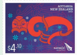
圖 29 ~ 圖 32