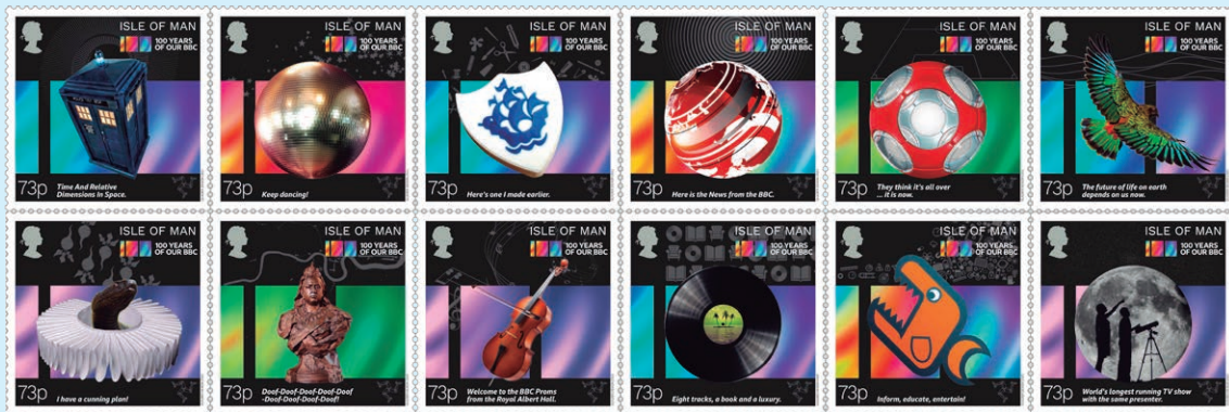
圖 163 ~ 圖 174