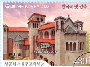
圖 129 ~ 圖 132