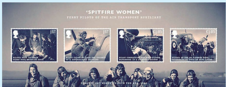
圖 43 ~ 圖 53

(11) 小全張上的 4 枚郵圖是 8 名於 1940 年首批加入航空運輸輔助隊、勇敢的女性渡輪飛行員的照片。（威聯）