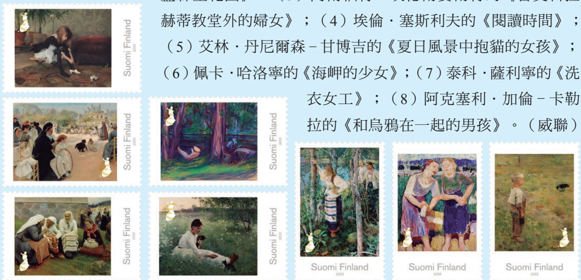
圖 77 ~ 圖 84

(1) 海倫·謝爾夫·貝克的作品《舞鞋》；(2) 阿爾伯特·埃德爾費爾特的《巴黎的盧森堡花園》；(3) 阿爾伯特·埃德爾費爾特的《魯奧科拉赫蒂教堂外的婦女》；(4) 埃倫·塞斯利夫的《閱讀時間》；(5) 艾林·丹尼爾森-甘博吉的《夏日風景中抱貓的女孩》；(6) 佩卡·哈洛寧的《海岬的少女》；(7) 泰科·薩利寧的《洗衣女工》；(8) 阿克塞利·加倫-卡勒拉的《和烏鴉在一起的男孩》。(威聯)