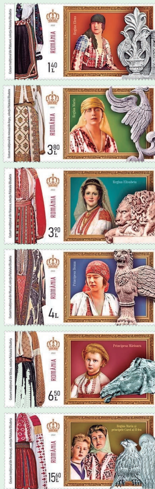
圖 87 ~ 圖 92

2. 2022 年 4 月 15 日發行 6 枚「伊麗莎白宮的藏品郵票」（圖 87-92）。郵圖展示了與伊麗莎白宮遺產中的民間服飾、羅馬尼亞王室的女后或公主的形像以及雕像元素相關聯的圖像：