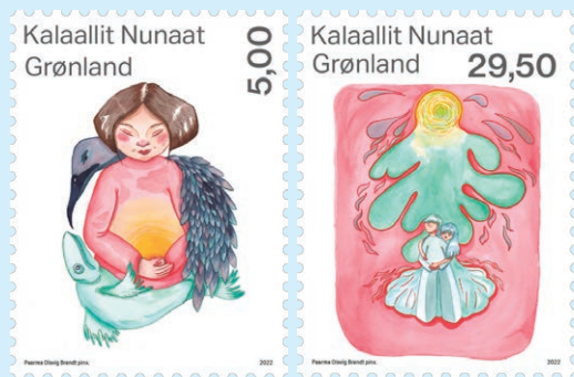
圖 190 ~ 圖 191

4. 2022 年 5 月 31 日發行 2 枚「格陵蘭島的環境 (第 5 組) 郵票」(圖 190-191)。郵票也是該系列郵票的最後一組，採用了水彩畫技法，展示了象徵格陵蘭島環境的場景，包括海洋環境和人類環境。(查爾斯)