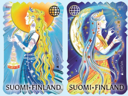
圖 71 ~ 圖 72

2. 2022 年 4 月 27 日發行 2 枚「歐羅巴郵票－故事和神話」（圖 71-72），郵圖展示芬蘭的民族史詩《卡勒瓦拉》中的兩位女神。Päivätärilit 是太陽女神，Kuutar 是月亮女神。在郵圖中，