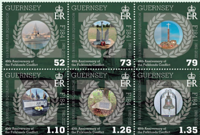
圖 60 ~ 圖 65