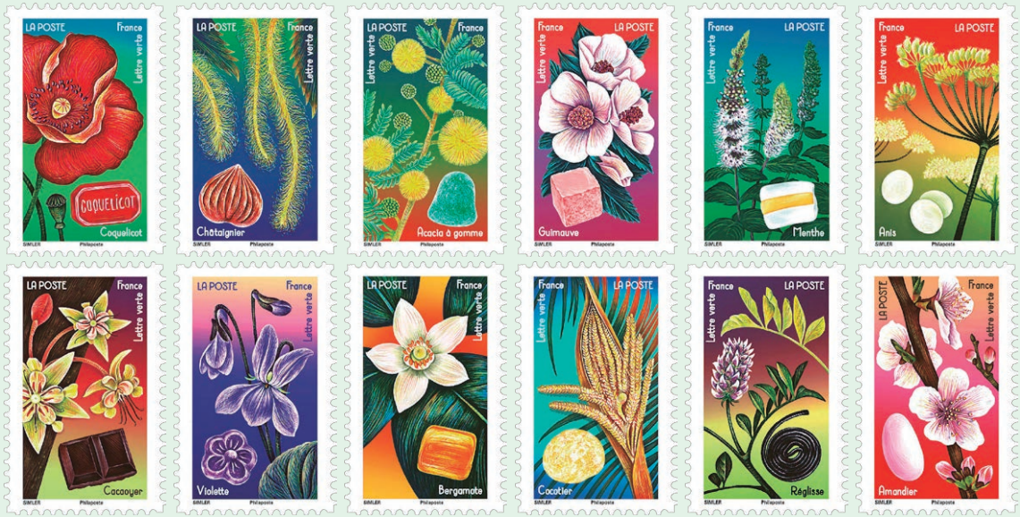
圖 4 ~ 圖 15