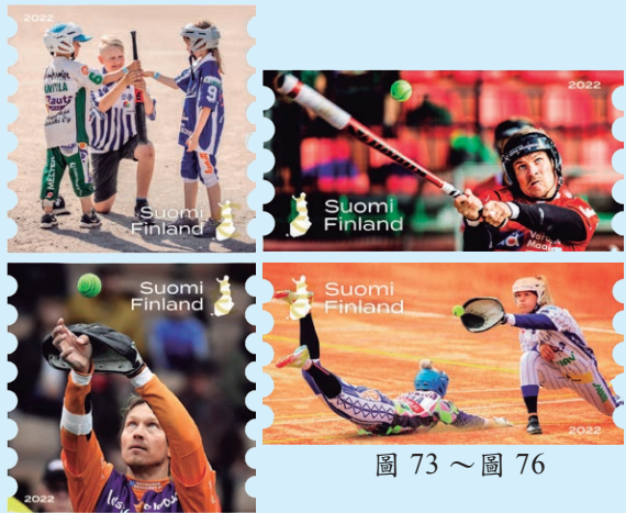
圖 73 ~ 圖 76

3. 2022 年 4 月 27 日發行 4 枚「芬蘭棒球百週年郵票」（圖 73-76），芬蘭棒球於 2022 年迎來 100 歲生日。芬蘭棒球一直與強烈的地方感聯繫在一起，各縣市都擁有球隊的熱情支持者，郵圖描繪了棒球遊戲中的 4 種典型情況：平局、擊球、投球和進壘。