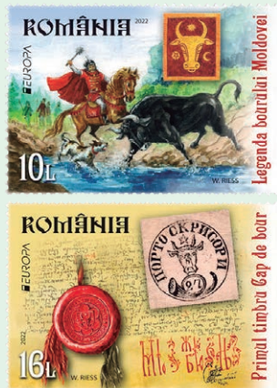
圖 85 ~ 圖 86

1. 2022 年 4 月 8 日發行 2 枚「2022 歐羅巴郵票－故事和神話」（圖 85-86），郵圖是摩爾多瓦的原牛傳說和牛頭傳說。摩爾多瓦的原牛傳說：摩爾達維亞或摩爾多瓦的名稱源於摩爾多瓦河，摩爾多瓦河谷在摩爾達維亞公國成立時曾是該國的政治中心，根據摩爾達維亞的傳說，1343 年，摩爾達維亞第一代君主德拉戈什在一次帶著獵犬 Molda 狩獵時，為了追趕一頭原牛而到了一條河邊（今天的摩爾多瓦河），疲憊的德拉戈什公爵獵殺了這頭兇猛的原牛，但他的獵犬 Molda 與原牛打鬥時，因為過勞而落入河中淹死，因此，這條河便被德拉戈什命名為摩爾多瓦河，其後又把河流的名字用到了他建立的國家（即今摩爾多瓦的前身）。而摩爾達維亞紋章與旗幟上的牛頭正是源於那頭被獵殺的野牛頭。