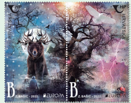
圖 194 ~ 圖 195