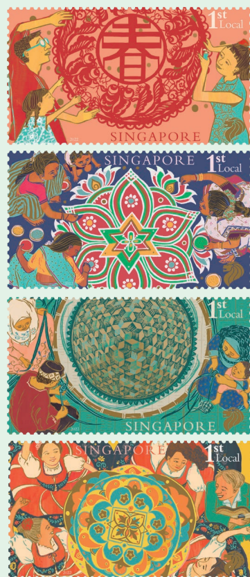
圖 104 ~ 圖 107