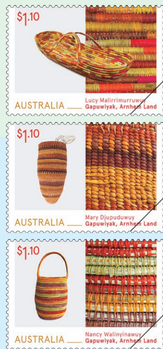
圖 108 ~ 圖 110