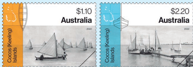
圖 111 ~ 圖 112