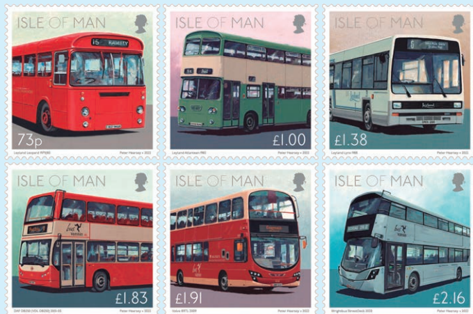
圖 157 ~ 圖 162

用曼島著名汽車運動和交通藝術家彼得·赫斯拍攝的公交巴士照片作為郵票圖案。郵票展示的 6 種曼島公交巴士包括：萊蘭豹巴士（1979 年至 1980 年投入使用）、萊蘭·亞特蘭蒂斯巴士（1982 年投入使用）、萊蘭·林克斯巴士（1988 年投入使用）、DAF DB250 巴士（2001 年至 2005 年投入使用）、沃爾沃 B9TL 巴士（2009 年投入使用）和萊特巴士（2020 年投入使用）。