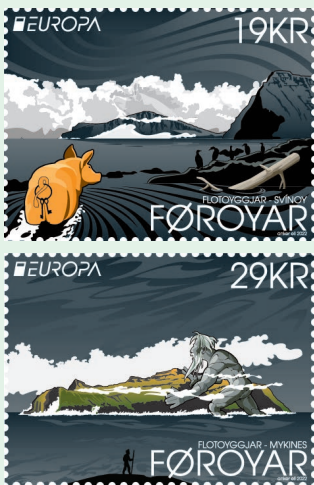
圖 176 ~ 圖 177

(1) 斯維諾伊島（豬島）：正如許多其它島嶼一樣，傳說斯維諾伊島最初曾是一座浮島。它經常出現在北部，但卻很少被看到，因為它通常被籠罩在霧中。據說，