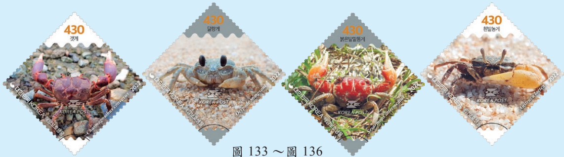
圖 133 ~ 圖 136

3. 2022 年 4 月 20 日發行 4 枚「受保護的海洋物種－系列 5 郵票」（圖 133-136）。根據海洋生態系統保護和管理法，韓國政府正在管理 83 種需要國家特別保護的指定海洋物種。自 2018 年以來，韓國郵政就陸續發行多套以受保護的海洋物種為主題的紀念郵票系列，目標為傳播有關保護海洋物種的棲息地和恢復受保護海洋物種種群的意識，此款郵票系列 5 展示並介紹了生活在海岸和河口的 4 個螃蟹品種，它們的體型有大有小，因移動十分迅速造成不易區分，郵圖呈現在自然棲息地所捕捉到螃蟹的特寫照片，讓人們得以仔細觀察這 4 個平時難以親身眼見的受保護海洋物種，了解它們的習性與特徵並培養保護的意識。郵圖為：