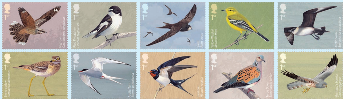
圖 33 ~ 圖 42