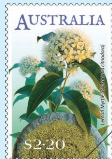
圖 113 ~ 圖 115