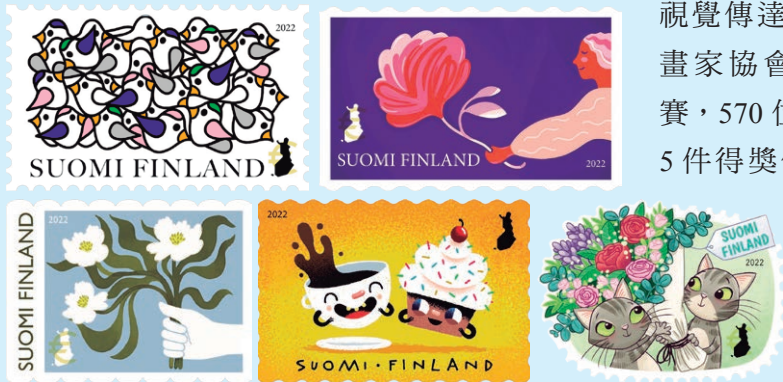
圖 66 ~ 圖 70