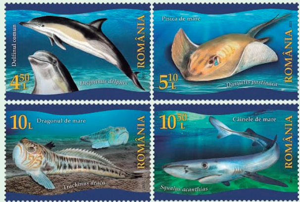
圖 93 ~ 圖 96

3. 2022 年 4 月 29 日 發行 4 枚「受保護的黑海動物群郵票」（圖 93-96）。黑海有其自身的生物學特徵，與其他海洋的壯觀多樣性相比，較小的物種範圍使這個半封閉的黑海被描述為「地中海的貧困地區」。郵圖描繪：