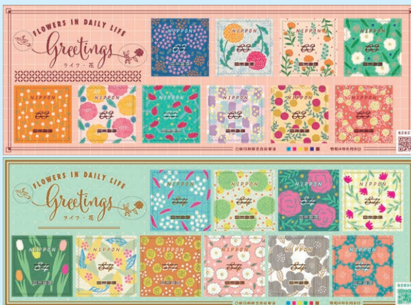
圖 25 ~ 圖 26