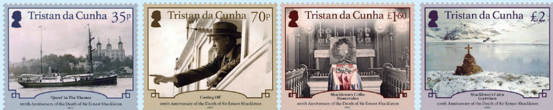
圖 142 ~ 圖 145

(1874–1922) 因其探險船「持久號」陷入浮冰中沉沒而聲名鵲起。儘管困難重重，沙克爾頓還是成功地讓他的所有船員獲救。1921年，沙克爾頓進行了第四次也是他一生中最後一次極地探險，此次探險的目標是環遊南極洲，以便繪製其海岸線圖。他乘坐的探險船「探索號」於1921年9月18日離開英國，並於1922年1月4日到達南喬治亞島，1月5日凌晨，沙克爾頓因心臟病發作去世，被安葬在南喬治亞島上的古利德維肯。郵票中最後一枚即展示了位於古利德維肯的沙克爾頓的石堆紀念碑。（查爾斯）