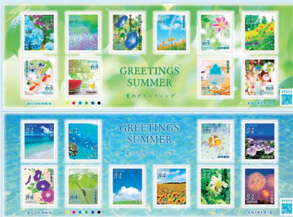
圖 23 ~ 圖 24