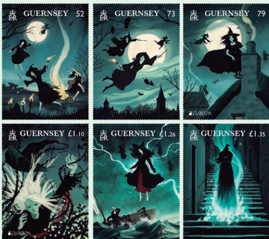
圖 54 ~ 圖 59