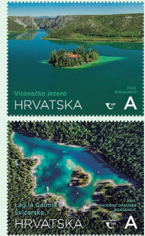
圖 192 ~ 圖 193

3. 2022 年 5 月 12 日發行 1 枚「克羅埃西亞共和國首任總統弗拉尼奧·圖季曼誕辰 100 週年郵票」（圖 196）。弗拉尼奧·圖季曼