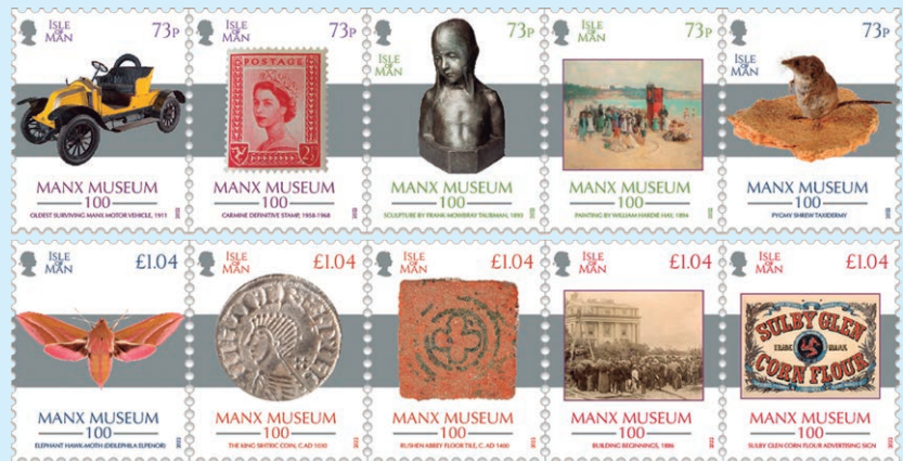
圖 147 ~ 圖 156

國家和地區的郵件上。1972年3月1日英國實行十進位貨幣改革後，曼島當地發行的所有通用郵票郵資宣告作廢。