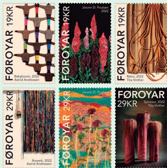
圖 178 ~ 圖 183

(2) 喬倫·鮑爾森（1949年出生）：郵票展示藝術家創作的刺繡畫（創作於2021年）和縫紉畫（創作於2011年），前者在鮮綠色的莖上繡有紅花，後者在黃色的莖上繡有淡紅色的花。