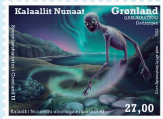
圖 186 ~ 圖 187