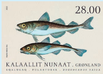
圖 188 ~ 圖 189