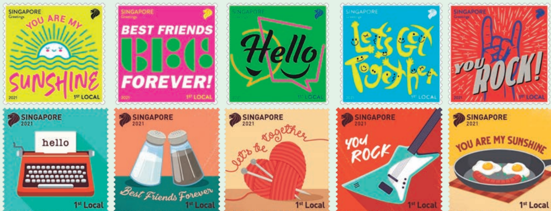
圖 115~圖 124

2021 年 9 月 3 日發行 10 枚「問候郵票」（圖 115-124）。新冠肺炎疫情持續的大流行已經擾亂許多人的生活。雖然我們得與親近的人保持距離，但知道他們在這種困難時刻都很安全並保持良好狀態總是令人欣慰的。郵圖描繪了一些常用的友誼和愛情的表達方式。值此時刻，大家可以寄一張卡片或一封信，讓這些問候郵票向您的家人和朋友傳達祝福。事實上，一個簡單的「你好」會帶來很多快樂，照亮某人的一天。（明華）