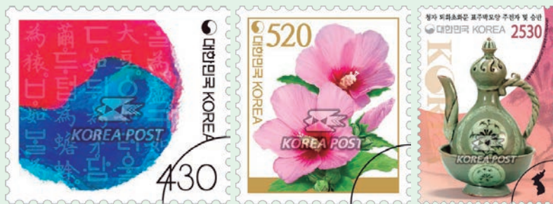
圖 171~圖 173

（1）為面值 430 韓元的普通郵件新資費郵票：展示了相當具有韓國象徵性的紅藍兩色「朝鮮太極圖」和在其上方為《訓民正音》手稿。「朝鮮太極圖」是朝鮮半島的傳統圖案，該圖案在 1880 年代被訂選為大韓帝國國旗的 1 部分，也被稱為