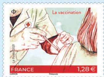
圖 24～圖 26

9. 2021 年 10 月 25 日發行 1 枚「喬治·布拉森斯誕生百週年郵票」（圖 27）。喬治·布拉森斯（1921-1981）是法國創作歌手，也是 200 多首歌曲的作者。現在是法國的標誌性人物，他透過優雅的歌曲、人聲和吉他的和聲以及清晰、多樣的歌詞而聲名鵲起。他也被認為是法國戰後最有成就的詩人之一，還為知名詩人和相對默默無聞的詩人創作了音樂詩。1967 年獲頒法國學院詩歌大獎。（凡軒）