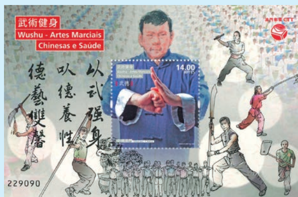
圖 91~圖 95