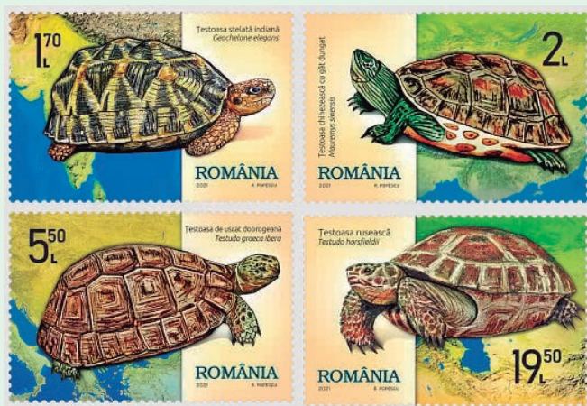
圖 106~圖 109

(2) 斑龜：又稱中華花龜，分布於中國大陸、老撾、臺灣及越南等地，生活於低海拔的水域，如池塘、運河和緩流的河流中，斑龜的頭、頸及四肢的皮膚上都長著亮綠色和黑色的條紋，成年背甲為棕色，腹甲象牙色，斑龜為雜食性動物，以魚、蝦、水中植物等為食，由於引入外來入侵物種，野生數量日益減少，現已是一種瀕臨滅絕的物種。