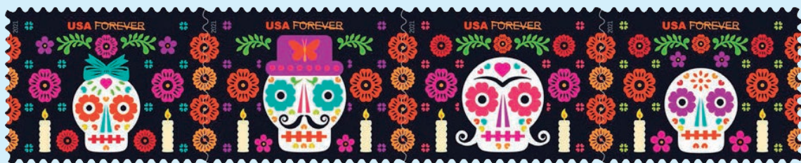
圖 150~圖 153