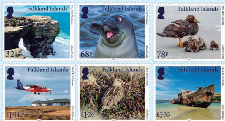
圖 189~圖 194

2021 年 10 月 22 日發行 6 枚「旅遊業復蘇激勵計畫郵票」（圖 189-194）。福克蘭群島政府為 2020 ~ 2021 年提供了各種支持計畫，旨在減輕席卷全球的新冠肺炎疫情對福克蘭島旅遊企業、經營