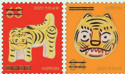
圖 28~圖 29

1. 2021 年 11 月 1 日發行 4 枚「令和 4 年賀年郵票」（圖 28-31），以「鄉土玩具」為主題。