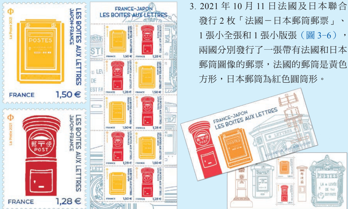
圖 3~圖 6