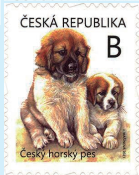
圖 81~圖 83