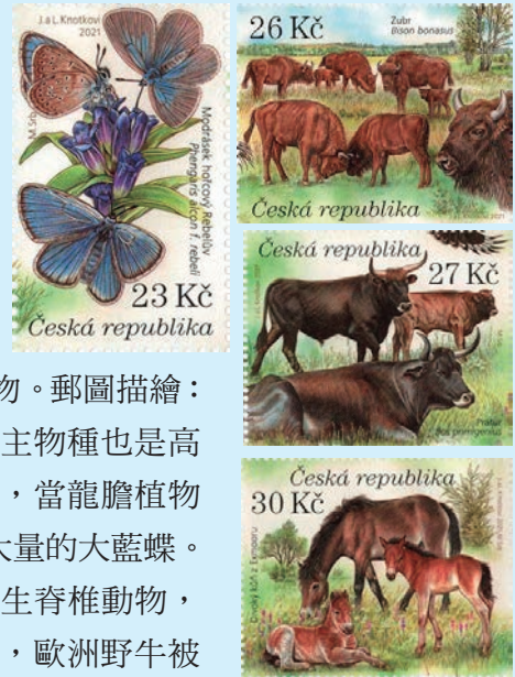
圖 72~圖 75

2. 2021 年 9 月 8 日發行 2 枚「但丁·阿利吉耶里郵票」和 1 張小全張（圖 76-78）。