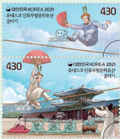
圖 178~圖 179

音樂的搭配下走繩變成空中秀，走繩師傅在注目下搭配彈跳、滑步等動作快速行走，一舉一動都牽動著觀眾的心，掌聲和驚嘆聲絡繹不絕；韓國「Jultagi」因其獨有的特殊性和創造性而廣受到全球的認同，並於 2011 年 11 月在印度尼西亞峇厘島所舉行的「政府間委員會」的第 6 次會議上，被正式列入《聯合國教科文組織非物質文化遺產》名錄，它也被列訂為第 58 號「韓國重要無形文化財產」。走繩藝人主要在繩子上展現各種才藝，搭檔在地上站著和走繩藝人一起說相聲，而三弦六角藝人坐在繩子下方的旁側隨著走繩藝人的動作演奏各種弦樂器和管