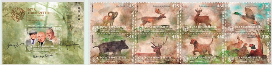
圖 139~圖 147

此次同時發行8枚紀念郵票，設計師以相互關聯的組合呈現與展覽主題相關的動物：（1）Mouflon（Ovis aries）是1種野生綿羊；（2）European fallow deer（Dama dama），黓鹿是鹿科的1種反芻動物；（3）Roe deer（Capreolus capreolus），西