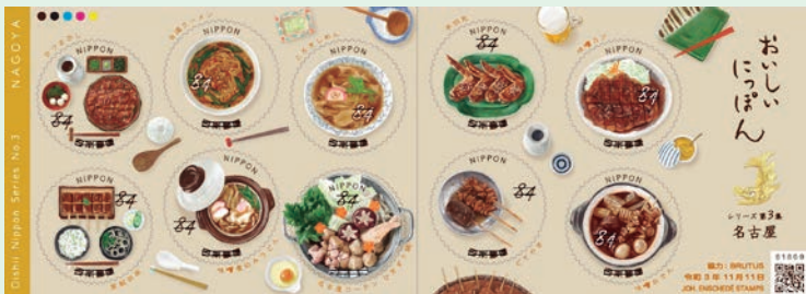
圖 33~圖 34

3. 2021 年 11 月 11 日發行 2 張「美味日本系列郵票小版張（第 3 集）」（圖 33-34），以日本美食為主題，第 3 集取材自名古屋的美食。面值分 63 日元和 84 日元兩種，63 日元郵圖為：（1）炸蝦三明治、冰咖啡；（2）鐵板拿坡里義大利麵；（3）冰與火（上面是霜淇淋，下面是千層起酥）、檸檬蘇打；（4）烤土司、