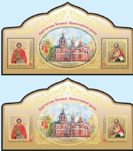
圖 110~圖 111

（圖 110-111），120 多年前封聖的神聖王子亞歷山大·涅夫斯基教堂是明斯克為數不多的建築之一，幾乎以其原始形式保存至今。它於 1898 年建於明斯克的軍事公墓，以紀念俄羅斯軍隊在 1877 至 1878 年俄土戰爭中的勝利。