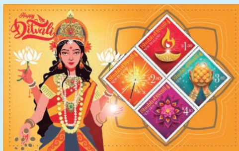
圖 38~圖 42