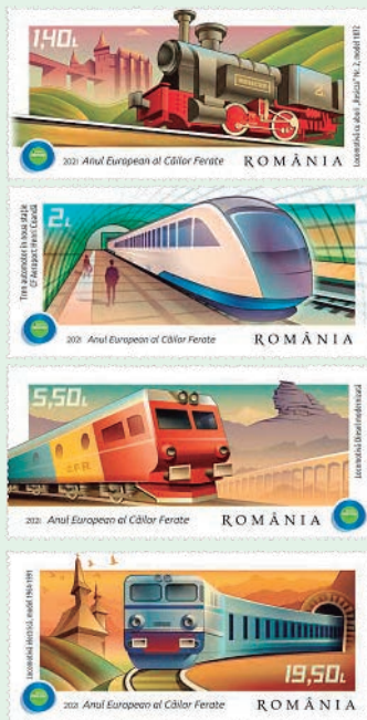
圖 100~圖 103

2. 2020 年 9 月 10 日發行 4 枚「歐洲鐵路年郵票」（圖 100-103）。2020 年 12 月 23 日，歐盟委員會將 2021 年指定為「歐洲鐵路年」，歐洲鐵路年於 2021 年 1 月 1 日正式開始。該項目旨在通過發展更環保、更可持續的運輸方式—鐵路運輸，以助歐盟減