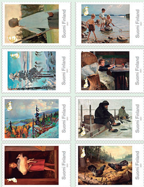
圖 62~圖 69