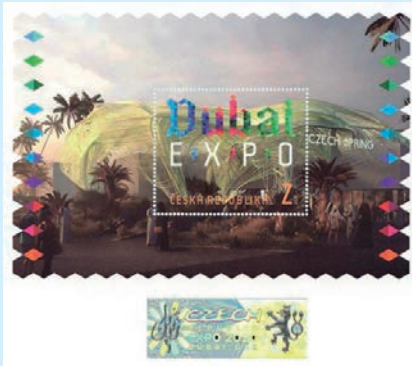
圖 79~圖 80

4. 2021年9月8日發行3枚「幼小動物—小狗郵票」(圖81-83)。捷克山犬於20世紀下半葉在捷克飼養，是捷克最年輕的犬種。捷克山犬有長而厚的白色被毛，並有不規則的棕色或黑色斑點，這些狗具有善良友好的性格，並且非常聰明。牠們需要耐心和持續的培訓，並有足夠的動力，特別適合需要大量運動的高度活躍的家庭。捷克山犬經常被用作救援犬、拖曳犬和牧羊犬。(威聯)