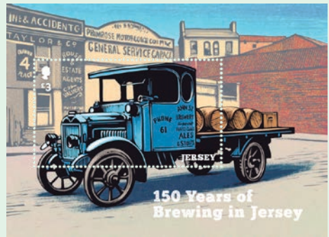
圖 43～圖 49