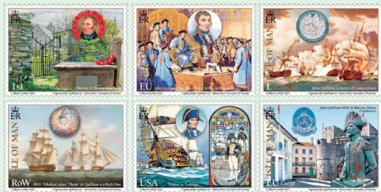
圖 195~圖 200

1. 2021 年 9 月 25 日發行 6 枚「紀念約翰·奎利姆船長誕辰 250 週年郵票」（圖 195-