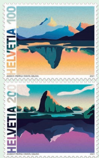
圖 159~圖 160