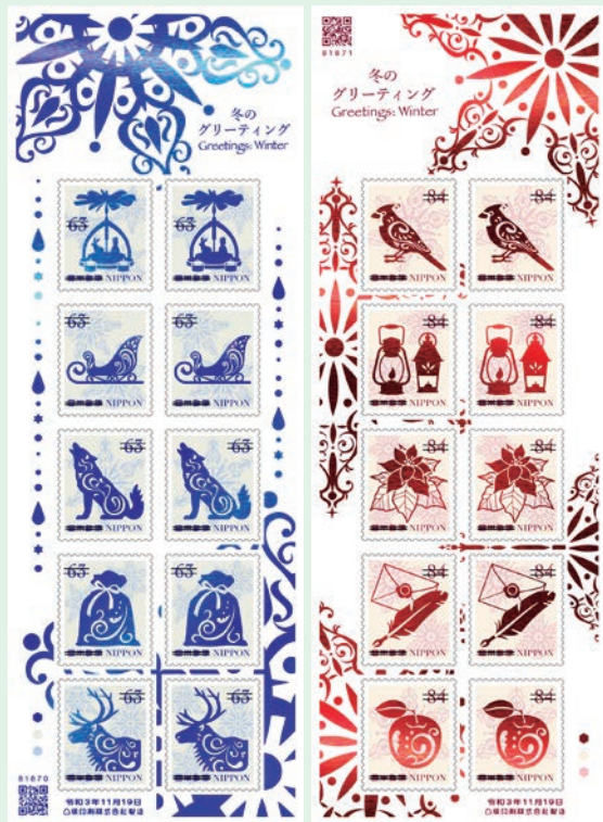
圖 35~圖 36

若山憲 1930 年生於岐阜市。他從事過插畫設計，後致力於兒童畫創作，作品《亮晶晶妖怪和嗖嗖妖怪》獲得日本繪本大獎，《狐狸出嫁》獲得日本產經兒童出版文化獎、NHK 值得推薦圖書獎，書中的原畫曾在布拉迪斯國際插畫雙年展上脫穎而出，受到廣泛關注。1970 年，他開始創作《小白熊作松餅》系列，該系列的故事貼近兒童生活，自出版以來，暢銷 40 餘年，僅在日本累計銷售就近千萬冊，成為家喻戶曉的經典兒童讀物。在日本繪本界，若山憲以創作風格獨特著稱。（凡軒）