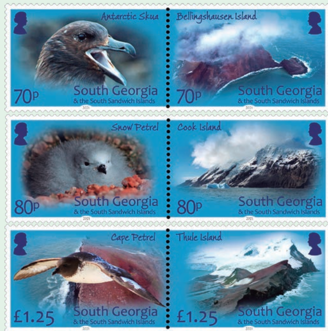
圖 183~圖 188

2021年10月28日發行6枚「南圖勒群島郵票」(圖183-188)。南桑威奇群島由11個火山島和岩石組成，位於南喬治亞州東南部約500公里處。這條島鏈從北向南延伸了400多公里。從北到南依次是紮沃多夫斯基島、萊斯科夫島、維索科伊島、坎德馬斯島、辯護島、桑德斯島、蒙塔古島、布里斯托爾島、貝林肖森島、庫克島和圖勒島共11座島嶼，這些島嶼從面積從最大的蒙塔古島(110平方公里)到最小的萊斯科夫島(0.3平方公里)不等。南桑威奇群島於1775年被詹姆斯·庫克船長首次發現，當時濃霧和暴風雪給探險帶來了困難，但庫克船長在黑暗中發現了8塊岩石，他認為它們可能是遙遠大陸上的島嶼或海岬，但這一情況使得航行極其危險，所以庫克沒有細探索或登陸這些島嶼。1819年俄羅斯探險家費邊·馮·貝林肖森再次造訪該地區，