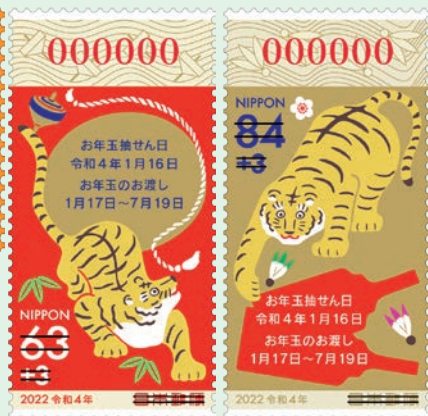
圖 30~圖 31

郵票分為 2 枚傳統型（63 日元和 84 日元）和 2 枚有獎附捐型（63+3 日元和 84+3 日元）。2 枚傳統型郵票中，面值 63 日元的郵圖《金沢土虎》