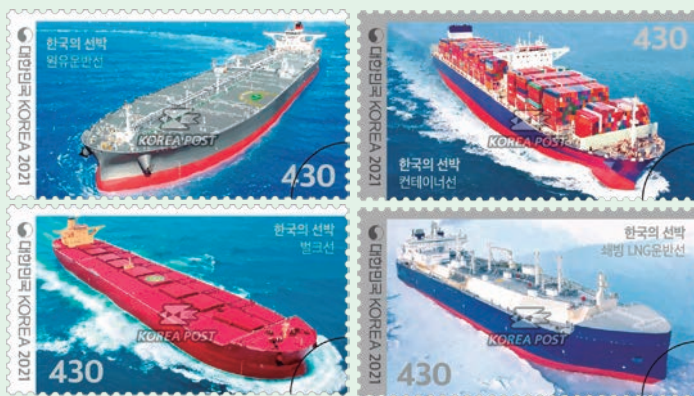
圖 174～圖 177

(1) 油輪：將原油從石油出口碼頭運輸到進口碼頭的煉油廠的船舶，主要用來運輸原油及其提煉成品等石油化工液體產品，具備有 1 個平坦空曠的甲板是油輪的明顯特徵，除駕駛艙