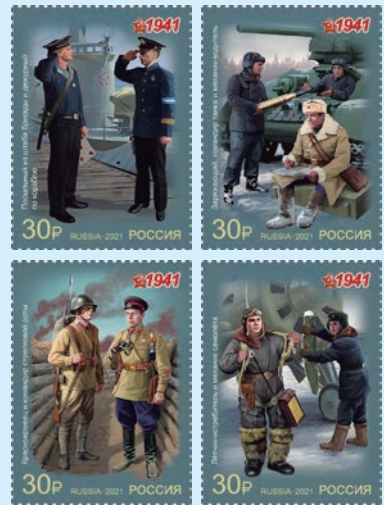
圖 131~圖 134

4. 2020 年 9 月 21 日發行 4 枚「紀念 1941-1945 年衛國戰爭勝利 80 週年系列郵票」（圖 131-134）。主題是 1941 年蘇聯紅軍和蘇聯海軍制服，蘇聯紅軍的制服和徽章每隔幾年就會改變一次，以適應當前的需求和時代要求。儘管大部分變化很小，但紅軍制服的歷史卻出現了轉折。1941 年，在戰爭的頭幾個月，通過了一項命令，根據該命令，所有類型的戰場部隊都必須穿制服並佩戴防護色徽章。1941 年 8 月 3 日，政府下達了一項命令，女性制服包括一頂帶有金屬星的貝雷帽、一件灰布製成的外套、一件布或羊毛製成的防護服。同年廢除袖章，將軍開始穿無條紋長褲。郵圖為軍人的制服：（1）旅總部的信差和船上的值班軍官；（2）裝貨人、坦克指揮官和司機；（3）紅軍士兵和步槍連長；（4）戰鬥機飛行員和飛機機械師。（明華）