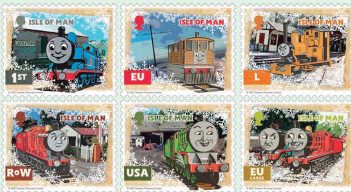
圖 207~圖 212

14.5萬餘名會員。郵票的圖案是由門薩提供的單詞和數位拼圖，這些謎題是邏輯和非語言推理的混合體，還包含許多隱藏在微文本和密碼中的代碼、位置、資訊和文字，這些特殊代碼將資訊中的文字隱藏起來，使資訊成為秘密。破譯密碼的人需要找出破譯密碼的鑰匙，答案都可以在郵票上看到，但是你可能需要一個放大鏡和破譯代碼的技巧來解決它們。