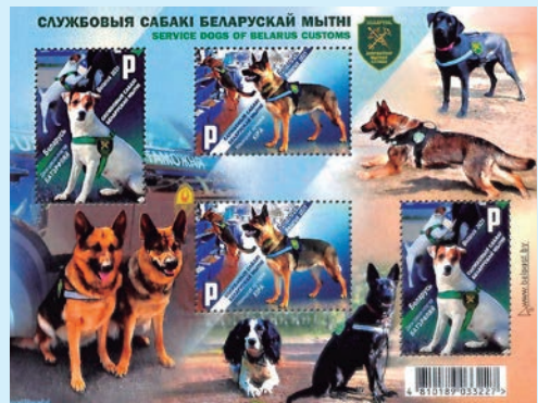
圖 112~圖 114