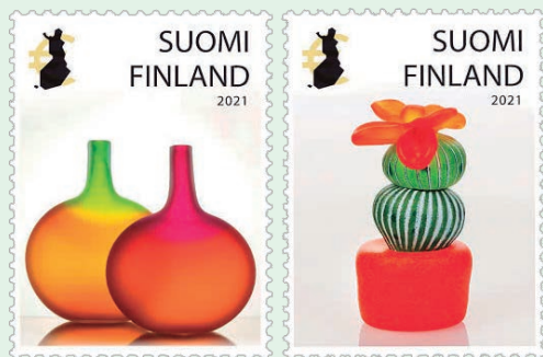
圖 70~圖 71