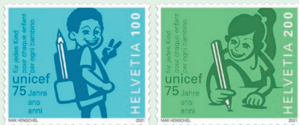
圖 162~圖 163

「聯合國兒童基金會」全稱為「聯合國國際兒童緊急救援基金會」，英語為 The United Nations International Children's Emergency Fund，簡稱為 UNICEF，它是聯合國 1 個專門機構，於 1946 年 12 月 11 日在聯合國大會上成立，總部設於美國紐約。UNICEF 基金會成立宗旨為對開發中國家的母親和孩子們進行長期的人道主義和發展援助，在第二次世界大戰後成為廢墟的歐洲存在有無數生病、飢餓和流離失所的兒童，UNICEF 針對他們提供協助、照護及支持。作為聯合國主管兒童問題的機構，UNICEF 在 156 個發展中和轉型中國家開展工作來保障兒童的生存和發展，UNICEF 也是目前世界上為貧窮國家提供疫苗的最大機構，為確保兒童的健康和達到營養標準，它致力於為所有兒童提供高品質的基礎教育、安全乾淨的水源和衛生設施，同時努力保護兒童免遭暴力、剝削和愛滋病的影響。郵票特別側重於「聯合國兒童基金會」的「教育領域優先事項」，自 1961 年以來，UNICEF 特別致力於推動與實現每位兒童均擁有接受教育的目標，並在這項計畫獲得了顯著的成就：在 1950 年代只有百分之 50 的兒童能夠上小學，而這項數據現在已超過百分之 90。然而目前世界