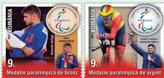
圖 104~圖 105

3. 2020 年 9 月 16 日發行 2 枚「2020 年殘奧會獎牌郵票」（圖