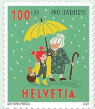
圖 157~圖 158