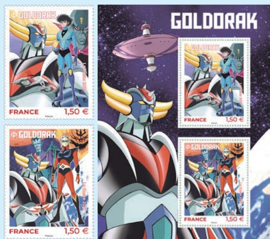
圖 19~圖 21