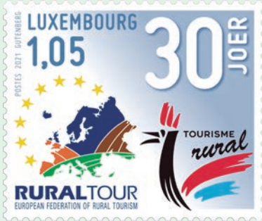
圖 88~圖 89