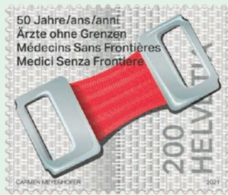
圖 155～圖 156

應因比亞法拉共和國內戰所造成的飢荒問題，而成立了慈善組織「無國界醫生」，瑞士郵政特別發行 2 枚意義非凡的郵票以資紀念無國界醫生組織成立 50 週年，郵圖上描繪了所有瑞士人都熟悉的兩種常用醫療產品：OK 繃和繃帶夾，郵票在製作上均選用特殊的塗層以強化它們兩者所呈現的視覺感受和影響力。