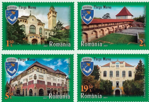
圖 96~圖 99

特爾古穆列什是特蘭西瓦尼亞地區穆列什縣的一座城市，位於穆列什河畔。郵圖描繪從15世紀末到20世紀初4個世紀建造的標誌性紀念建築：