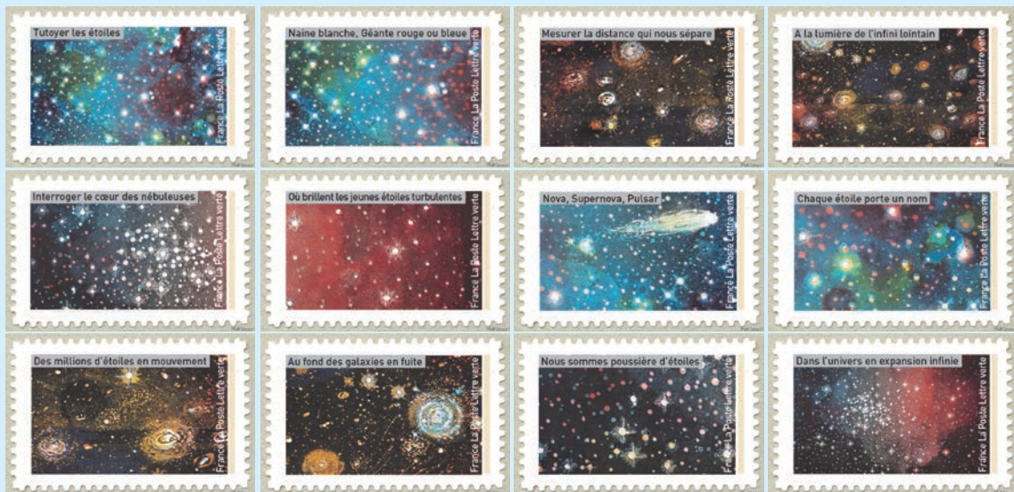
圖 7~圖 18