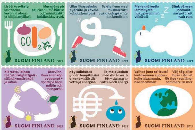
圖 56~圖 61