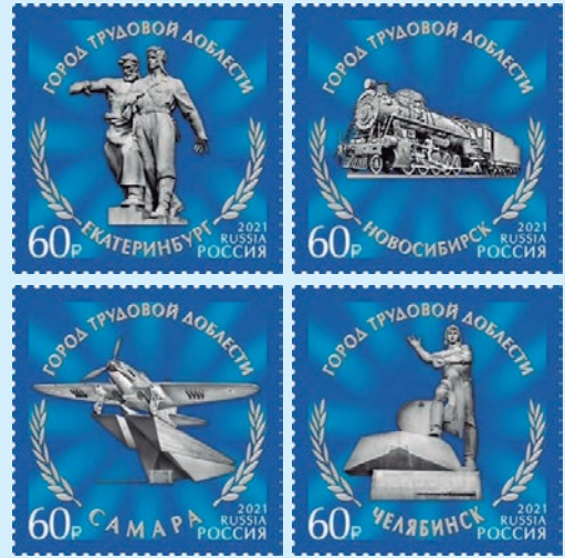
圖 126~圖 129

2. 2020 年 9 月 9 日發行 4 枚「勞動英勇城市系列郵票」（圖 126-129），根據總統弗拉基米爾·普京簽署的法令，俄羅斯聯邦 12 個城市被授予「勞動英勇城市」的稱號。這些城市獲此稱號是因為其居民為 1941 年至 1945 年偉大衛國戰爭的勝利作出巨大的貢獻，確保了軍民產品的不間斷生產，表現出集體勞動英雄主義和自我犧牲的精神。郵圖為：