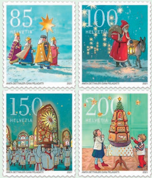
圖 164~圖 167

7. 2021 年 9 月 30 日發行 4 枚「聖誕節的傳統郵票」（圖 164-167）。今年的聖誕郵票以愉悅的懷舊風格圖案呈現了瑞士豐富多樣的聖誕傳統文化遺產，設計師以鮮豔的色彩和精美的細節描繪經典習俗與其多樣風貌，這些存在於日常生活的節慶傳統與內涵元素是構成瑞士「非物質文化遺產」的重要部分，因此 4 枚聖誕郵票特別以展示聖誕節期間會實行的各種節慶傳統為主題意象。4 幅郵圖設計分別介紹了從特定地區到廣為人知的瑞士經典聖誕故事和傳統：