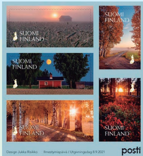
圖 51～圖 55