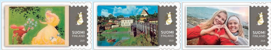
圖 57~ 圖 59

(5) 展現波爾沃鎮美景的風景明信片；(6) 根據用郵者的照片設計的明信片，可以在旅途中透過電腦或手機發送明信片給親友。