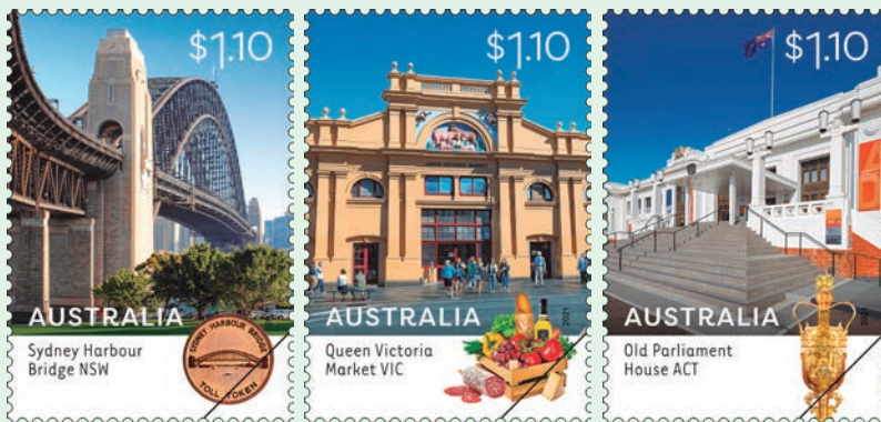
圖 97~ 圖 99