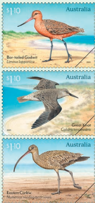
圖 100~ 圖 102

2. 2021 年 5 月 18 日發行 3 枚「遷徙的水鳥郵票」（圖 100-102），澳大利亞有 37 種候鳥，其中有 7 個瀕臨滅絕的危險。其中許多威脅與人類對潮間帶的影響有關，包括發展