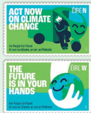
圖 115~ 圖 116

Sustainable Development Goals，簡稱 SDGs，SDGs 包含了 17 項核心目標，指引著全球共同努力達成使地球邁向永續發展的願景。愛爾蘭針對聯合國的 SDGs 倡議發起「為人類也為地球共同努力」活動，做為願意共同承擔以及付出實踐的承諾，身為國營企業的郵政共襄盛舉發行紀念郵票，並一道展示已成為此領域的領導者與正在身體力行地實施其中 5 項 SDGs 的現況：愛爾蘭郵政發布了 2 份針對 SDGs 的計畫書，著重強調郵政在全國減少碳排放中所能發揮的有效幫助與作用，也對提供國民更好更健康的生活環境與品質做出承諾，郵政已在 2020 年付出 10 項改變：