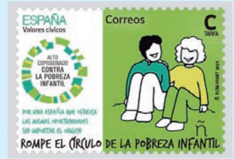
圖 157~ 圖 158

除兒童貧困,郵票中展示並排而坐的兩個小男孩,他們臉上唯一的共同特徵是微笑,這種微笑是消除兒童貧困的目標。任何孩子都不應該沒有微笑,最重要的是,任何孩子都不應該沒有住所、食物和教育。據統計,西班牙有 28.3% 的兒童受到貧困和排斥風險的影響,即 220 萬兒童。如果不遏制這一趨勢,將對後代產生非常消極的影響。據估算,到 2030 年,貧困兒童的比例將降至 26.5%,但這一數字仍然無法被接受。未來十年,超過四分之一的西班牙兒童將繼續在貧困環境中成長。這些孩子中的大多數從他們的父母那裡繼承了貧困的現狀,要打破這種兒童貧困的迴圈,就