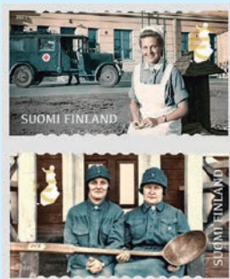
圖 63~ 圖 64