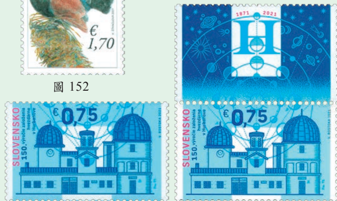
圖 153~ 圖 154

2. 2021 年 5 月 21 日發行 1 枚「胡爾巴諾沃天文臺建立 150 週年郵票」及 1 枚帶附票的郵票（圖 153-154）。胡爾巴諾沃天文臺被認為是捷克斯洛伐克天文學的搖籃。它最初是米克羅斯博士