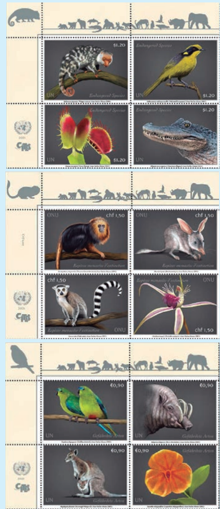
圖 117~ 圖 119

1. 2021 年 4 月 7 日發行 3 張「2021 年瀕危物種紀念小全張」（圖 117-119）。《瀕臨絕種野生動植物國際貿易公約》是各國政府之間的 1 項國際協議，於 1963 年由「國際自然與天然資源保育聯盟」（現名「國際自然保護聯盟」）的各會員國所起草簽署並於 1975 年時正式執行，目的主要是透過對野生動植物出口與進口限制，確保野生動物與植物的國際交易行為不會危害到物種本身的延續，由於這份公約是在美國的華盛頓市所簽署因此又常被稱呼為《華盛頓公約》。3 款小全張各自包含有 4 枚郵票，郵圖特別將關注放在地球上特定環境與地區的動物群與植物群，面值 1.20 美元的郵票上呈現了：（1） Spilococcus papuensis ；（2） Lichenostomus melanops cassidix 鳥，英文暱稱 Helmeted honeyeater 意思為「戴頭盔的蜜鳥」；（3） Dionaea muscipula 捕蠅草，捕蠅草在中文及日文則有「蒼蠅的地獄」這個別名；（4） Alligator mississippiensis ，俗名 American alligator 與美國短吻鱷，又稱密西西比河鱷。面值 1,50 瑞士法郎的郵票上呈現了：（5） Leontopithecus chrysomelas ，英文名稱 Golden-headed lion tamarin 意思為「金頭獅面狨猴」；（6） Macrotis lagotis ，英文名稱 Greater bilby ，兔耳袋狸是哺乳綱袋狸屬中最大型的袋狸；（7） Lemur catta ，英文名稱 Ring-tailed lemur 意思為「環尾狐猴」，環尾狐猴，它的又名節尾狐猴；（8） Caladenia huegelii ，英文名稱 Grand spider orchid 意思為「大蜘蛛蘭」。面值 0.90 歐元的郵票上呈現了：（9） Neophema chrysogaster ，英文名稱 Orange-bellied parrot 意思為「橙腹鸚鵡」，它的又名「黃腹長尾鸚鵡」是澳洲特有的 1 種鸚鵡；（10） Babyrousa babyrussa ，英文名稱 Babirusa ，馬魯古鹿豚又名鹿豚或鹿豬；（11） Onychogalea fraenata ，英文名稱 Bridled nail-tailed wallaby 意思為「尖尾兔袋鼠」，又名轡甲尾袋鼠或斑紋距尾袋鼠；（12） Lepanthes telipogoniflora ，英文名稱 Telipogon-like lepanthes ，麗斑蘭是 1 種微型的迷你蘭花。