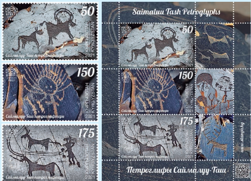
圖 148~ 圖 151

擁有的岩畫多達 9 萬多張，涉及不同的歷史時期。這裡最古老的石頭岩畫可以追溯到西元前 3000 年至西元前 1000 年，距離現今最近的岩畫也可以追溯到西元 8 世紀。岩畫的主題非常廣泛，反映了古人的宗教信仰和世界觀，包括神靈、野生動物以及家畜、鳥類和人的形象等。目前，塞馬魯塔什已成為吉爾吉斯斯坦的象徵之一。（查爾斯）