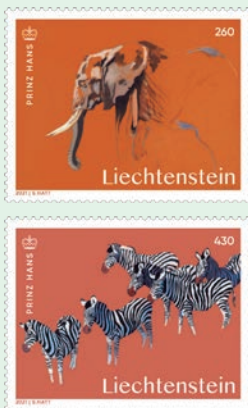
圖 65~ 圖 66