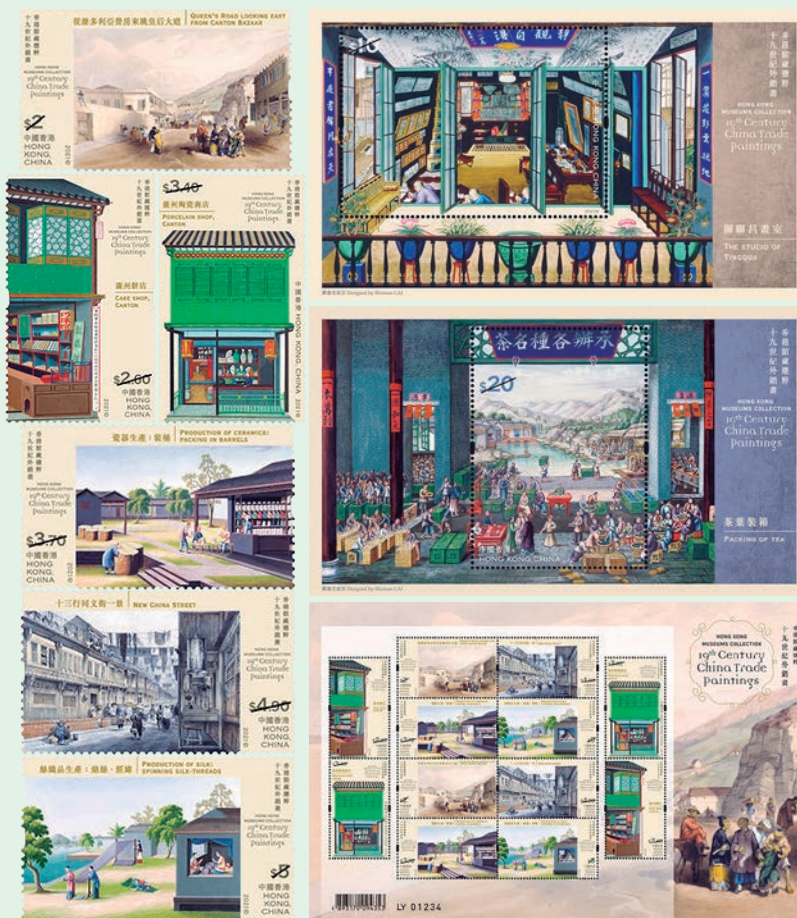
圖 80~ 圖 88