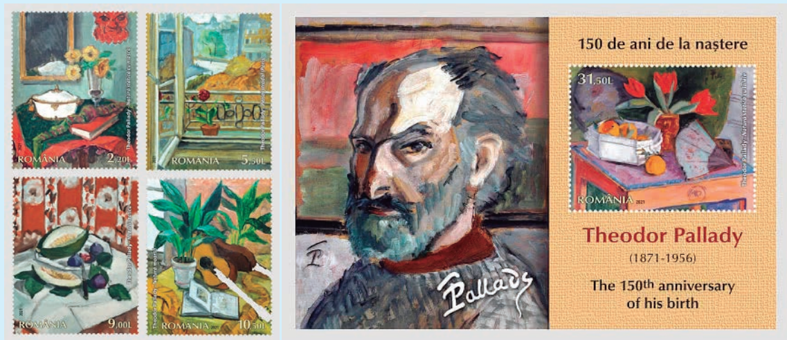
圖 73~ 圖 77