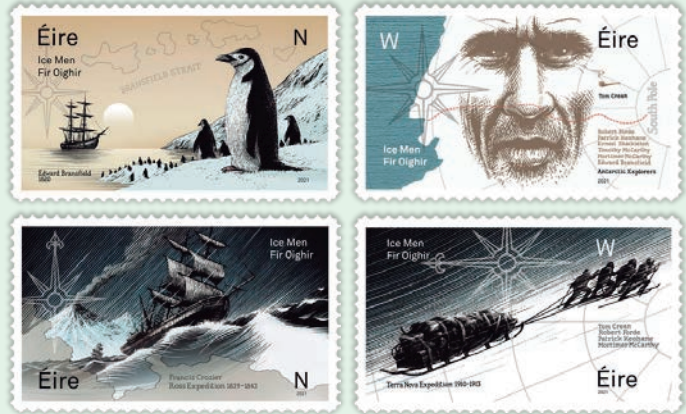
圖 111~ 圖 114

「傑出的愛爾蘭南極探險家紀念郵票」（圖 111-114）。在 1800 年代和 1900 年代初期是南極探索英雄任務的「黃金時代」，而愛爾蘭人正是此南極探險的核心，此次藉由發行 4 枚郵票向 8 位勇敢的愛爾蘭探險家致敬，設計師選用冷冽的