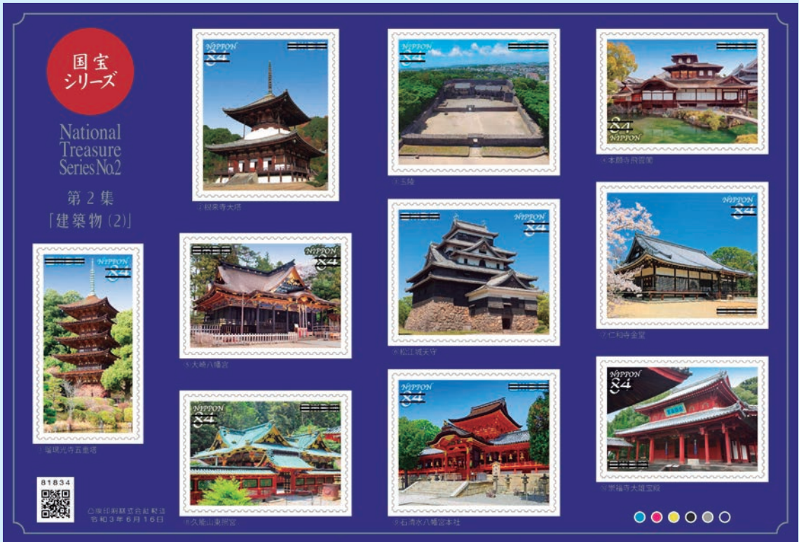
圖 3~ 圖 4

樂圖(狩野長信繪・左隻部分)；(2) 花下遊樂圖(狩野長信繪・右隻部分)；(3) 風神雷神圖(俵屋宗達繪・左隻部分)；(4) 風神雷神圖(俵屋宗達繪・右隻部分)；(5) 觀楓圖(狩野秀賴繪・部分)；(6) 俱利迦羅龍蒔繪經箱；(7) 金銅能作性塔；(8) 色繪藤花文茶壺(野々村仁清作)；(9) 曜變天目(稻葉天目)茶碗；(10) 牛皮華鬘。