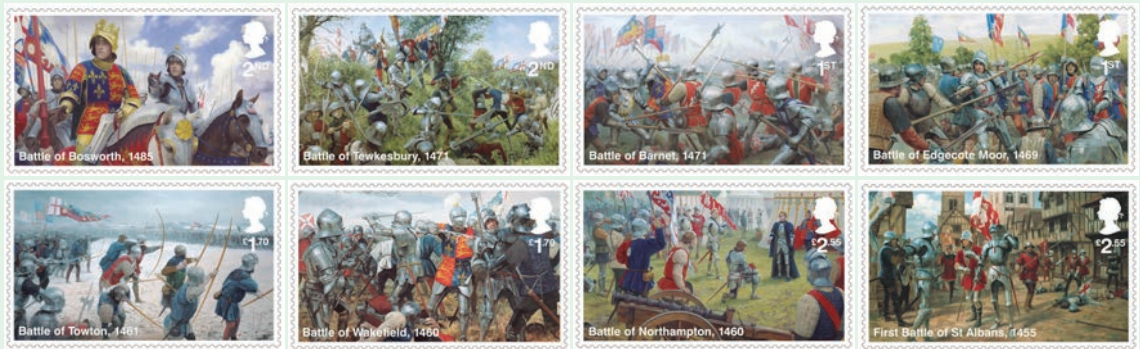
圖 9~ 圖 16