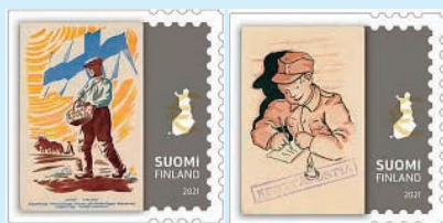
圖 54~ 圖 56

2. 2021 年 4 月 28 日發行 6 枚「明信片 150 週年郵票」（圖 54-59），明信片傳達芬蘭人的信息和感情已有 150 年了。郵圖介紹了 6 張不同時期的明信片：（1）1871 年芬蘭最早的官方明信片之一；（2）印有芬蘭國旗和農夫的明信片；（3）戰爭年代的軍事明信片；（4）芬蘭的插畫家和畫家魯道夫·科伍所繪的童話故事主題明信片；