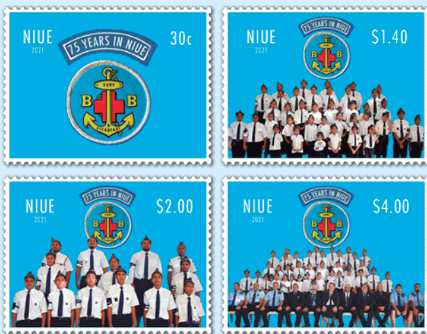
圖 17~ 圖 20

2021 年 5 月 4 日發行 8 枚「玫瑰戰爭郵票」（圖 9-16），為紀念英格蘭玫瑰戰爭期間發生在格洛斯特郡的蒂克斯伯里戰役 550 週年，玫瑰戰爭於 1455 年至 1485 年之間發生，又稱薔薇戰爭，是蘭開斯特王族（愛德華三世第三子的後裔）和約克王族（愛德華三世第四子的後裔）之間的武裝衝突。長達三十餘年的戰爭中，大批王室成員在持久的爭戰中死去，造成王族開始衰落。戰爭最終以蘭開斯特家族的亨利七世與約克的伊莉莎白聯姻結束，同時也結束了法國金雀花王朝在英格蘭的統治，開啟威爾斯人的都鐸王朝。「玫瑰戰爭」之名源於兩個家族所選的家徽，蘭開斯特的紅玫瑰和約克的白玫瑰。8 枚郵圖取材自歷史畫家格雷厄姆·特納的畫作。每枚郵票都重新構思了《玫瑰大戰》30 年的戰鬥或小規模衝突的畫面：（1）博斯沃思原野戰役（1485）；（2）蒂克斯伯里戰役（1471）；（3）巴尼特戰役（1471）；（4）埃奇科特戰役（1469）；（5）陶頓之戰（1461）；（6）韋克菲爾德戰役（1460）；（7）北安普敦戰役（1460）；（8）第一次聖奧爾本斯戰役（1455）。（凡軒）