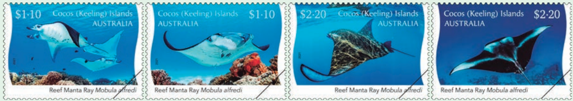
圖 103~ 圖 106

牠們分布在印度太平洋的熱帶和亞熱帶地區。郵圖描繪：（1）珊瑚礁鬼蝠魞；（2）珊瑚礁鬼蝠魞一腹面；（3）珊瑚礁鬼蝠魞一黑色的背面；（4）珊瑚礁鬼蝠魞一黑白色的背面。（明華）