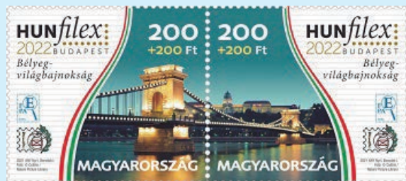
圖 108~ 圖 109

斯紀念郵票」（圖 108-109）。匈牙利全國集郵家聯合會在國際集郵聯合會（FIP）與歐洲集郵協會聯合會（FEPA）的共同支持下，將於 2022 年春季在匈牙利首都布達佩斯舉辦 1 場以美麗繽紛而聞名的世界郵票錦標賽《HUNFILEX》，布達佩斯也是暨