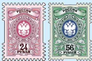
圖 89~ 圖 90