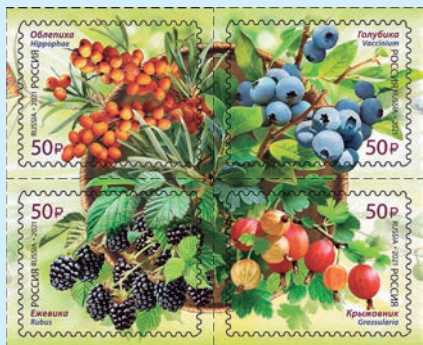
圖 91~ 圖 94