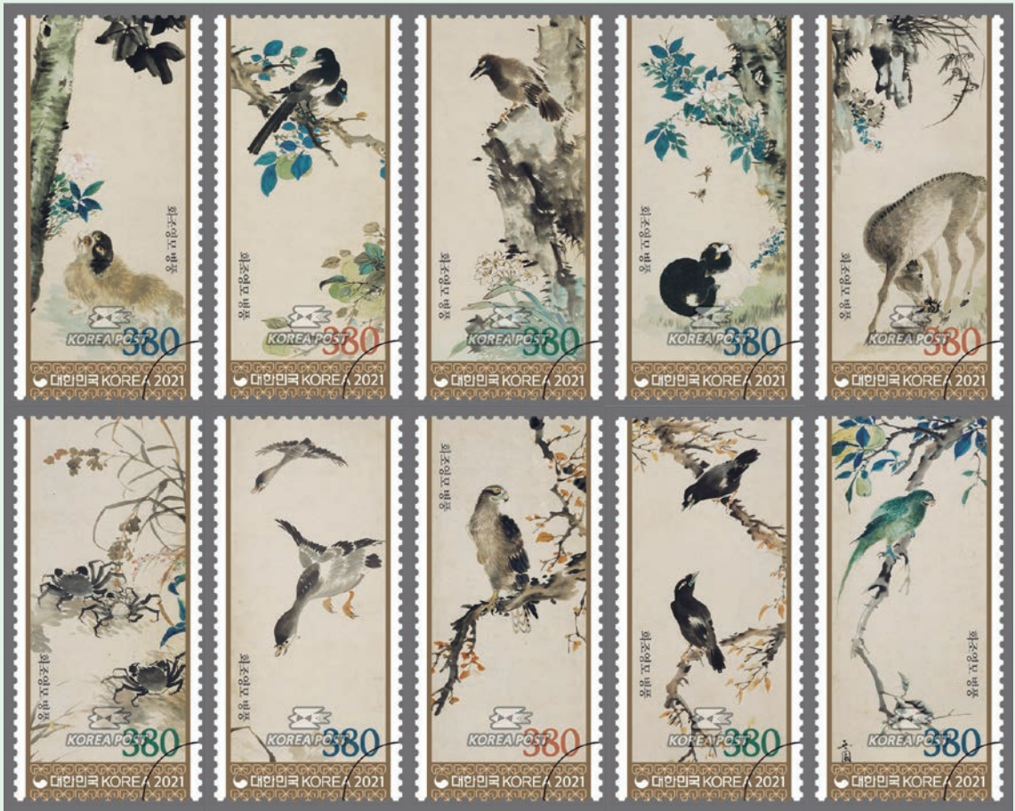
圖 121~ 圖 130

張承業曾遍覽歷代字畫真跡，專精於花卉、鳥類、山水、人物的描繪，他落筆生動且傳神，作品筆墨靈動栩栩如生，郵票展示了朝鮮晚期以大膽的筆觸而聞名的偉大畫家—張承業的屏風藝術品，郵圖所展示的 10 面屏風精美地描繪了鳥、花卉和動物。第 1 面屏風描繪了月色中在韓國泡桐樹下吠叫的 1 隻蓬鬆的驅鬼犬（韓國犬種 Sapsalgae），在韓國 Sapsalgae 犬據說可以嚇走鬼魂並防止厄運；第 2 面屏風描繪了 1 對喜鵲棲息在柿子樹上；第 3 面屏風描繪了 1 隻鳥停留在有水仙花的岩石上；第 4 面屏風描繪了在玫瑰花叢下 1 隻緊盯著蜜蜂的貓；第 5 面屏風描繪了 1 隻放牧覓食的鹿；第 6 面屏風描繪了攀抓著蘆葦花的絨螯蟹；第 7 面屏風描繪了鵝朝蘆葦田向下滑行；第 8 面屏風描繪了在樹枝上停留的老鷹；第 9 面屏風描繪了棲息在樹枝上的小鳥；及第 10 面屏風描繪了 1 隻在佛手柑樹上的鸚鵡。這些屏風完美的體現了張承業敏銳的觀察力和細緻靈動的描繪，在他筆下的屏風上，鳥、花和動物的搭配相當巧妙，各自出色綻放卻又和諧的相互襯托，張承業對狗、鳥、貓和鹿等動物的描繪也極為生動，他使用稀釋的墨水使筆觸更加鮮明，併用如水彩畫一般的著色技法