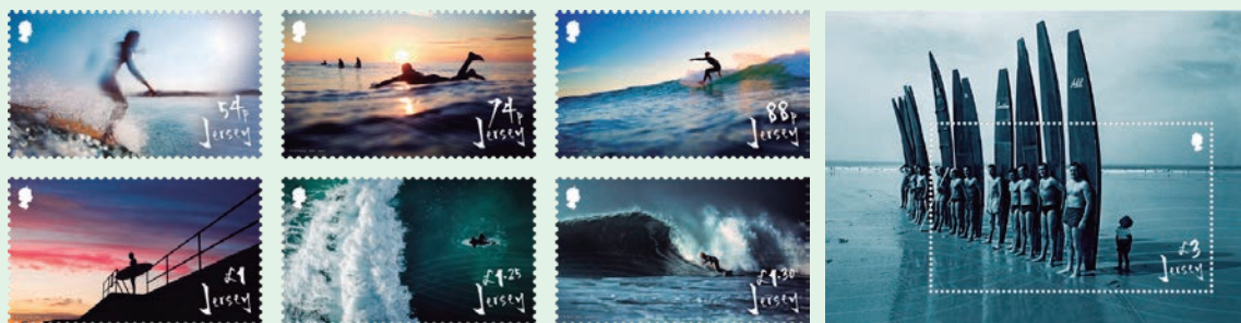
圖 46~ 圖 52

2021 年 5 月 18 日發行 6 枚「澤西島衝浪郵票」和 1 張小型張（圖 46-52），澤西島擁有不列顛諸島最好的浪潮。6 枚郵圖是澤西島攝影師 Matt Porteous、Andy Le Gresley、BAM Perspectives 和 Richard Picot 拍攝的照片，展示衝浪者在聖旺灣欣賞海浪的樂趣。小型張上有一張由已故的約翰·胡爾貝克於 1959 年拍攝的照片，用以紀錄澤西衝浪板俱樂部的成立。（威聯）