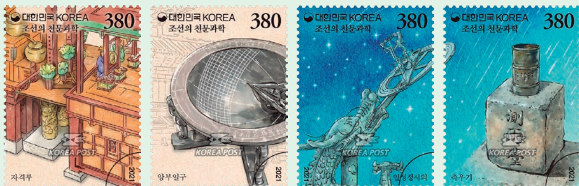
圖 131~ 圖 134