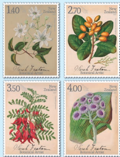
圖 21~ 圖 24