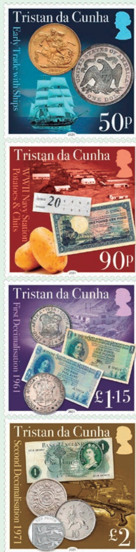
圖 136~ 圖 139

2021年5月26日發行4枚「特裡斯坦實行十進位60和50週年紀念郵票」（圖136-139）。西元1810年代最初抵達特裡斯坦－達庫尼亞群島的西方殖民者，他們為通過船隻提供淡水和糧食來賺錢。此類交易包括易貨和使用船上攜帶的貨幣，當時主要是英鎊和美元。到19世紀末，島上幾乎沒有錢了，因為此前當地的貿易主要以物易貨為主，比如馬鈴薯就曾經是重要的易貨品和貨幣價值衡量單位。當地人認為金錢毫無用處，每個家庭都會種地、養殖和狩獵來實現食物的自給自足。1942年，當英國皇家海軍在島上建立基地時，需要當地居民的協助來建造和管理，於是採用了以先令（英國貨幣）支付報酬的制度。皇家海軍離開後，當地居民又回歸了易貨貿易。此後，隨著小龍蝦產業的盛行，南非漁業工廠的工人開始登島，他們為特裡斯坦帶來了數量可觀的南非貨幣。1961年，南非決定將其貨幣十進位化，為了便於管理，特裡斯坦與南非貨幣掛鉤統一，當地的郵票上甚至加印了南非貨幣和美元的面值，完全取代了英國貨幣。但此情況維持僅幾個月後，由於1961年10月的火山爆發導致所有人都被疏散到英國，這使得英鎊再次回歸特裡斯坦，並隨後於1971年配合實施英國貨幣十進位。目前，儘管特裡斯坦－達庫尼亞群島是英國海外領土聖赫勒拿島的一部分，但這裡不使用聖赫勒拿紙幣和硬幣，而是繼續使用英國貨幣。本次發行的郵票分別展示了19世紀到特裡斯坦進行貿易的商船和美元硬幣、當時曾用作交易的馬鈴薯和南非紙幣、被火山捲走的漁業工廠和十進位化前後的南非紙幣和硬幣、卡爾肖特港和20世紀60年代至70年代的英鎊紙幣及英國貨幣十進位後的硬幣。（查爾斯）