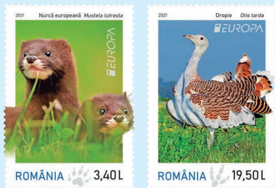
圖 78~ 圖 79