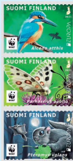
圖 60~ 圖 62