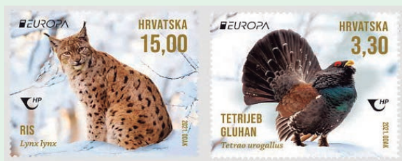
圖 142~ 圖 143

85 釐米，雄性松雞有華麗的羽毛，包括綠色的胸部、棕色的背部，黑色的頭部、頸部和腹部，雌性松雞有不顯眼的紅色和灰色羽毛與黑色條紋。它們的腿一直到腳趾都長著羽毛（冬季會變得更長）。