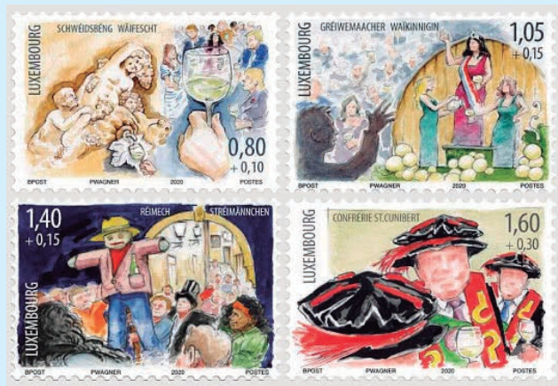
圖 79~ 圖 82

2. 2020年12月8日發行4枚「摩澤爾地區的習俗郵票」(圖79-82)，郵票介紹盧森堡摩澤爾地區流行的習俗：