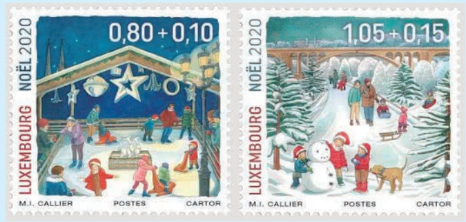
圖 83~ 圖 84

(3) 雷米希鎮的稻草人：每年，年輕的民間遊行隊伍穿過雷米希鎮的街道，一個名為「Stréimännchen」的稻草人被焚燒並扔在摩澤爾河上，它象徵快樂的摩澤爾狂歡節的結束。