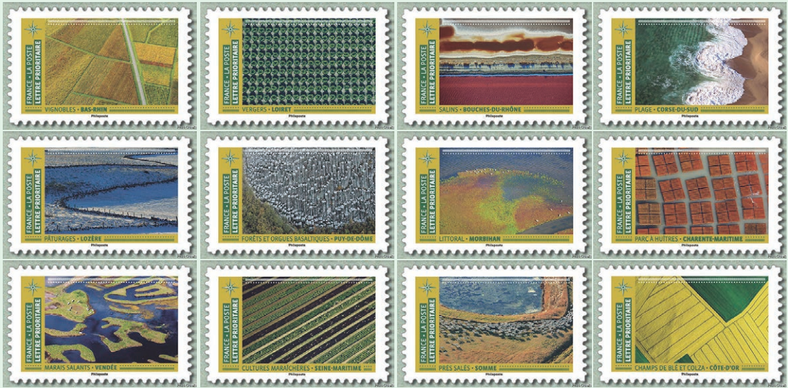
圖 14 ~ 圖 25