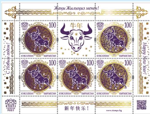
圖 132~ 圖 133

9. 2020年12月31日發行1枚「中國生肖牛年郵票」及1枚小版張（圖132-133）。2021年是「白金屬牛年」，牛年郵票的主圖是金色圓形鏡框中的一頭四蹄奮進的公牛形象，小版張中除5枚郵票外，還有1枚郵票形狀的附票，圖案為一個牛頭，並印有中文「牛年」字樣，小版張四周邊紙分別以中文、吉爾吉斯文、俄文和英文印有「新年快樂！」字樣。（查爾斯）