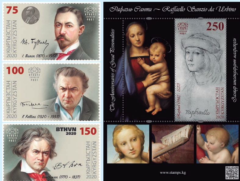
圖 115~ 圖 118

(2) 費德里柯·費裡尼2020年是費裡尼誕辰100週年，他是一位傑出的義大利電影