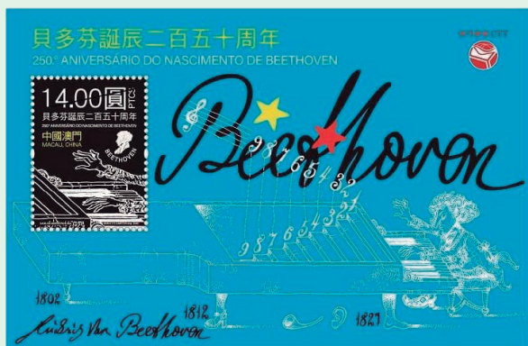
圖 61~ 圖 63