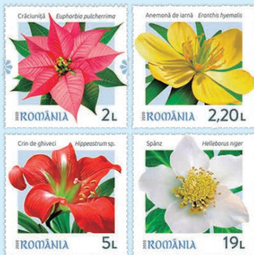
圖 72~ 圖 75