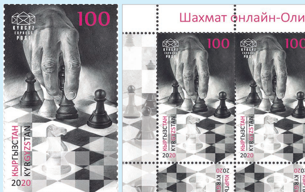
圖 121~ 圖 122