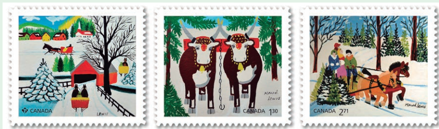
圖 7 ~ 圖 9

(1967)；(3) 家庭和雪橇 (約 1960 年代)。這些都是哈利法克斯新斯科細亞省美術館的收藏。(凡軒)