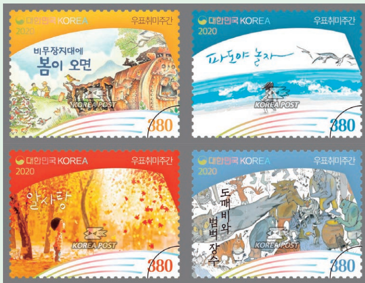
圖 103~ 圖 106

獎－阿斯特麗德·林格倫紀念獎（ALMA），她的著作也已被翻譯成多國語言，包括英語、德語、中文、日語及挪威語，並被改編成動畫和兒童音樂劇。KBBY 評估了許多讀物的文學和藝術價值以及在圖畫書領域的代表性後，篩選出了 4 本圖畫書作為此款紀念郵票的郵圖。郵圖為：