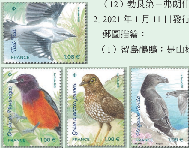
圖 26 ~ 圖 29