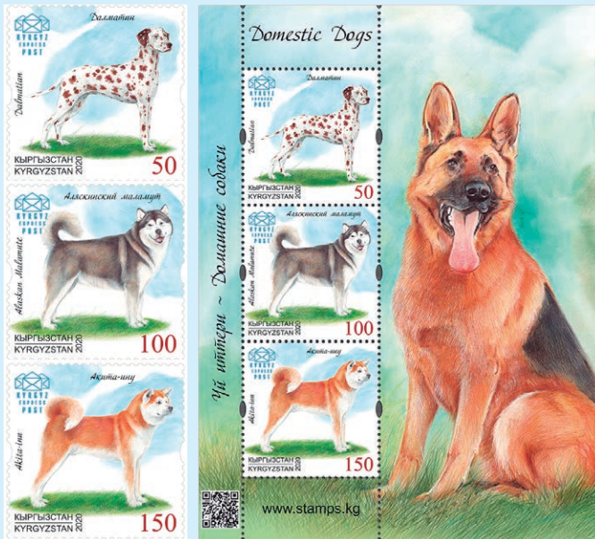
圖 126~ 圖 129