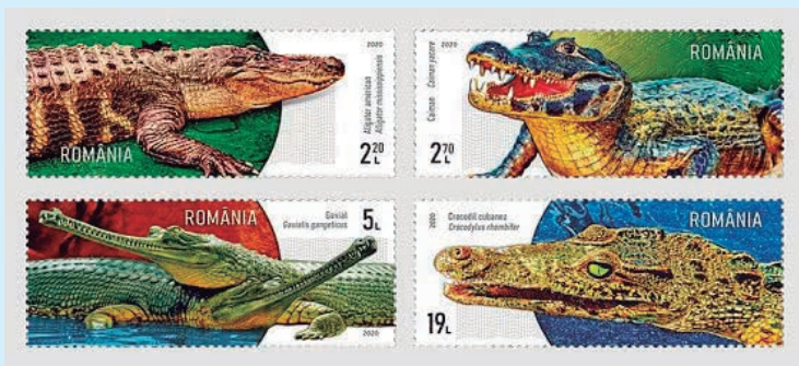
圖 64~ 圖 67

上最古老的生物「活化石」之一。郵圖為：(1) 美國短吻鱷；(2) 巴拉圭凱門鱷；(3) 恆河鱷；(4) 古巴鱷。