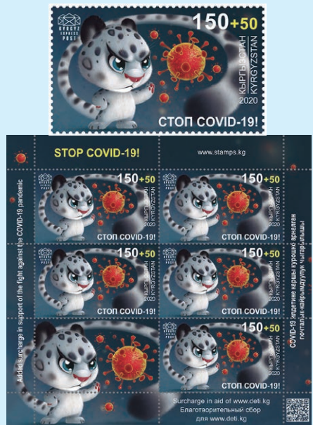
圖 130~ 圖 131

犬種之一，生活在阿拉斯加沿海地區，可以在極端天氣條件下生存；秋田犬是源自日本的犬種，起源於本州的秋田縣，在日本，秋田犬是具有國家歷史文物意義的犬，日本人將秋田犬視為日本的國寶。小全張邊紙位置展示了一隻坐立的德國牧羊犬的圖案。