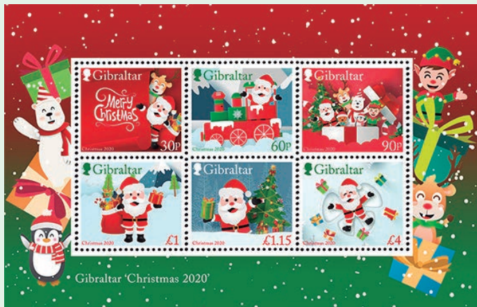
圖 37 ~ 圖 43

陀獼猴生活在直布羅陀巨岩的頂部，牠們之所以能在岩石上存活下來，很大程度上歸功於人類的干預，特別是英國的駐軍，他們通過補充庫存以及不同程度的供應糧食和保護來護養巴巴利獼猴。現在，每年有數百萬遊客被吸引到直布羅陀觀賞著名的巴巴利獼猴。（威聯）