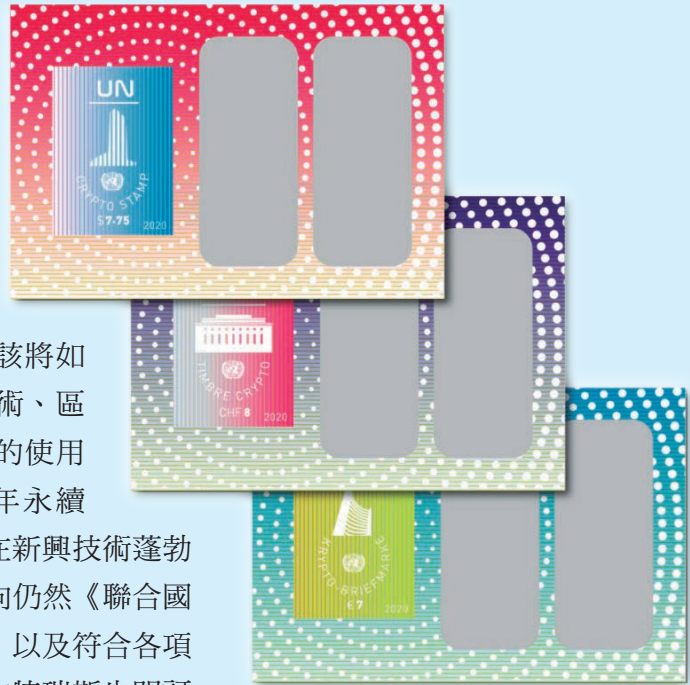
圖 100~ 圖 102

2020 年 11 月 24 日發行 3 枚「聯合國加密郵票紀念小全張」（圖 100-102）。於 2018 年 12 月時，聯合國秘書長安東尼歐·古特瑞斯曾首次發布 1 項聯合國的新技術戰略，該倡議的主要目標是確立聯合國組織該將如何協助與支持人工智能、生物技術、區塊鏈，以及機器人技術等新技術的使用與發展，以加速《聯合國 2030 年永續發展目標》時程的實現，並確保在新興技術蓬勃展開的同時，其所載價值觀和走向仍然《聯合國憲章》與《世界人權宣言》一致，以及符合各項國際法律的規範與準則。秘書長古特瑞斯也明訂了用來支持該戰略的 5 項指導原則：（1）保護與促進全球價值；（2）培養包容性與透明性；（3）合作與夥伴關係；（4）以現有功能和任務為基礎；（5）保持謙虛並繼續學習。聯合國郵政管理局也根據這項新興戰略為發想概念，首次推出 1 款史無前例的聯合國加密郵票，這些加密郵票與聯合國資訊與通信技術組織部門共同開發，並在以太坊區塊鏈（Ethereum Blockchain）平台上運行。加密郵票不僅可以做為普通郵票使用也能當作虛擬收藏品，加密數字會透過 1 種特殊的分佈式數據存儲掛載在區塊鏈當中，並將其存放於 1 個由持有者專屬擁有的數位錢包裡面。加密郵票和銀行卡片一樣，旁側部分會包含將用於通過區塊鏈驗證所需經過加密收集的憑證，要擁有錢包使用權限必須持有相關的使用密碼，以及具有數位加密圖章的附加代碼，如果加密郵票的數位版本被出售，或是被持有者從 1 個錢包轉移到另 1 個錢包，此交易也將會完整全面的記錄在區塊鏈平台當中。（奇尼）