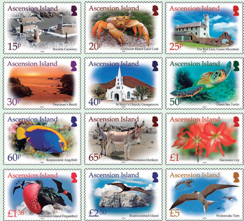
圖 134~ 圖 145

2020年12月22日發行12枚「島嶼寶藏常用郵票」（圖134-145）。郵票展示了位於阿森鬆島的12處歷史遺跡和各類當地特色動植物，它們被視為阿森鬆島的寶藏。包括：博內塔公墓（面值15便士）、阿森鬆島最大的本土陸地動物「陸地蟹」（面值20便士）、1863年建於阿森鬆島