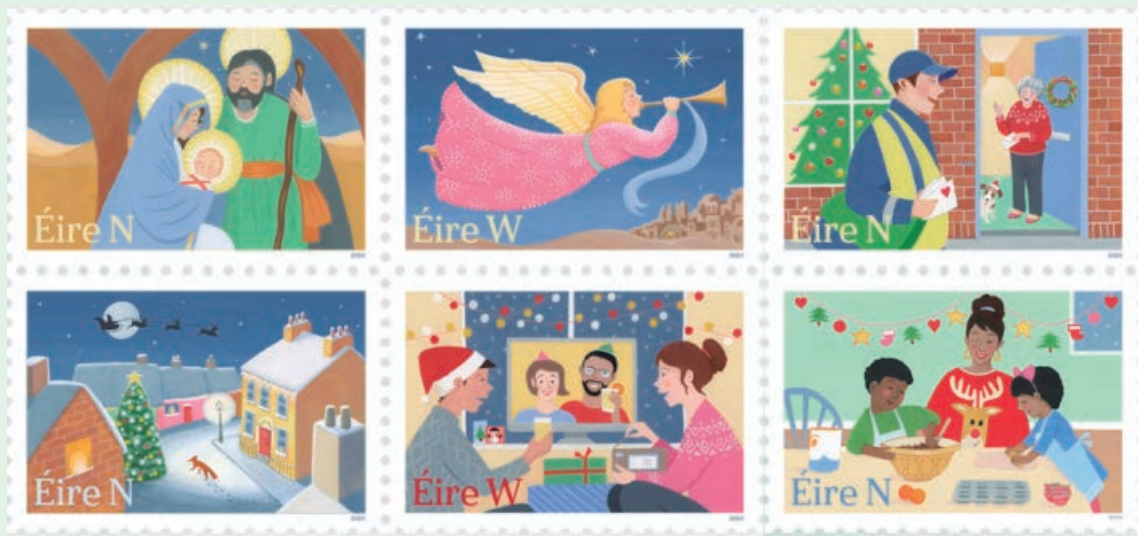
圖 94~ 圖 99

2020 年 11 月 20 日發行 6 枚「2020 聖誕節紀念郵票」（圖 94-99）。此次發行的 6 枚聖誕節以「與 Covid 一起生活」為設計概念，希望傳達在 2020 這因疫情肆虐全球而導致動盪的 1 年間，人們和各社區之間彼此在保有社交距離或是採取安全隔離的同時，仍然保有密切聯繫與緊密連結的重要性。郵票採用舒服而柔美的色調，並保有聖誕節所擁有的繽紛色彩，傳遞溫馨的同時也展示了一些新的傳統，這些傳統因為疫情造成的隔離儼然已成為聖誕節的一部分。郵圖以上下成對形式展示了：聖誕節宗教傳統的耶穌誕生場景；街道雖然空蕩無人卻有著高大色彩鮮豔亮著燈的聖誕樹，家家戶戶窗邊仍然散出溫暖的燈光，夜空中也有聖誕老人乘著馴鹿拉著的雪橇；天使在聖誕節報佳音；在居家隔離同時仍在聖誕節時分在家中掛上歡樂節慶裝飾，與家人和朋友進行視訊通話，也圍在一起拆封禮物與卡片；郵遞員在聖誕節也不缺席，在保持社交距離的情況下仍盡責地為客戶遞送賀卡與祝福；以及即使隔離在家也能從事的與家庭成員一起烘焙的聖誕節傳統。2020 年的聖誕節對許多人來說也許和以往大不相同，因此這時節家人和朋友之間的親切溫暖問候，也將比以往任何時候都顯得更有意義。（奇尼）