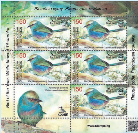
圖 123~ 圖 124

6. 2020 年 12 月 21 日發行 1 枚「比什凱克大清真寺小型張」（圖 125），郵票由吉爾吉斯斯坦和土耳其聯合發行。吉爾吉斯斯坦和土耳其在精神、文化、經濟和政治領域