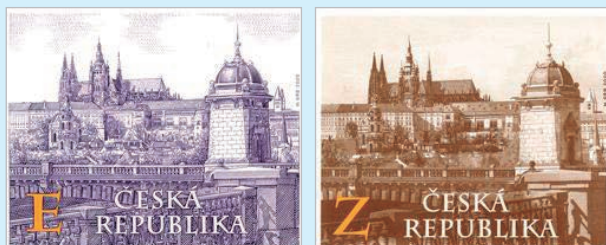
圖 50 ~ 圖 51

3. 2020年11月25日發行2枚「布拉格城堡郵票」(圖50-51)，布拉格城堡是捷克重要的文化和歷史古蹟，為捷克國家的古老象徵。自9世紀以來，它一直是捷克王子和後來的國王居住地。布拉格城堡占地近70,000平方公尺，由大量風格各異的宮殿和教堂建築組成。公元14世紀，在神聖羅馬帝國盧森堡王朝皇帝查理四世統治時期是布拉格城堡的繁榮時期。隨後，在查理的兒子瓦茨拉夫四世執政期間，將城堡進行了重建。在16世紀下半葉魯道夫二世統治時期，城堡逐漸達到了目前的高度。皇帝將布拉格城堡選作永久皇宮，並將之變成整個帝國最恢弘壯麗的中心。18世紀