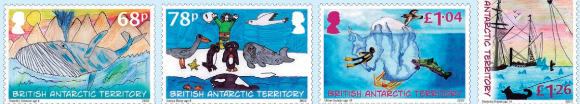
圖 146~ 圖 149

1. 2020年12月16日發行4枚「發現南極洲郵票設計大賽獲獎作品郵票」（圖146-149）。2020年是發現南極大陸200週年，英屬南極領地是英國14個海外領地中面積最大、位置最南端的領地。為了慶祝200週