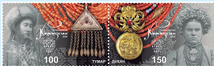
圖 112~ 圖 113

1. 2020年12月9日發行2枚「傳統珠寶郵票」及1枚小全張（圖112-114）。該套