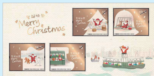
圖 31 ~ 圖 36