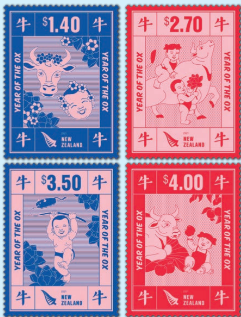
圖 10 ~ 圖 13

據說舞龍會帶來了好運和繁榮，當牛和嬰兒一起前進時，代表新的一年的開始和慶祝來年的活動，嬰兒手持一朵蓮花，除了用來表示純潔之外，也寓意重新開始來年的生活。