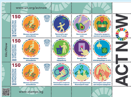
圖 119~ 圖 120