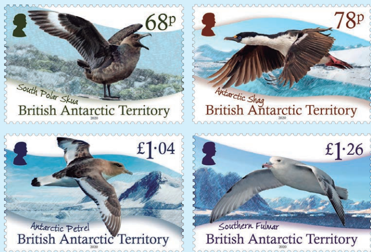
圖 150~ 圖 153

2. 2020 年 12 月 16 日發行「南極洲鳥類郵票」郵票（圖 150-153）。生活在南極洲的