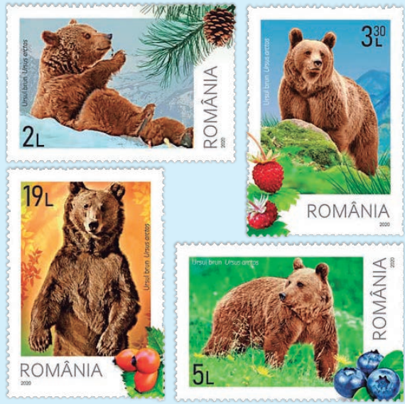
圖 68~ 圖 71

種，羅馬尼亞是歐洲最大的棕熊種群所在地之一，棕熊也是羅馬尼亞一種標誌性的野生動物。棕熊是最大的陸生食肉動物之一。雄性體重在 250 至 300 公斤之間，有時可以超過 400 公斤，雌性體重 150 至 250 公斤。棕熊性情孤獨，除了繁殖期和撫幼期外，都是單獨活動，雌棕熊在冬眠時生下 1 到 3 隻小棕熊，幼熊與母親一起生活約 2 年。棕熊常出現在羅馬尼亞民間故事和神話中，被認為是羅馬尼亞相當受歡迎的動物，目前，在羅馬尼亞，棕熊總數約有 6,000 隻，常見於喀爾巴阡山脈一帶，本組郵圖是羅馬尼亞冬、春、秋、夏 4 個不同季節的棕熊。