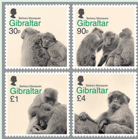
圖 44 ~ 圖 47