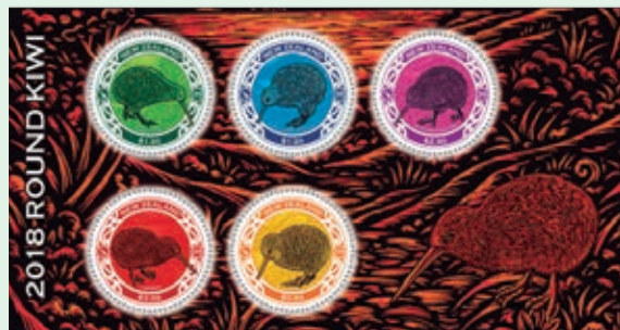
圖 38~ 圖 43