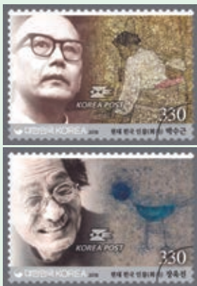
圖 189~ 圖 190