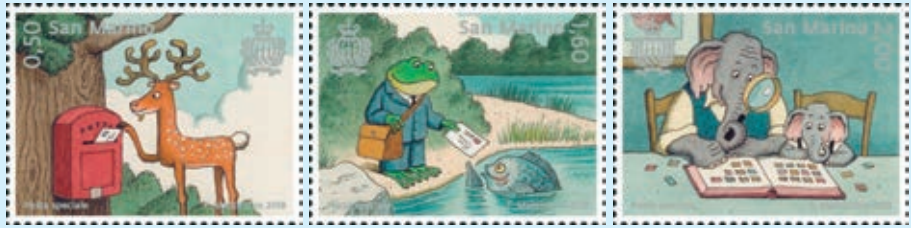
圖 144~ 圖 146