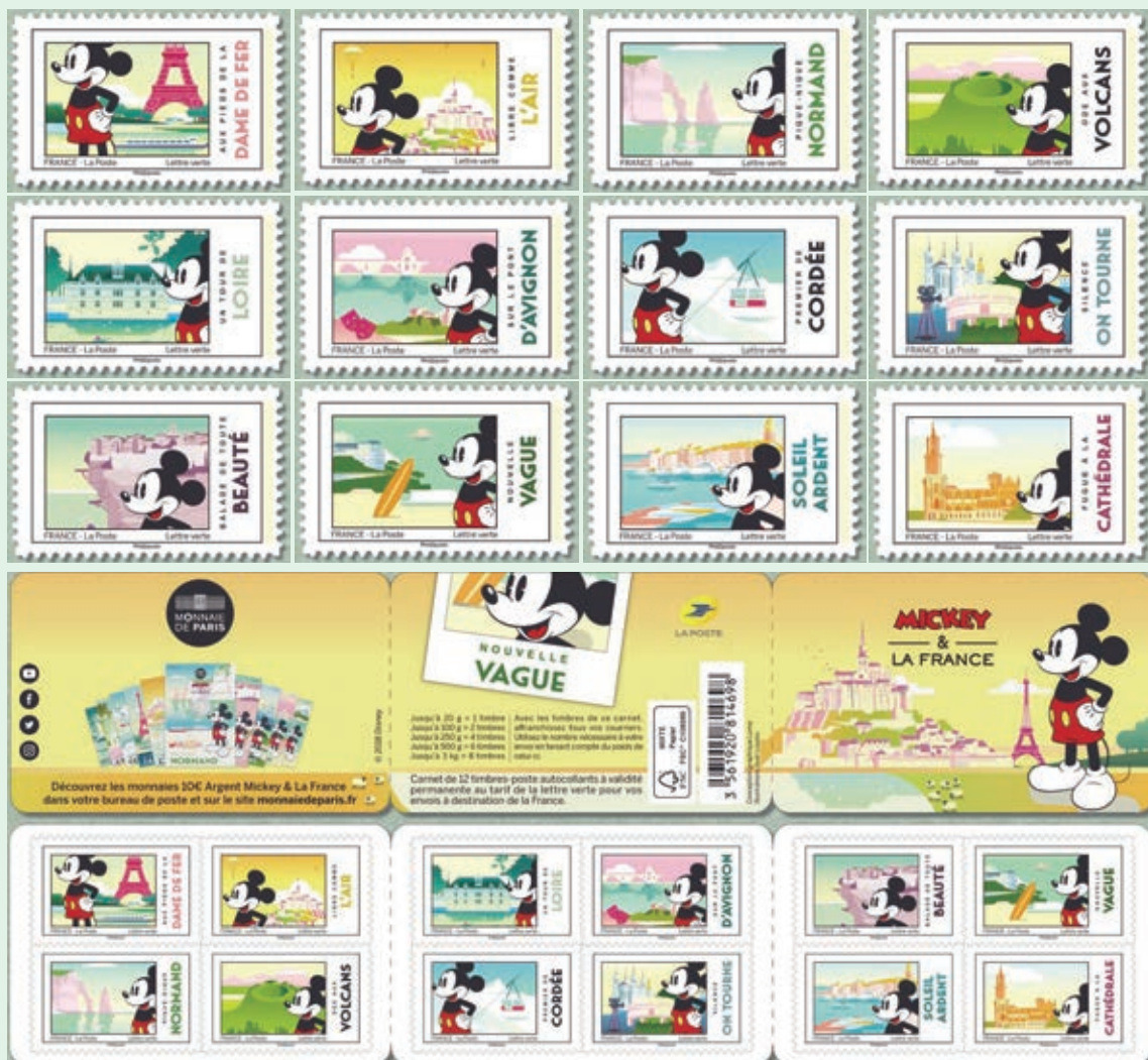
圖 60~ 圖 72

1. 2018年7月2日發行12枚「米老鼠周遊法國郵票」和1本郵票小冊（圖60-72），以慶祝米老鼠誕生90週年。華特·迪士尼的經典卡通人物—米老鼠是在90年前的1928年11月18日問世的。當天，米老鼠在由華特·迪士尼所製作的動畫電影「蒸汽船威利號」公開亮相，因此這一天也是米老鼠的生日。自此米老鼠進入娛樂界，成為家喻戶曉的國際巨星，1978年成為第一位在好萊塢星光大道留下印記的動畫明星。米老鼠有一對圓形的耳朵，經常穿著紅色短褲、黃色大鞋和白色手套，常與女朋友米妮老鼠、寵物狗布魯托，以及唐老鴨和高飛一起出現。米老鼠以其隨和、快