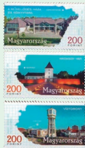
圖 171~ 圖 173