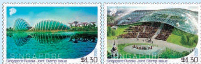
圖 123~ 圖 124

1. 新加坡和俄羅斯郵政於 2018 年 6 月 1 日聯合發行 2 枚「新加坡和俄羅斯建交 50 週年郵票」（圖 123-124），郵圖是兩國的頂級城市公園：