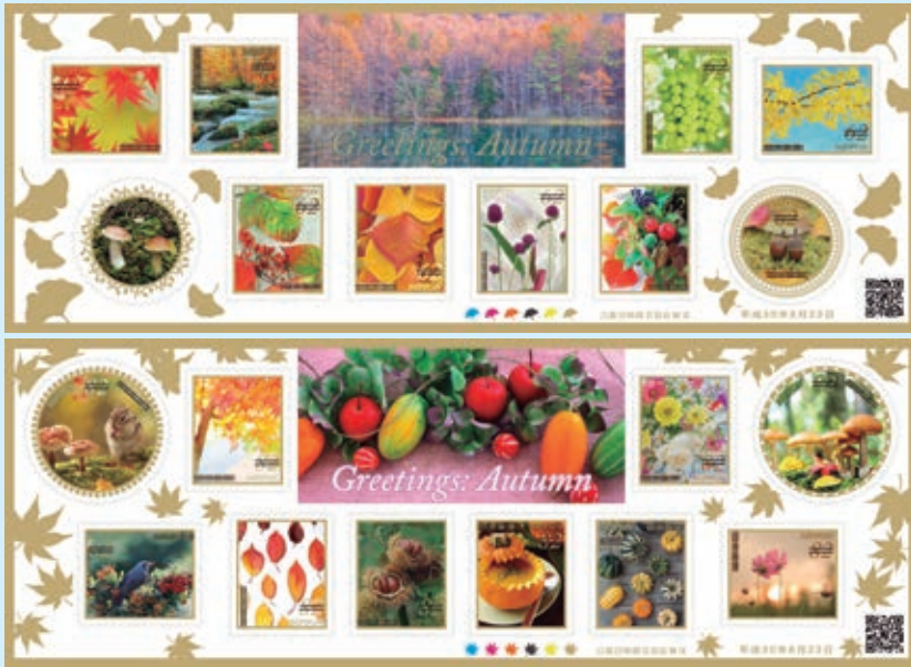
圖 22~ 圖 23

是目前日本最大的綜合體育運動賽事。「第 73 屆國民體育大會」將於 2018 年 9 月 29 日至 10 月 9 日在福井縣舉行。日本郵政於 2018 年 8 月 29 日發行 10 枚「第 73 屆國民體育大會郵票（福井縣）郵票」和 1 張小版張（圖 24-34），郵圖為：（1）體操比賽；（2）越前蟹：福井縣的越前蟹生長於水深 200-400 公尺的海域中，由於越前海岸沿岸海域水溫易受冬季寒冷氣候的影響，這種低寒嚴峻的海域孕育出肉質緊緻、味道鮮美的螃蟹，是每年冬季進貢給皇室的海鮮首選；（3）攀岩比賽；（4）眼鏡框；（5）自行車比賽；（6）越前水仙：福井縣中部的越前海岸氣候溫和，每年從 12 月至翌年 3 月，以越前岬周圍為中心，野生的水仙花競相開放，形成一片水仙花海，每年 1 月中旬到 2 月中旬，當地就會舉辦「越前水仙祭」，越前水仙每朵約有 4 至 8 片花瓣，花瓣潔白，散發出甘甜的香氣，為海岸景色營造出雅緻清逸的氣息，積雪之下也不會折斷的越前水仙，別名又稱「雪中花」；（7）曲棍球比賽；（8）三方五湖：是福井縣的知名勝景之一、世界重要的濕地，也是國際知名的水鳥棲息地。跨越美濱、若狹兩町的三方五湖，由水月湖、三方湖、菅湖、日向湖、久久子湖等 5 個湖泊組成，五湖因受海水、淡水、鹹淡水等水質異同和水深的高低影