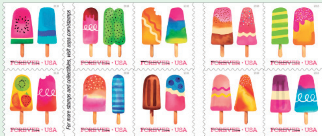
圖 151~ 圖 160