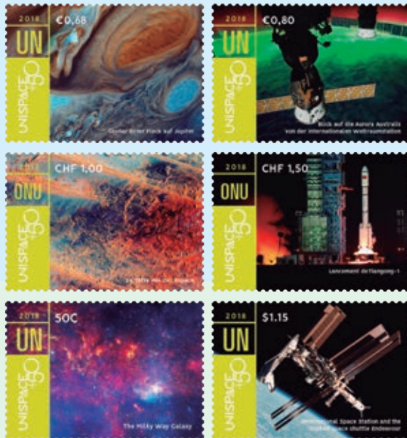
圖 179~ 圖 184

2018 年 6 月 20 日發行 6 枚「第一次外太空會議召開 50 週年紀念郵票」（圖 179-184）。聯合國和平利用外太空委員會（United Nations Committee on the Peaceful Uses of Outer Space）第 61 屆會議的特別會議－和平開發利用太空會議於 6 月 20 日至 21 日在奧地利維也納舉行，目的是要慶祝第一次外太空會議召開 50 週年，同時評估 1968 年、1982 年和 1999 年在維也納舉辦的 3 次外太空會議對於全球空間管理的貢獻。本次也藉機讓聯合國會員國、觀察會員國、聯合國各組織、外太空機構、非營利組織等齊聚一堂，共同思考和審議全球太空合作的進程，謀求人類的福祉。此活動盤點人類