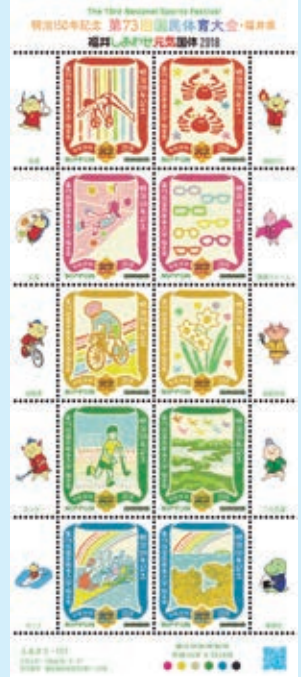
圖 24~ 圖 34