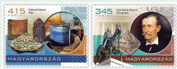
圖 169~ 圖 170

逐漸成長為工業化的藍染工廠，因此在博物館中可看到匈牙利藍染業的進化史。郵票展示染料室中正在工作的染缸和一些手製的藍染用木塊，其中一塊的花紋是克魯格家族的紋章。