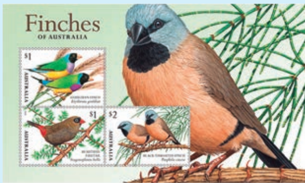
圖 95~ 圖 98