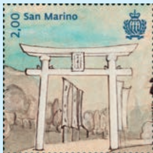
圖 138~ 圖 139

2. 2018年6月5日發行2枚「聖馬力諾神社郵票」（圖138-139），「日本聖馬力諾友誼協會（JSFS）」由身兼日本外交評論家、作家和導演的Hideaki Kase教授於2001年創立。2011年JSFS開始一項資金籌集活動，希望在古老、自由和具國際氣息的聖馬力諾建造日本典型建築神道風格的紀念碑，來紀念2011年3月在日本東北地震喪生的受害者。這座位於Podere Lesignano鎮的神社在2014年6月22日舉行開幕式，這是歐洲第一座也是唯一的官方神道紀念碑，該紀念碑由白色的鳥居和神社組成。