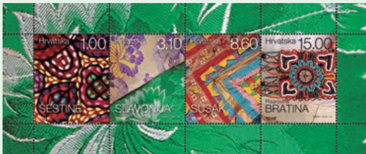
圖 211~ 圖 215

(2) 斯拉沃尼亞：19 世紀下半葉，經濟發展使該地區具有實力購買昂貴的材料，如來自中歐的絲綢以及法國和義大利的真絲或人造絲線製成的布，具有花卉圖案的絲綢織錦開始流行。20 世紀初，佩戴花卉圖案的絲綢圍巾成為當地的時尚潮流。