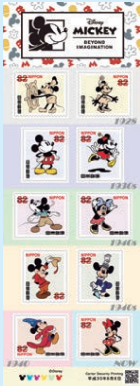
圖 12~ 圖 13