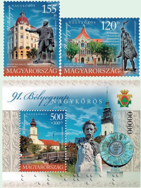
圖 175~ 圖 177

芬號戰艦（Szent István）是第一批在每個砲塔上配有三支口徑 305 釐米火砲的戰艦，由 4 組砲塔構成戰艦主要的武器，配備兩個螺旋槳，最高速度為 20.4 節（每小時 38 公里）。雖然聖史蒂芬號戰艦在 1915 年開始服役，但它大部分都在波拉港停靠，執行反空襲的任務。1918 年 6 月 9 日前夜，聖史蒂芬號終於迎來它的第一個出海任務，但因技術問題讓它無法在黑夜移動，而冒險在黎明時航行，結果被敵軍機動船發現，遭到兩枚魚雷擊中，最後聖史蒂芬號翻覆並且沉沒，船上 1,087 人中，共有 85 名水手及 4 位官員喪生。此次戰敗摧毀了奧匈帝國大型的海軍布署計畫，此後，帝國的軍隊不再出海。