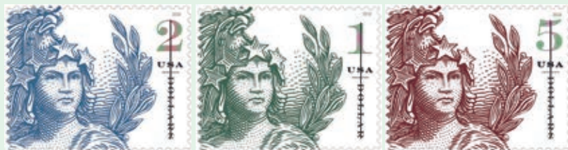
圖 161~ 圖 163

有香甜的夏日氣味，輕刮後即可散發香味。冰品有許多不同的種類，今日的美國人喜歡在夏天吃上一支清爽的冰棒，冰棒的製作簡易，不管是大型的食品製造商、甜點店或家中廚房都能輕易製作。近年來人們喜歡在冰品中加入奇異果、西瓜、藍莓、柳橙或是草莓等新鮮水果，其他像是巧克力、沙士和可樂口味也很受到歡迎，有些包裝內還會有兩根木棍，方便與朋友分享。