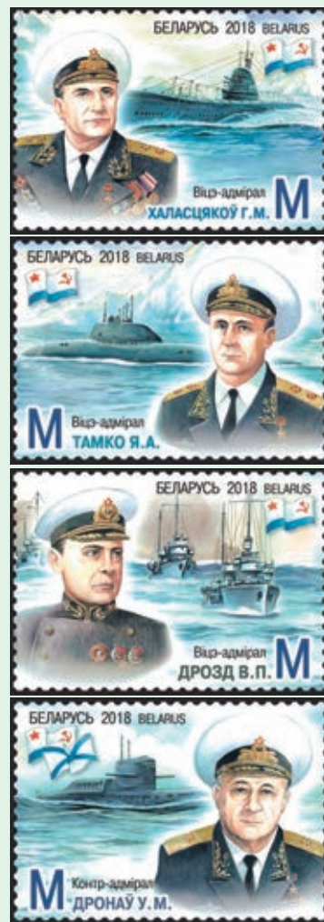
圖 91~ 圖 94

4. 2018年7月7日發行4枚「白俄羅斯出生的海軍上將郵票」（圖91-94），雖然白俄羅斯是個內陸國，但仍有許多白俄羅斯人的人生與海軍密不可分。第二次世界大戰後直到1992年，將近有100萬名白俄羅斯人投身海軍，現在仍有20多萬曾在不同時代於海軍服務的人們住在白俄羅斯，本組郵圖描繪4位在白俄羅斯出生的海軍將領。（威聯）