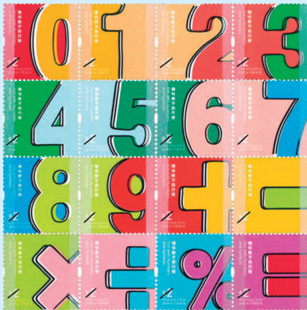
圖 44~ 圖 59

2018 年 7 月 17 日發行 16 枚「兒童郵票－趣味數字與符號」（圖 44-59），數字和符號是不可或缺的溝通元素，與我們的日常生活息息相關。現今世界通用的阿拉伯數字，其實是由印度人發明的，再經阿拉伯人傳遍歐洲。歐洲人以為這套數字系統是阿拉伯人發明，因此把這些數字誤稱為「阿拉伯數字」，名稱一直沿用至今。阿拉伯數字標示清楚簡單，方便大量及繁複的運算，最後成為全球的共通數字系統，大大推動數學及科學的發展。符號是用來表達意思、進行計算、推理的工具，採用符號省卻複雜的文字敘述，令數學變得簡潔準確。加號「+」及減號「-」分別由拉丁語「et」（「和」的意思）及「minus」（「減」的意思）演變而來，第一次出現在印刷書上是德國數學家維德曼於 1489 年在其所著的《商業算術書》內使用。乘號「×」由英國