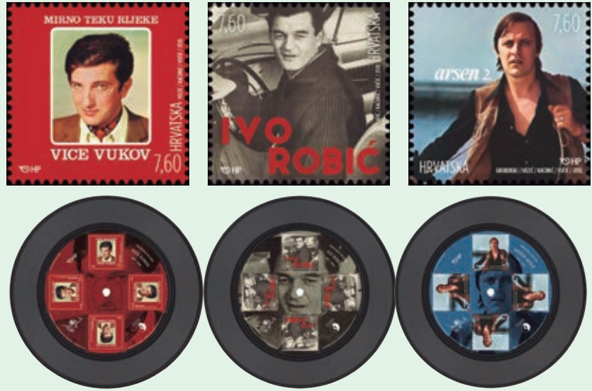
圖 216~ 圖 221

(3) 蘇薩克島：是北亞得里亞海最小的人居島嶼之一，一直到 20 世紀中葉，這裡的婦女都一直穿著該地的民俗服裝。兩次世界大戰之間，傳統的裙子被改良縮短到膝蓋以上，並以粉