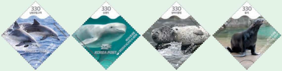
圖 185~ 圖 188

為人類過度捕撈、誤捕，以及環境污染而逐漸減少棲息地，造成數量銳減而急需保護。郵票主題分別是：