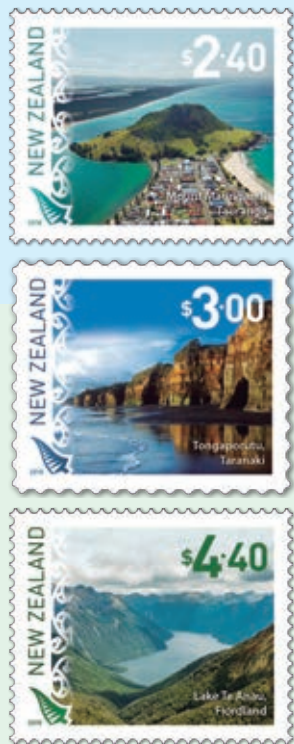
圖 35~ 圖 37

奇異鳥是紐西蘭最著名的特有種鳥類，毛利人根據奇異鳥的叫聲— kiwi、kiwi、kiwi 命名。奇異鳥有很長的喙喙和毛髮般的羽毛，紐西蘭人將這種可愛而不會