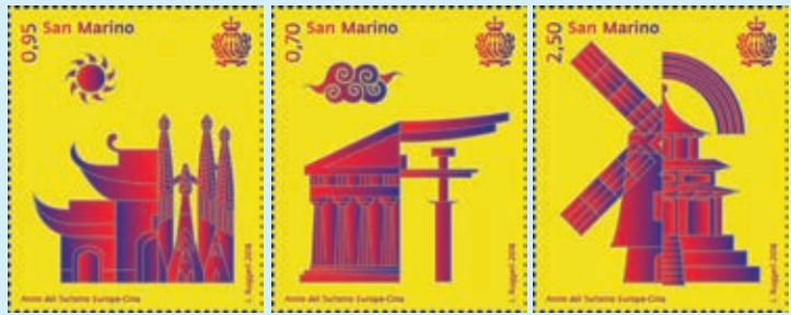
圖 147~ 圖 149

「特殊郵件郵票」（圖 144-146），郵圖以復古的插畫風格有趣地呈現通信世界：（1）在樹林裡一隻