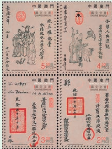
圖 132~ 圖 136

郵圖是以淡黃配上中國慶典的紅燈籠，表現出中國人節慶的喜悅，火紅的燈籠高高懸掛，映現出點點暖意，瀰漫著溫馨而熱鬧的氣氛。