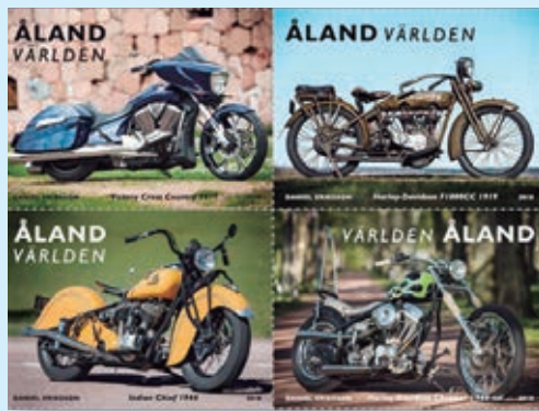
圖 206~ 圖 209

(4) 美式改裝車：現在的擁有着於 1989 年在瑞典購買這輛使用眾多老舊零件組裝而成的改裝車。（查爾斯）