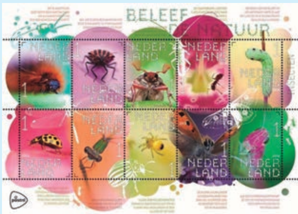
圖 75~ 圖 84

圖聚焦在荷蘭引以為傲、巨大的城市大門。3張小版張中，前2張分別是濟里克澤（Zierikzee）的城門和屈倫博赫（Culemborg）的城門，第3張則分別為：Hattem、Culemborg、Zierikzee、Vianen和Bergen op Zoom等5座城門。視覺藝術家Jan Rothuizen用黑色筆在白色背景上劃出了郵票上城門的輪廓，而每張小版張的背景圖案是相關城門周圍的透視地圖。（威聯）