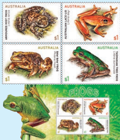
圖 109~ 圖 113

(1) 甲雨濱蛙：俗稱裝甲霧青蛙，為雨蛙科雨濱蛙屬，分布於昆士蘭東北部約 4 平方公里的區域內，裝甲霧青蛙的上半身是灰色或灰棕色，皮膚有精細的瘤狀表面，下半身是白色，牠們有圓扁形的頭部、被截頭的鼻部和凸出的眼睛，是澳大利亞最瀕危的兩棲動物之一，被列為《環境保護和生物多樣性保存法（EPBC）》和《IUCN 紅色名錄》中的「極度瀕危物種」，其數量在 500 到 1,000 隻之間。