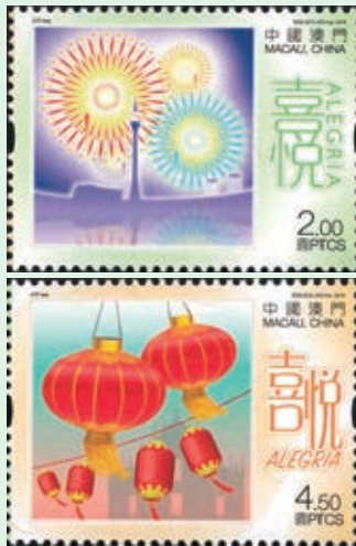
圖 130~ 圖 131