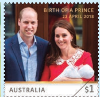
圖 104~ 圖 107