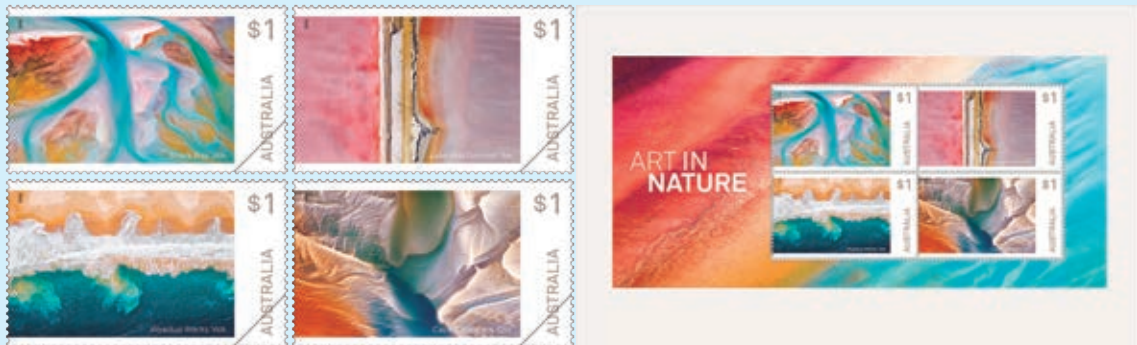
圖 99~ 圖 103