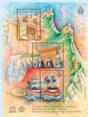
圖 140~ 圖 143

3. 2018年6月5日發行3枚「聖馬力諾歷史中心與蒂塔諾山被列入世界遺產10週年郵票」和1張小全張（圖140-143），「聖馬力諾歷史中心與蒂塔諾山」位於聖馬力諾市，占地55公頃，於2008年7月7日被列入《世界遺產名錄》，其歷史可追溯至13世紀的城邦時期。