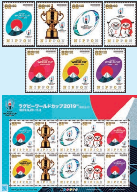
圖 14~ 圖 21