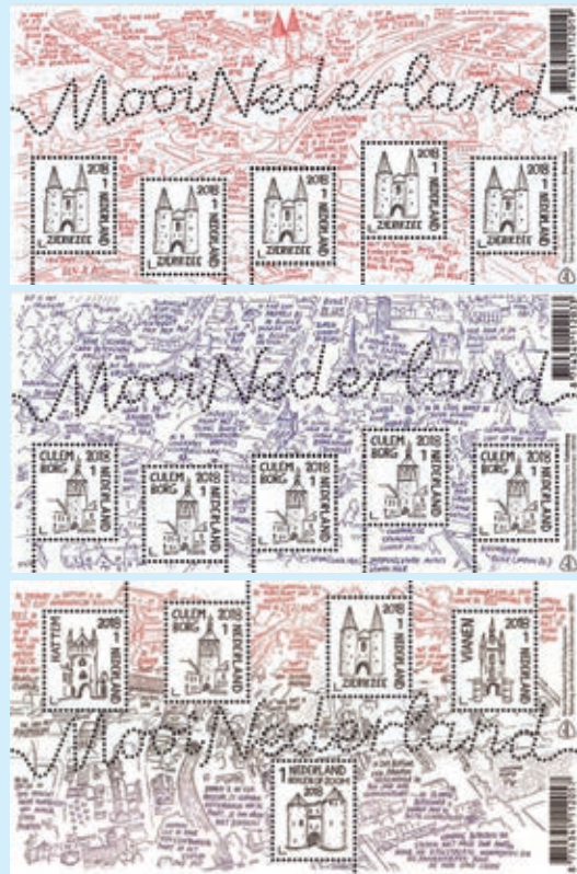
圖 85~ 圖 87

圖聚焦在荷蘭引以為傲、巨大的城市大門。3張小版張中，前2張分別是濟里克澤（Zierikzee）的城門和屈倫博赫（Culemborg）的城門，第3張則分別為：Hattem、Culemborg、Zierikzee、Vianen和Bergen op Zoom等5座城門。視覺藝術家Jan Rothuizen用黑色筆在白色背景上劃出了郵票上城門的輪廓，而每張小版張的背景圖案是相關城門周圍的透視地圖。（威聯）