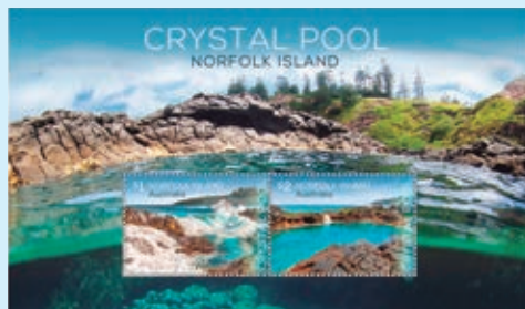
圖 114~ 圖 116

6. 2018 年 7 月 17 日發行 2 枚「諾福克島水晶池郵票」和 1 張小全張（圖 114-116），諾福克島岩石區的岩池可證明該島是火山運動形成的產