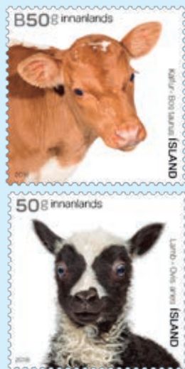
圖 58~ 圖 59

2. 2018年4月26日發行2枚「旅遊郵票（第7集）」（圖60-61），本組郵圖描繪：