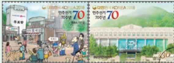
圖 126~ 圖 127

2. 2018 年 5 月 10 日發行 2 枚「民主選舉 70 週年郵票」（圖 126-127）。大韓民國自 1948 年 5 月 10 日舉行史上第一次的立法委員選舉至今，共已舉辦了 19 次的總統選舉、20 次立法委員選舉、6 次全國同時舉辦的地方選舉和數次公投和地方、一般選舉等等。70 年來，韓國選舉文化持續深化和發展，提供選民公平、平等的投票機會，