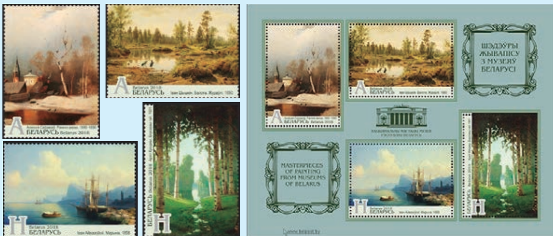
圖 45~ 圖 49

（1）阿列克謝·薩伏拉索夫於1880至1890年所繪的《早春》：阿列克謝·薩伏拉索夫（1830-1897）是俄羅斯著名的風景畫家，也是巡迴展覽畫派的創始人之一，一生從事風景畫創作，其風景畫不僅展現了俄羅斯大地的自然之美，同時也表現了俄羅斯人民的精神氣質。