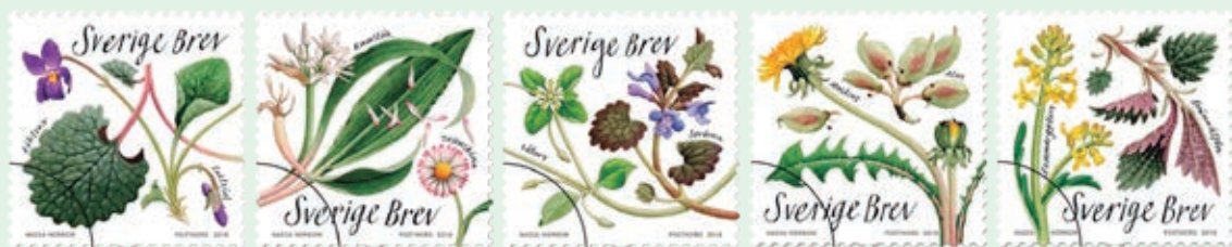
圖 67~ 圖 71