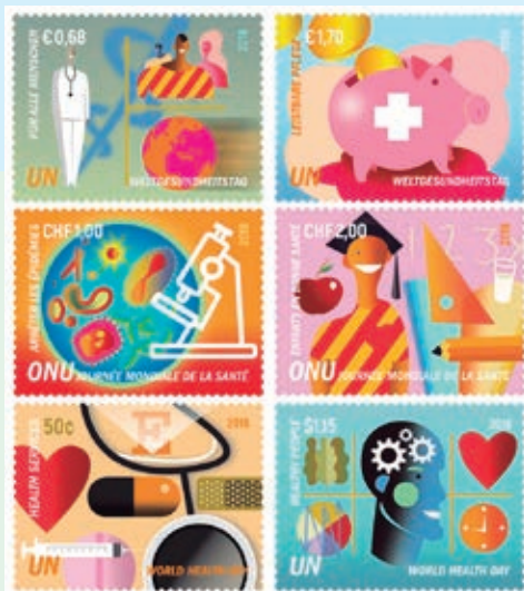
圖 118~ 圖 123

(1) 為了所有人；(2) 價格實惠；(3) 預防流行病；(4) 健康的孩子；(5) 健康服務；(6) 健康的人。（朵莉絲）