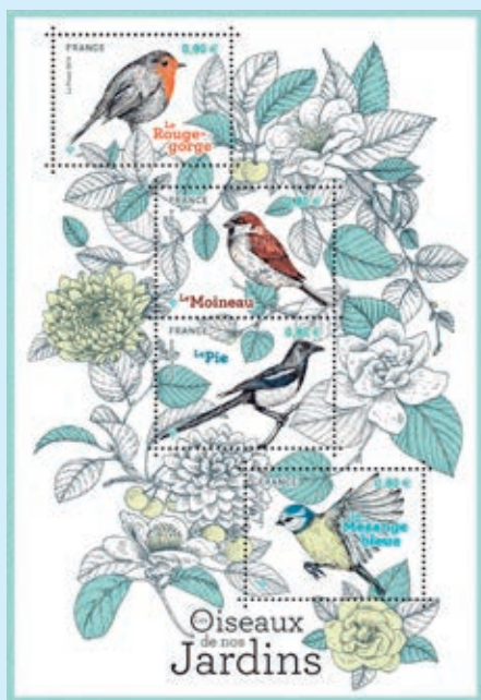
圖 98~ 圖 102