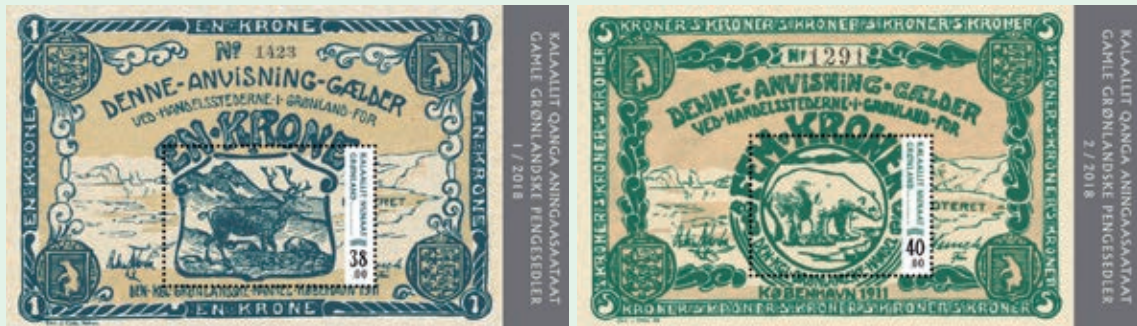
圖 140~ 圖 141