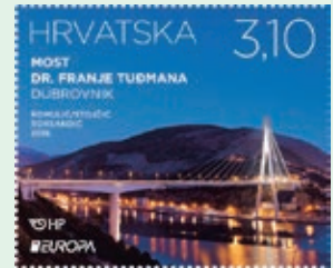
圖 154~ 圖 155