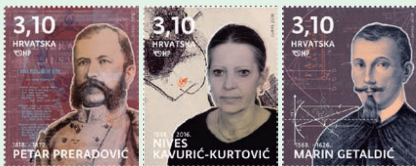
圖 151~ 圖 153

人伊凡·薩克欽斯基後，他心中的愛國熱情被重新激發，遂開始撰寫詩作，起初使用德語並請人幫忙翻譯，在1843年首次使用克羅埃西亞語發表了詩作，此後直至逝