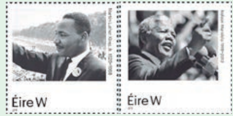
圖 116~ 圖 117

2018年4月5日發行2枚「國際政治家郵票」（圖116-117），紀念小馬丁·路德·金恩和納爾遜·曼德拉。小馬丁·路德·金恩（1929-1968）是一位知名的社會運動家及人道主義者，對增進非裔美國人的公民權利有巨大的影響。金恩原本是浸信會的牧師，1963年組織「向華盛頓進軍」的運動，並在這場運動中向25萬位示威者發表《我有一個夢》的演講，1968年4月4日於田納西州孟斐斯被暗殺。納爾遜·曼德拉（1918-2013）是南非第一位黑人總統，也是一位非洲廚師之子，他研讀法律，並且成為南非第一位黑人律師。在1962年被以陰謀和叛國罪逮捕並判處終身監禁，之後在1982年被釋放。1994年到1999年出任南非總統，領導政府為和平做出許多努力，透過和解來消除種族隔離的衝突。他在1993年獲得諾貝爾和平獎，與釋放他的總統弗雷德里克·威廉·戴克拉克共享此榮耀。（朵莉絲）