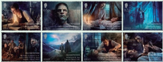
圖 35~ 圖 42