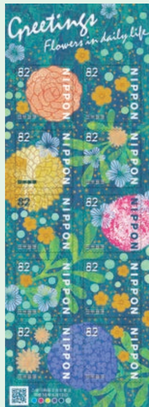
圖 54~ 圖 55