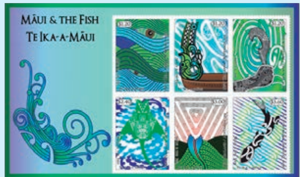
圖 1~ 圖 7