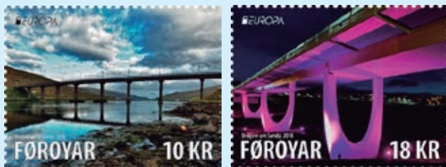
圖 147~ 圖 148