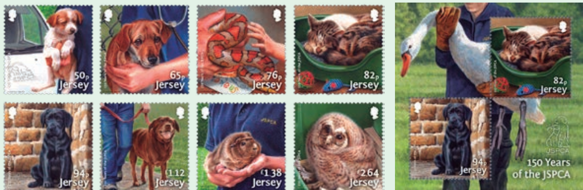
圖 26~ 圖 34

1. 2018 年 5 月 25 日發行 8 枚「澤西防止虐待動物協會成立 150 週年郵票」和 1 張小全張（圖 26-34）。「澤西防止虐待動物協會（JSPCA）」成立於 1868 年，旨在改變民眾對動物的態度。1913 年澤西居民弗朗西絲·伊麗莎白·威爾遜成立「澤西島動物庇護所」，以照顧被遺棄、患病、受傷和流浪的動物。1925 年 JSPCA 成立了一個委員會，協助動物庇護所於 1930 年購買目前庇護所的房舍。現在 JSPCA 提供的許