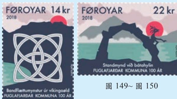
圖 149~ 圖 150