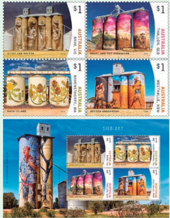
圖 14~ 圖 18

3. 2018 年 5 月 21 日發行 4 枚「穀倉藝術郵票」和 1 張小全張（圖 14-18）。百年來，澳大利亞維多利亞州維摩拉和馬利的鄉村地區有許多小麥穀倉，現在它們脫胎換骨，成了澳大利亞最大的戶外畫廊。自 2015 年以來，街頭藝術家在穀倉上繪製一些非凡的藝術品，使得小型農村社區恢復