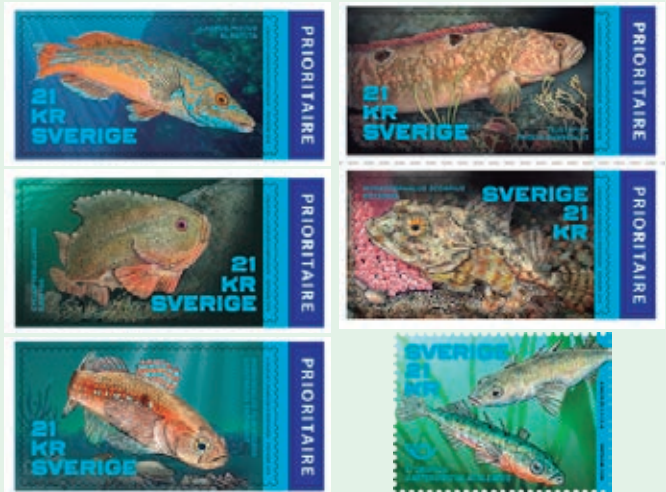
圖 74~ 圖 79