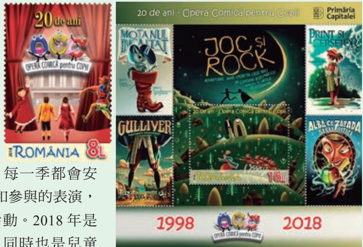
圖 103~ 圖 104

和轉讓，館藏作品達 1,055 件；現在其藝術品資產已超過 5,500 件，包括繪畫、圖表、雕塑作品及小部分裝飾藝術等珍貴收藏。（明華）