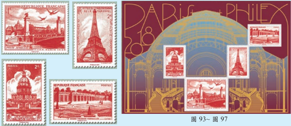
圖 93~ 圖 97

是當年為了慶祝 1892 年法俄同盟，而由俄國送給法國的禮物，1896 年 10 月 7 日俄國沙皇尼古拉二世和法國總統弗朗索瓦－菲利－福爾一起為這座橋奠基，橋上有新藝術運動路燈、天使、仙女和兩端的飛馬等極其精美的雕塑和裝飾，被公認是巴黎最華麗、優雅的橋梁。