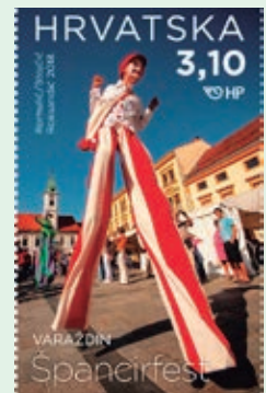
圖 157~ 圖 158