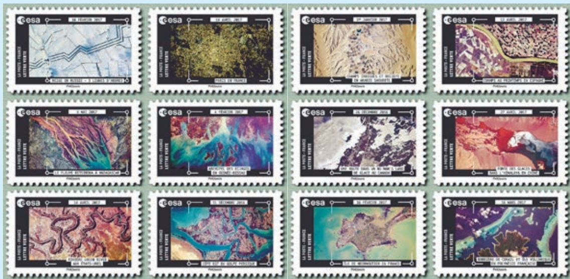
圖 81~ 圖 92