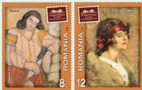
圖 105~ 圖 108