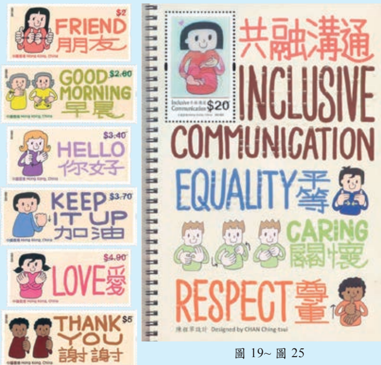
圖 19~ 圖 25

為宣揚共融溝通，香港郵政於 2018 年 6 月 7 日發行 6 枚「共融溝通郵票」和 1 張小全張（圖 19-25）。郵票用中英文展示 6 個常用詞語，分別為「朋友」、「早晨」、「你好」、「加油」、「愛」和「謝謝」。每枚郵票左側都有線條簡單而造型可愛的漫畫人物，以手語動作表達相關詞語；郵票表面有該詞語的點字，以凸字油墨印刷而成。手語和點字並列的設計，使有不同需要的人士都能接收郵票所傳達的訊息。郵票小全張更採用了平版加光柵技術印製，讓「共融溝通」的手語動作活靈活現。（婉柔）