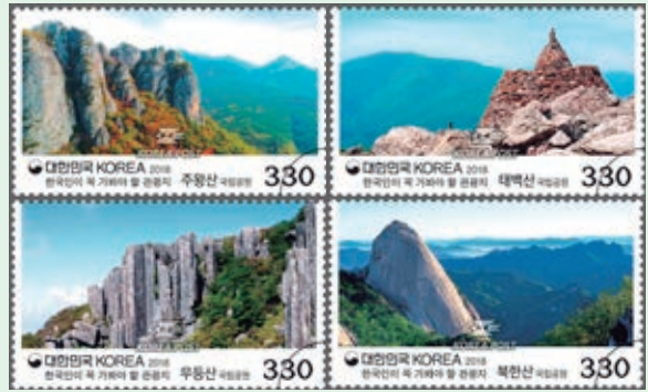
圖 128~ 圖 131

了舉辦國家選舉、國家公投、居民公投和召回選票，同時也操作其他更貼近民眾的選舉如政黨代表、公會主席和鄰里代表的選舉等。此外，NEC 也提供民主公民教育，以建立健全的政黨制度。郵圖之一描繪良好的選舉環境，另一枚郵圖則是 NEC 的外觀。