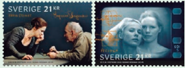
圖 72~ 圖 73

本組郵圖描繪古典戲劇《瑪麗亞·司圖亞特》中的女演員佩尼拉·奧古斯特，以及電影《假面》中的女演員碧比·安德森和麗芙·烏曼等的演出。