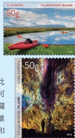
圖 60~ 圖 61

3. 2018年4月26日發行1枚「Siglufjörður 鎮建鎮百週年郵票」（圖62）。Siglufjörður 鎮位於冰島北部同名的峽灣，該地區的貿易始於1788年，1818年成為公認的交易中心，1918年成為一個小鎮。從1903年開始，冰島北部出色的鮭魚業造就 Siglufjörður 鎮的繁榮和興盛，1940和1950年代是該鎮的全盛期，列名冰島第5大城鎮。