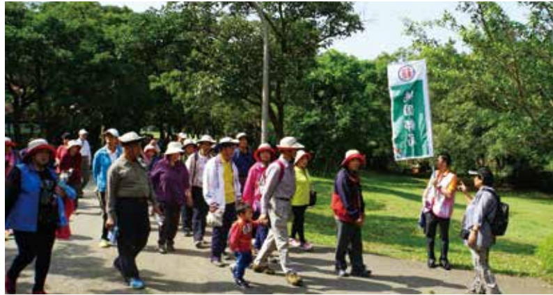
桃園郵局於楊梅埔心牧場舉辦銀髮族健行活動，約有 400 人踴躍參加。

十年前為了填補社福人力不足的缺口，中華郵政開始鼓勵郵差加入「送信兼送愛心」的關懷獨居老人活動，郵差藉著平日送信的機會，關心長輩們的起居，幫長輩代辦郵政相關業務、代購日用品，甚至協助就醫、領藥，最重要的是異常狀況通報，讓縣市政府或社福機構能第一時間做必要的處理，為長輩建立一張安全防護網。