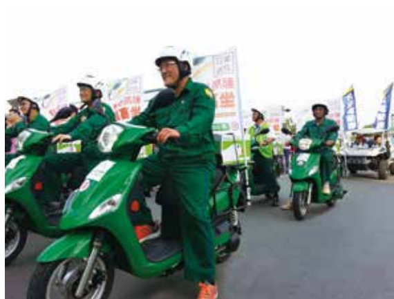
中華郵政將全面推動綠能電動機車。