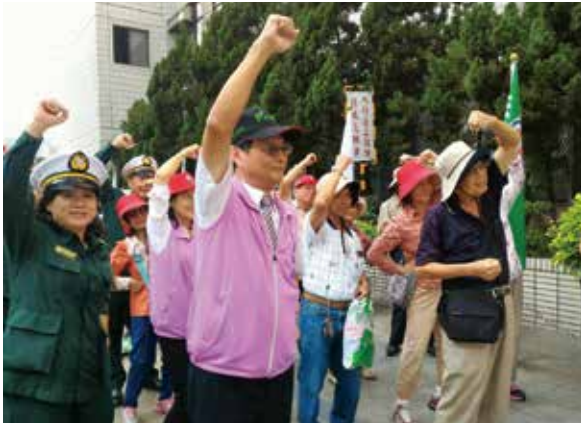
臺南郵局點亮樂齡樂活銀髮新活力。