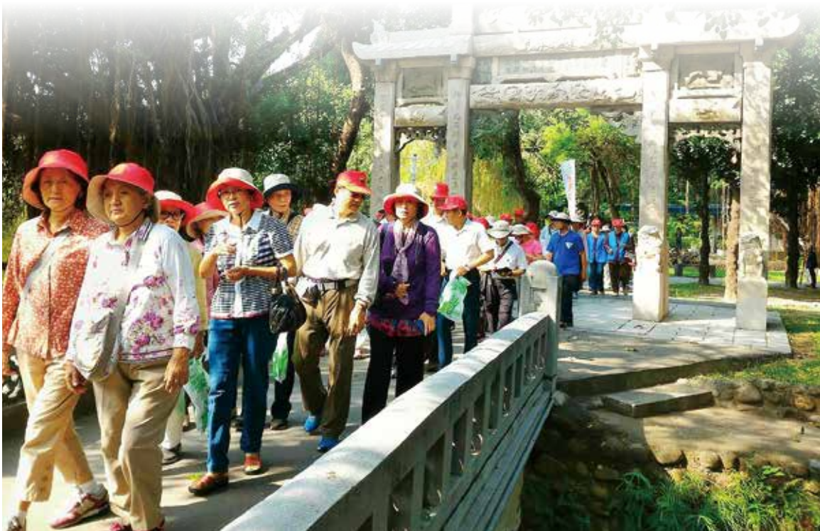
臺南郵局銀髮踏青樂悠郵，於百年歷史的臺南公園隆重登場。

長青人口越來越多，中華郵政為了鼓勵長者走出戶外，愈活愈健康，本年度舉辦一連串「中華郵政不老運動」的銀髮族戶外踏青活動，並推出「安心小額終老壽險」及規劃「長期照顧健康保險附約」商品，讓老有所養、老有所終的理想可以實現。