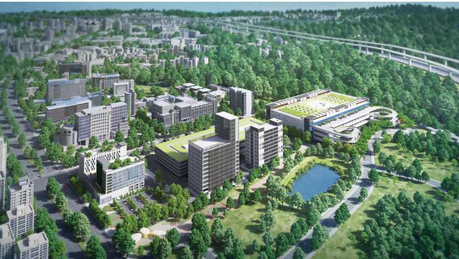
「郵政智慧物流園區」將成為臺灣物流產業新亮點。