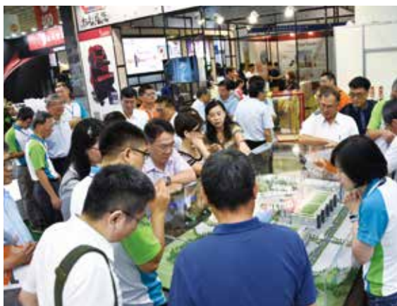
於台北國際物流展展出的「郵政智慧物流園區」模型。

預計 110 年完工啓用的「郵政智慧物流園區」，也以環保綠建築的概念規劃設計，除了太陽能發電、減少運輸碳排放、整合雨水收集淨化再利用