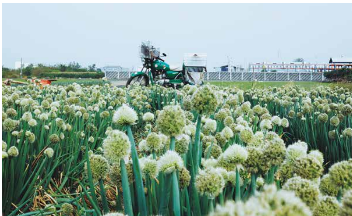
每年農曆二月才會開的蔥花田。

李翔笑說，一開始用手機拍照時，還會拍出歪歪斜斜的照片，慢慢拍出心得後，照片也獲得大家注意，開始覺得應該用專業一點的相機，於是，他改用單眼相機，加上兩顆定焦鏡頭，希望能更深刻記實這片美麗土地。