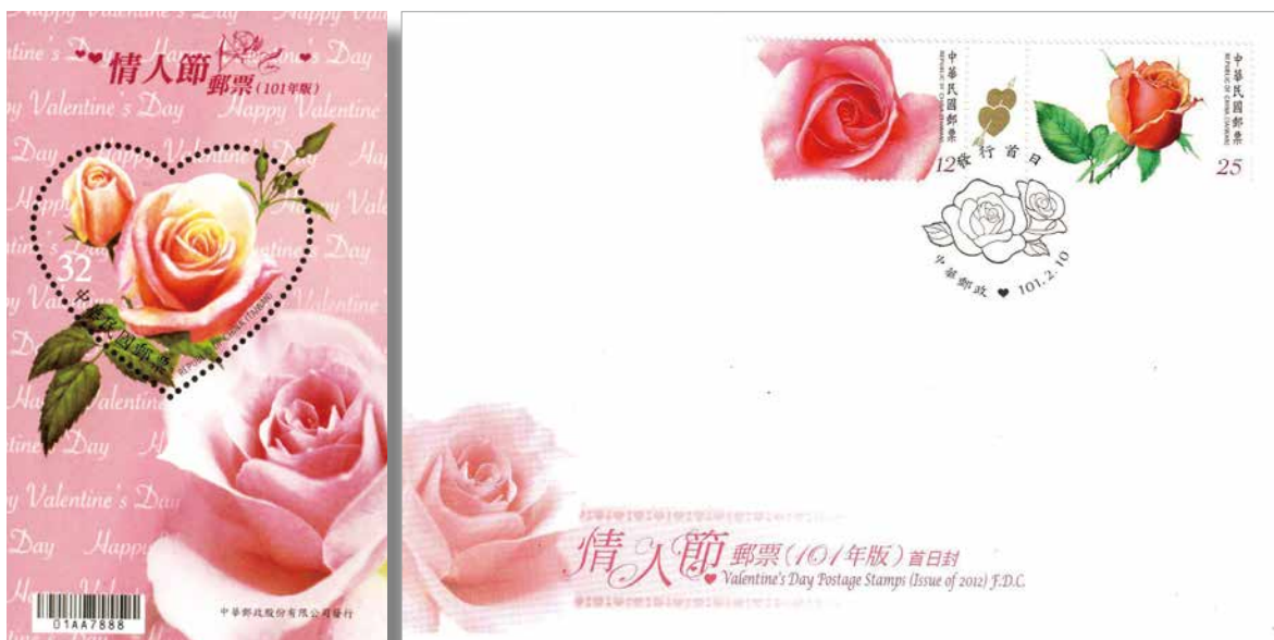
中華郵政在民國 101 年首次發行的香味郵票小全張。

情人節 向來是各國郵政非常重視的郵票設計主題之一，到底這股風潮是從什麼時候開始的？時間回到 1973 年 1 月 26 日，由美國郵政發行的「LOVE」郵票，是世界上第一枚情人節郵票，同時也開啓了各國以不同設計元素爭相印製情人節郵票、展現浪漫之路。