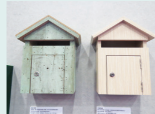
木頭信箱 木紋美, 歲月痕跡更是難以複製。