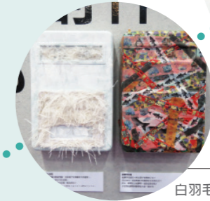
白羽毛信箱 & 紙膠帶信箱 羽毛, 瀟灑且輕盈飛揚, 也是黃子佼喜歡的天然產物。