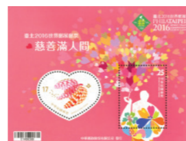
慈善日 慈善滿人間