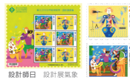
設計師日 設計展氣象