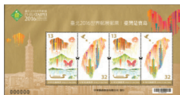
寶島日 臺灣是寶島