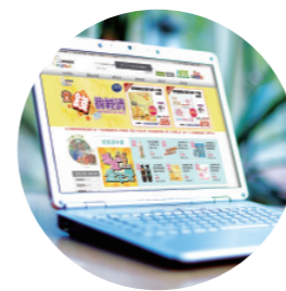
上網購物完成付款