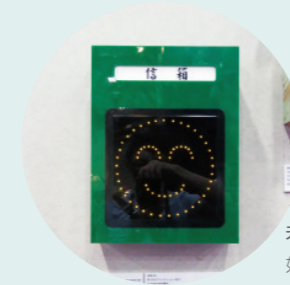
未來郵筒 如果郵筒也有表情符號? 是不是很可愛?