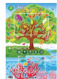
環保日 攜手護生態