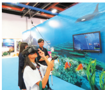
2 為了喚醒臺灣人對自己土地的認識和保育，齊柏林導演堅毅地拍攝完《看見臺灣》紀錄片。