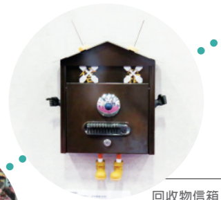
回收物信箱 回收物, 是垃圾? 還是寶?