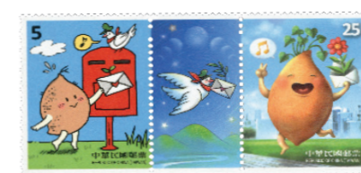
動漫日 樂享動漫趣