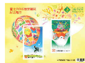
郵政日 傳承與創新