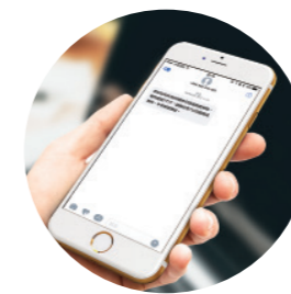
郵件送達 i 郵箱後 即能收到簡訊