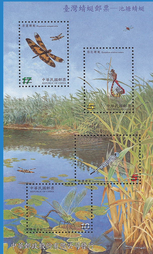
12.臺灣蜻蜓郵票—池塘蜻蜓 Taiwan Dragonflies Postage Stamps – Pond Dragonflies