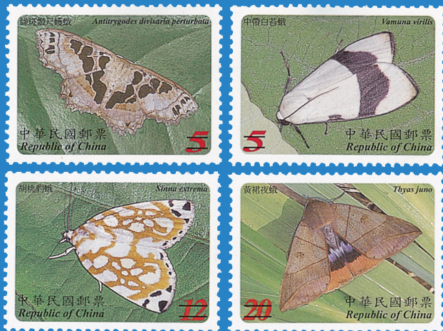
11.臺灣蛾類郵票 Taiwan Moths Postage Stamps