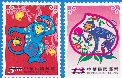
21. 新年郵票 (92年版) New Year's Greeting Postage Stamps (Issue of 2003)