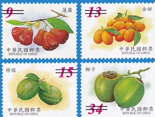
4. 水果郵票 (第4輯) Fruits Postage Stamps (IV)