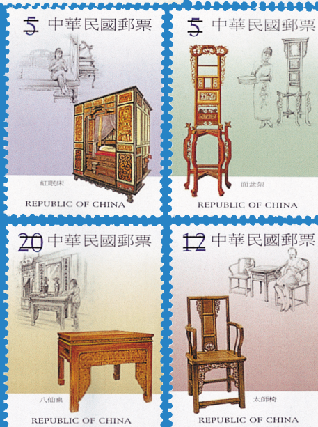
9.臺灣早期生活用具郵票－傢俱 Implements from Early Taiwan Postage Stamps - Furniture