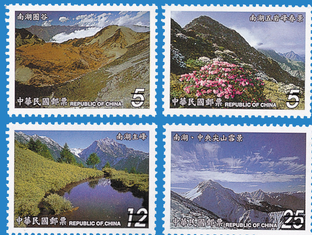
3. 臺灣山岳郵票－南湖大山 Taiwan Mountains Postage Stamps-Mount Nanhu