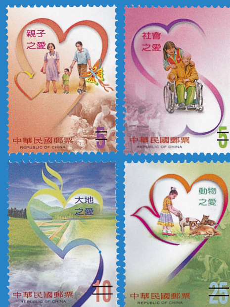
5. 愛心郵票 Caring Heart Postage Stamps