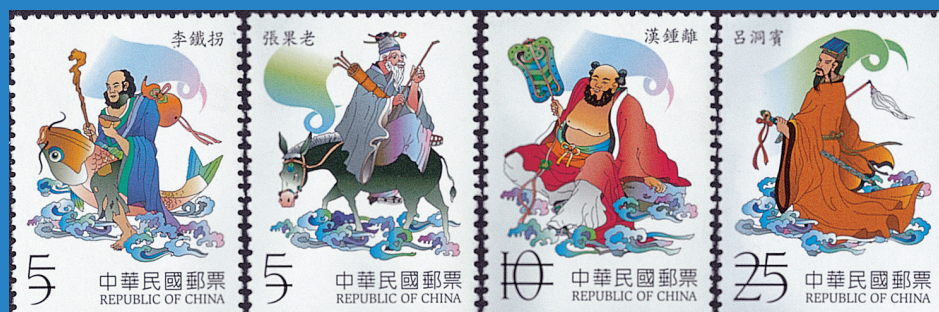
10.中國民間故事郵票－八仙過海（上輯） Chinese Folklore Postage Stamps-The Eight Immortals Cross the Sea (I)