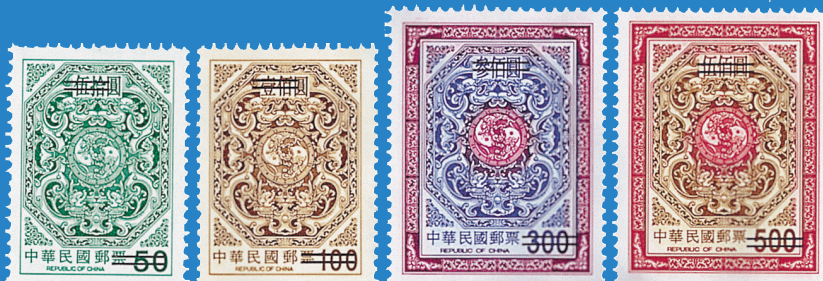
16.添印二版夔龍團雙鯉郵票 Additional Print of 2nd Print of Dragons Circling Two Carps Postage Stamps