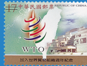
2. 加入世界貿易組織週年紀念郵票 The Anniversary of the Accession to the World Trade Organization Com. Issue