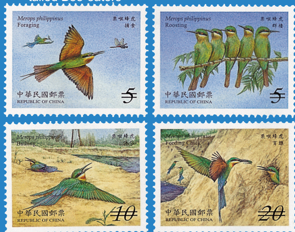
8.保育鳥類郵票－栗喉蜂虎 Conservation of Birds Postage Stamps-Blue-tailed Bee-eaters