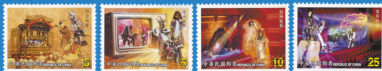
7.地方戲曲郵票－布袋戲（掌中風雲） Regional Opera Series -Taiwanese Puppet Postage Stamps (A World at Hand)