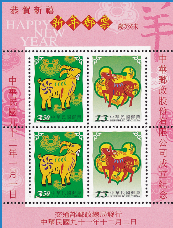
1. 中華郵政股份有限公司成立紀念小全張 The Establishing of Chunghwa Post Co., Ltd. Com. Souvenir Sheet