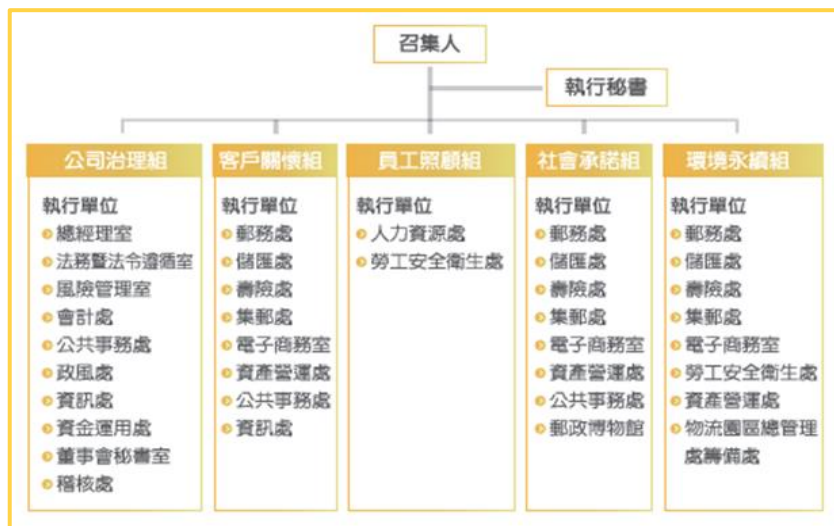
中華郵政 CSR 推動小組主要任務